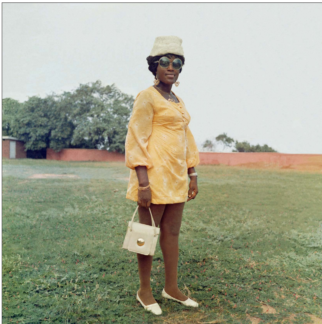
Figure 18. James Barnor, Une invitée à un mariage dans le parc à l'arrière de la Holy Trinity Cathedral, Accra, vers 1971