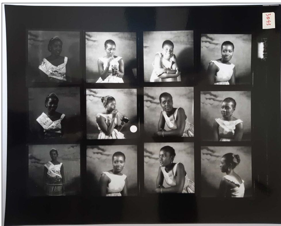
Figure 6. James Barnor, Miss Accra, Studio Ever Young, Accra, Ghana, 1957 Planche-contact de négatifs numérisés et positifs, 6 x 6 cm.