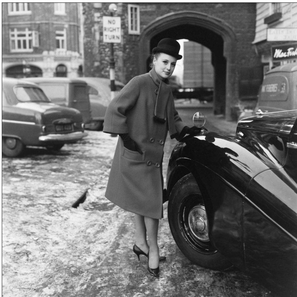
Figure 7. James Barnor, Sans titre [Modèle posant pour un travail étudiant], Rochester, Kent, vers 1962