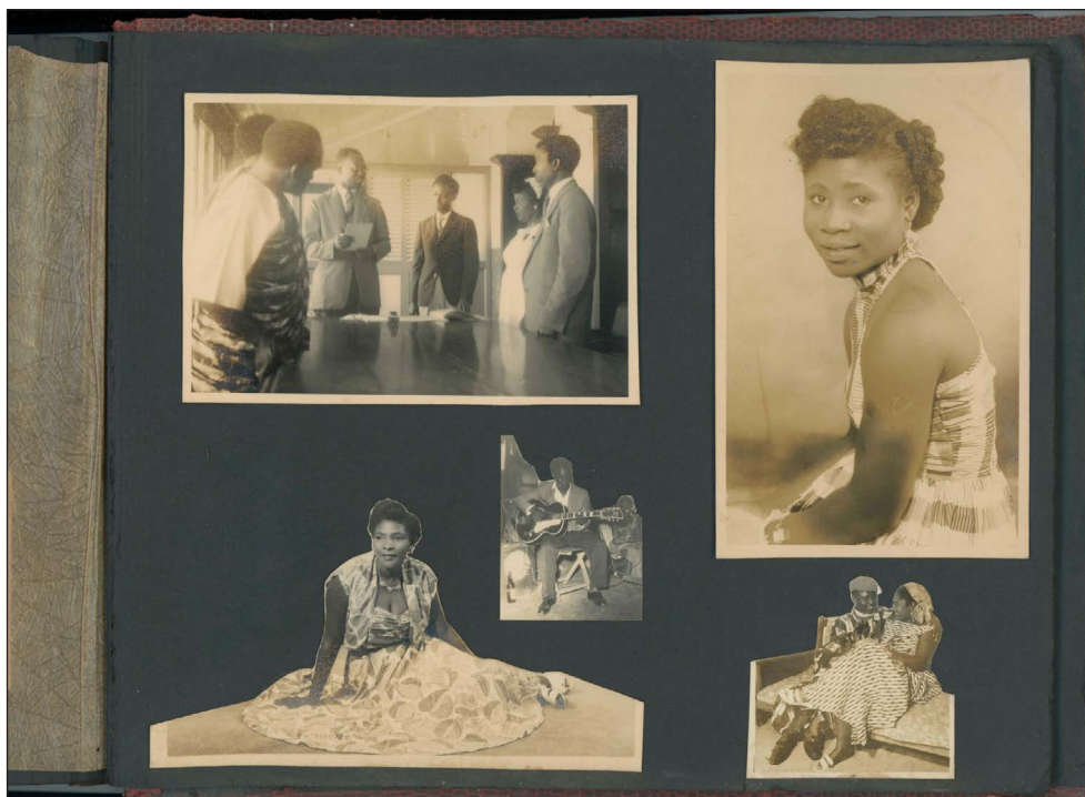
Figure 5. James Barnor, Sans titre [page extraite d'un album d'époque], Studio Ever Young, Accra, Ghana, vers 1953