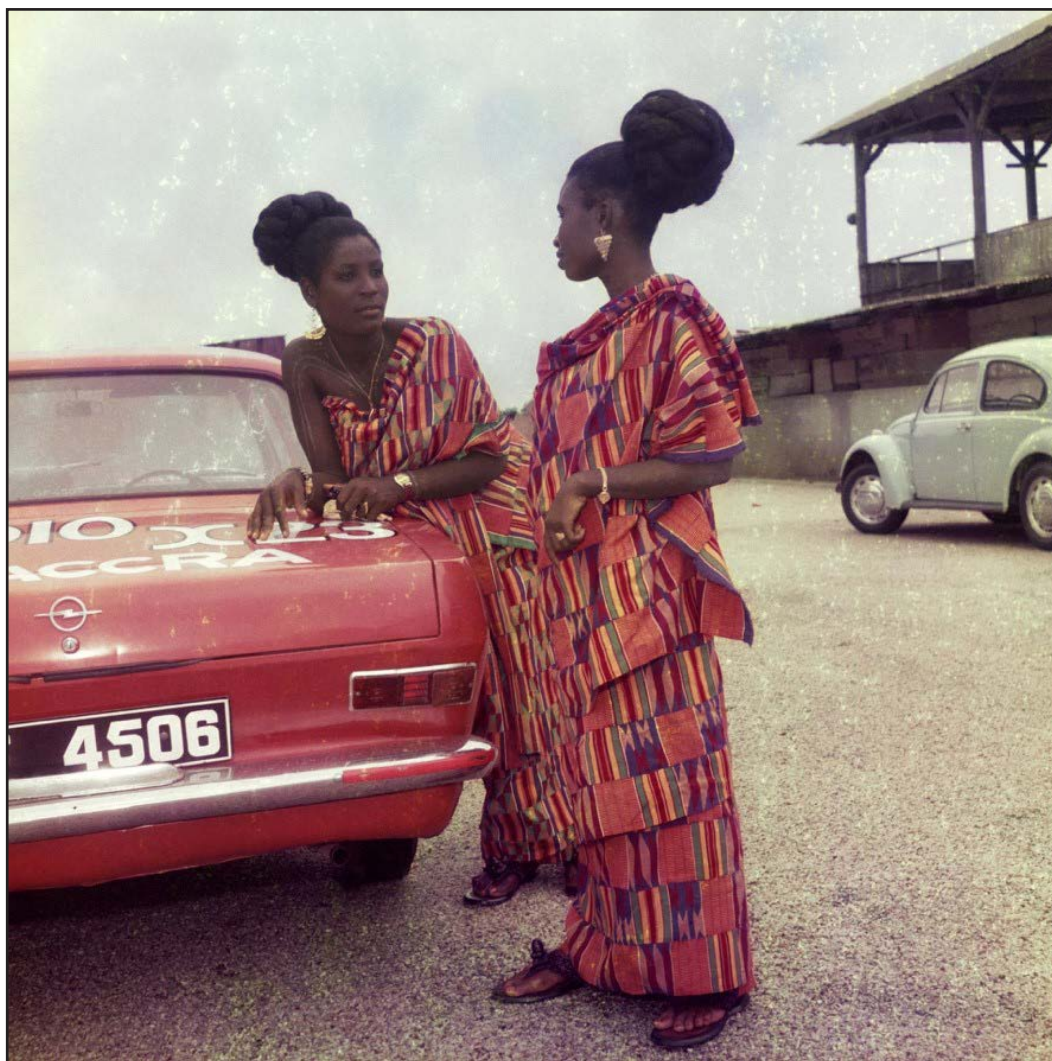
Figure 19. James Barnor, Sans titre [Deux amies habillées pour une cérémonie à l'église], vers 1972