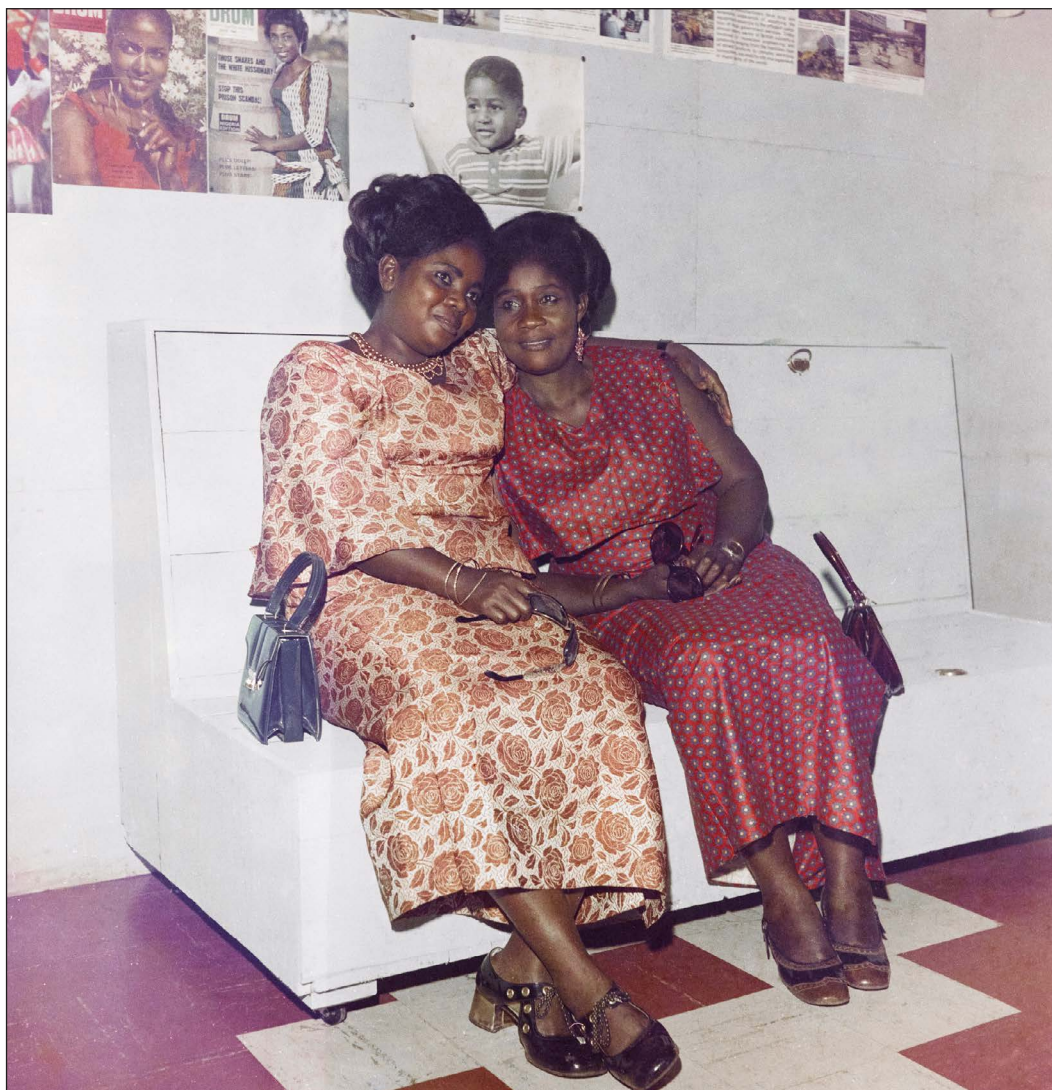
Figure 1. James Barnor, Sans titre [portrait de deux amies devant des unes de Drum ], Accra, vers 1972

Négatif en couleurs numérisé et positif, 6 x 6 cm.