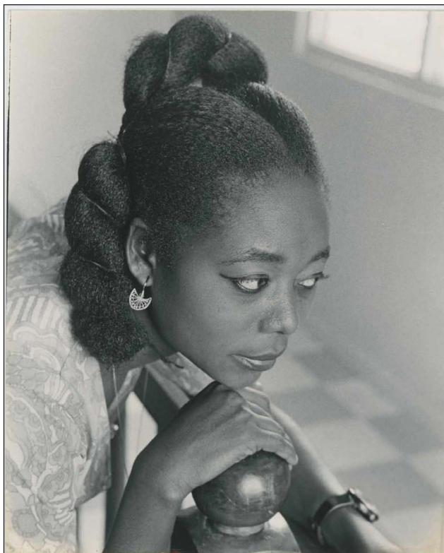
Figure 15. James Barnor, La secrétaire de Sammy Tetteh à son bureau, Adabraka, Accra, années 1970