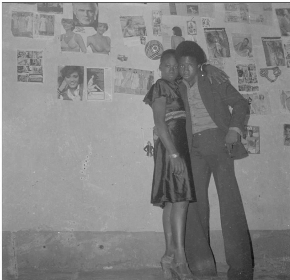
Figure 20. Sory Sanlé, « Les amoureux timides », Burkina Faso, 1975

Nombre de photographes exerçant dans des pays limitrophes du Ghana traduisent son influence dans leurs portraits, tels Sory Sanlé (1943-) au Burkina Faso qui fait poser vers 1975 deux amoureux en tenues de soirée devant un assemblage de pages découpées dans des magazines de mode et collées sur les murs de son studio (fig. 20). Si les magazines noirs et la culture visuelle africaine-américaine se sont frayé un chemin dans les pratiques de photographes ghanéens comme Barnor, force est de constater à travers les choix d'images de Sory Sanlé que les modèles genrés blancs continuent d'être une référence incontournable au même moment ailleurs en Afrique de l'Ouest.