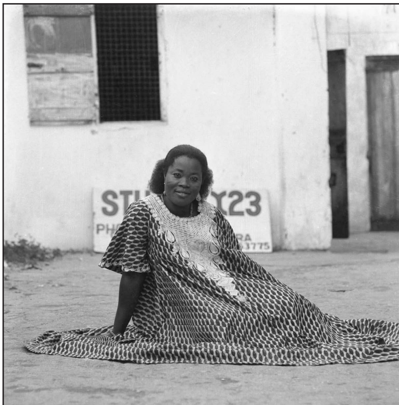
Figure 14. James Barnor, Portrait d'une femme, Studio X23, Accra, vers 1975 Négatif numérisé et positif, 6 x 6 cm.