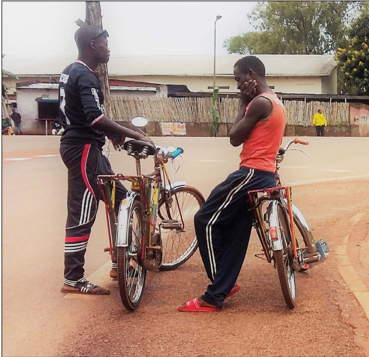
20. Binôme « Taxis-vélos et motos » : des conducteurs de vélos attendant des clients, Gitega, 3 avril 2018

Photo prise au téléphone, fichier image original (72 dpi, 1305 x 1254 px).