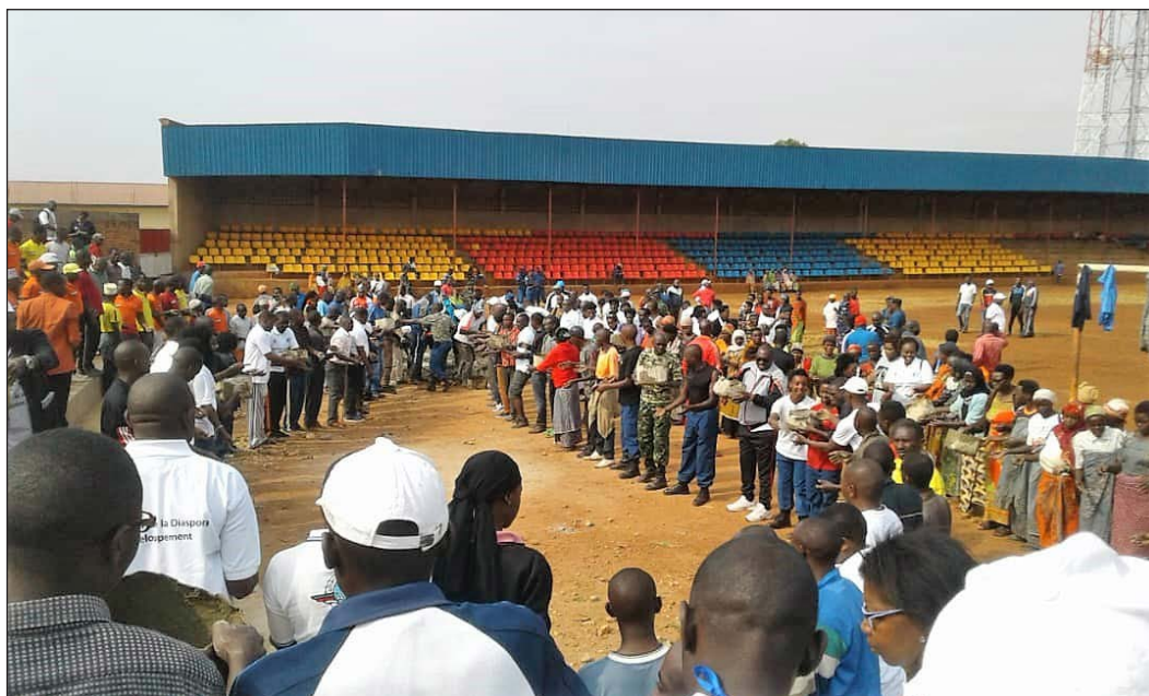
18. Binôme « Travaux communautaires » : aménagements au stade Kugasaka pendant la « semaine de la diaspora », Ngozi, 26-27 juillet 2018

Photo prise au téléphone, fichier image original (96 dpi, 1080 x 648 px).