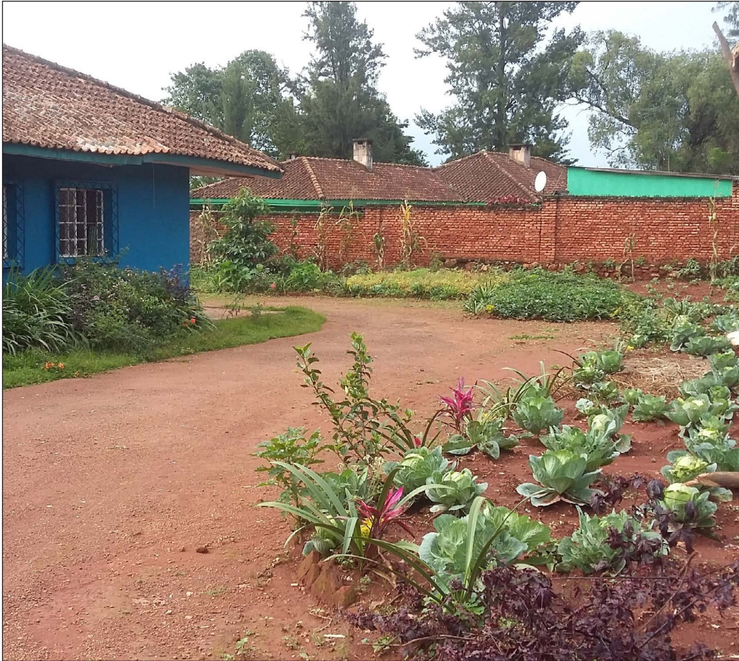
24. Binôme « Agriculture urbaine » : une maison d'habitation privée et sa parcelle de culture maraîchères, Gitega, 3 avril 2018

Photo prise au téléphone, fichier image original (72 dpi, 1982 x 1769 px).