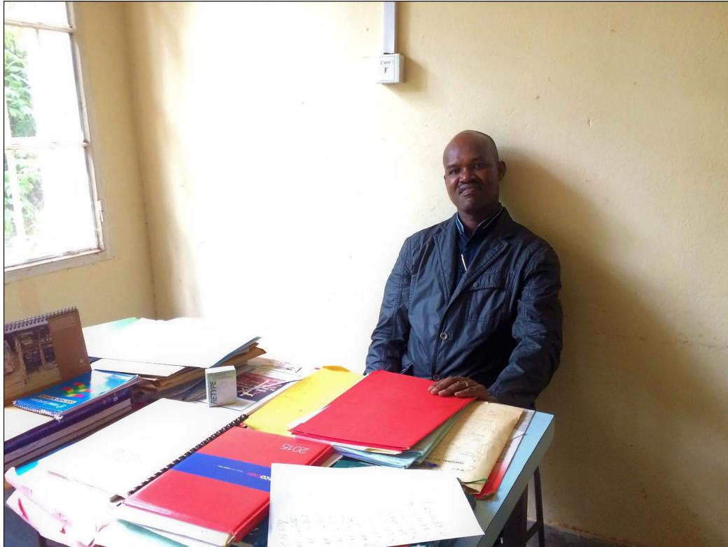
13. Après l'entretien, Charles N., magistrat traitant d'affaires impliquant des domestiques au Tribunal de grande instance de Gitega, 3 avril 2018