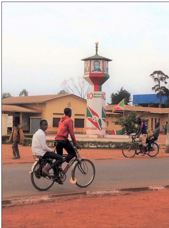
16. Taxis-vélos photographiés en activité depuis la rue, devant le Parquet de Ngozi, 26 juillet 2018

Photo prise au téléphone, fichier image original (72 dpi, 2148 x 2860 px).