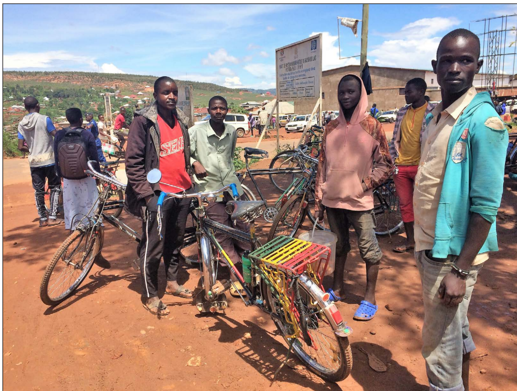
14. Après l'entretien, les taxis-vélos sur leur parking, quartier Yoba, Gitega, 20 novembre 2019