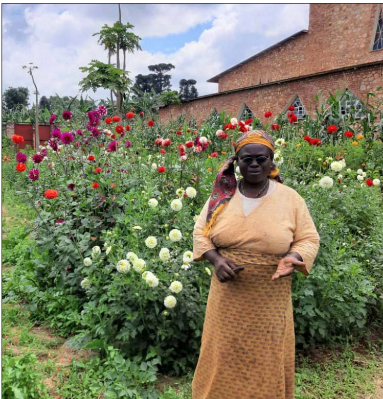
21. Binôme « Agriculture urbaine » : la Sœur responsable des activités agricoles et horticoles au Centre Theresia de Mushasha, Gitega, 5 avril 2018

Photo prise au téléphone, fichier image original (96 dpi, 733 x 756 px).