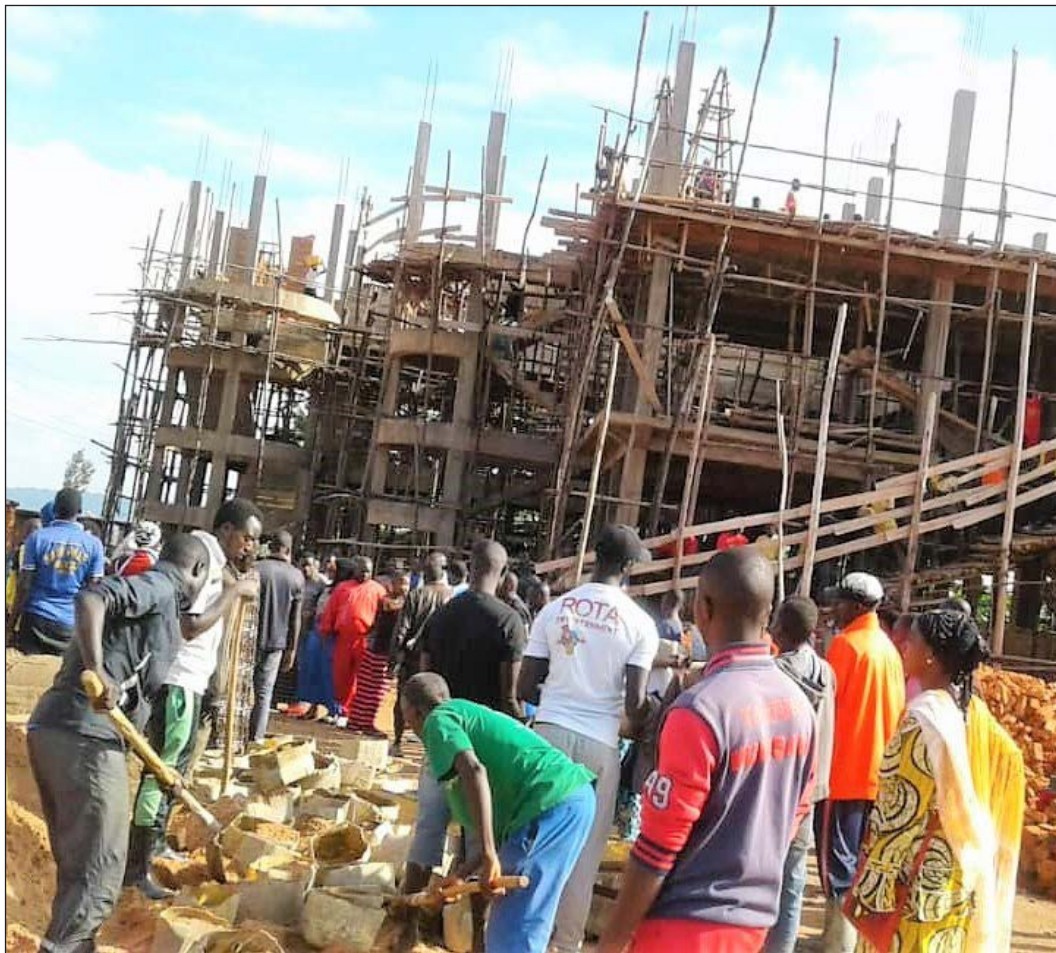
17. Binôme « Travaux communautaires » : construction de l'École technique secondaire du quartier Kinyami II, Ngozi, 25 mai 2019

de la prise de vue. Une autre façon de faire a consisté à isoler sur la pellicule des sites sans présence humaine ou presque, ce qui a permis d'évacuer les questions de droits à l'image et d'économie monétaire. Des lieux du travail ou de réunions des travailleurs ont ainsi été photographiés, sans les travailleurs, comme cette façade du siège de l'Association des motards du Burundi (Amotabu) à Gitega (cliché 23) ou cette terre cultivée dans une parcelle privée de la même ville, où l'on voit un potager sans les habitants qui l'ont cultivé (cliché 24). Il y a bien des données exploitables dans ces clichés. Par exemple, on observe que la permanence de l'Amotabu (la plus puissante des fédérations de chauffeurs de motos) était fermée, comme elle l'a été à chaque passage du binôme travaillant sur les taxis-motos, ce qui questionne sur les modalités de rencontre entre responsables et membres de l'association. Ou encore, on peut distinguer dans la parcelle de la maison d'habitation (cliché 24) l'alternance de plantes d'agrément avec des choux et du maïs, ce qui informe sur les choix cultureux des citoyens cultivateurs. Toutefois, l'absence des protagonistes laisse une impression de vide et de silence, alors que tout est habituellement agitation et bruit dans les activités de la route comme de l'agriculture.