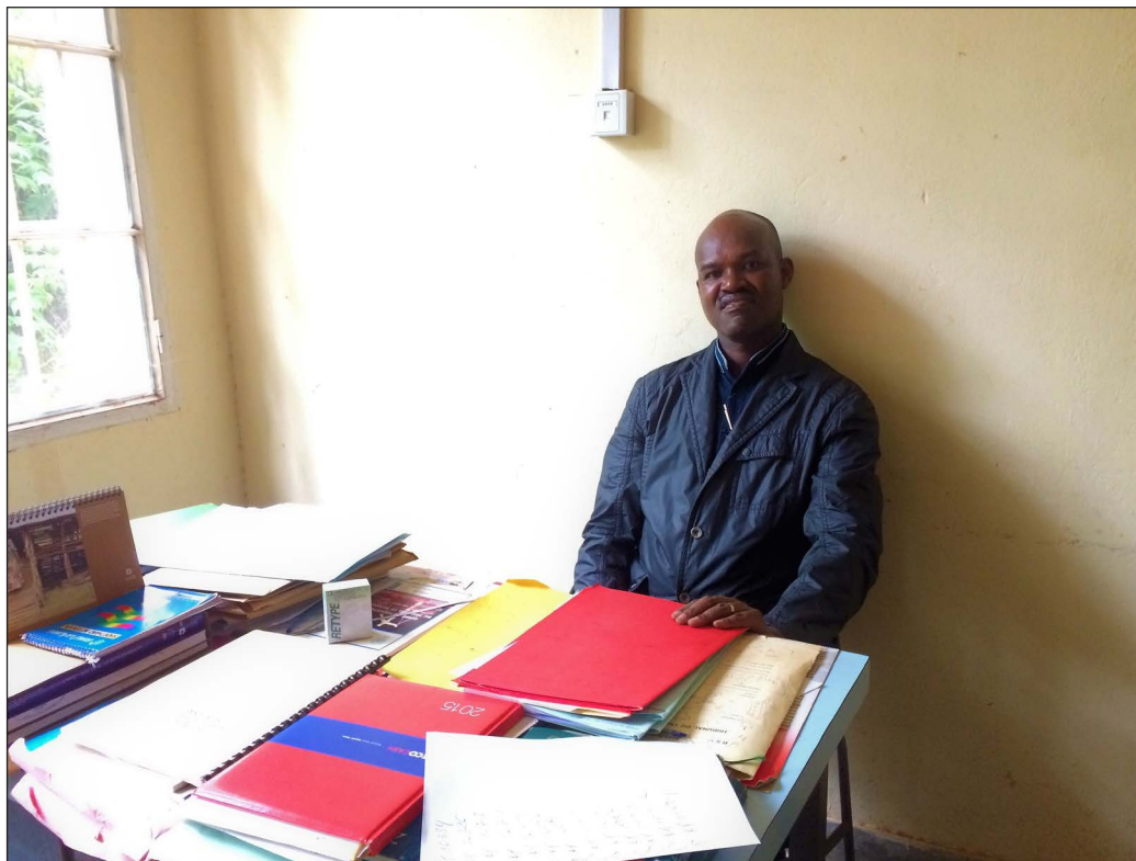
13. Après l'entretien, Charles N., magistrat traitant d'affaires impliquant des domestiques au Tribunal de grande instance de Gitega, 3 avril 2018