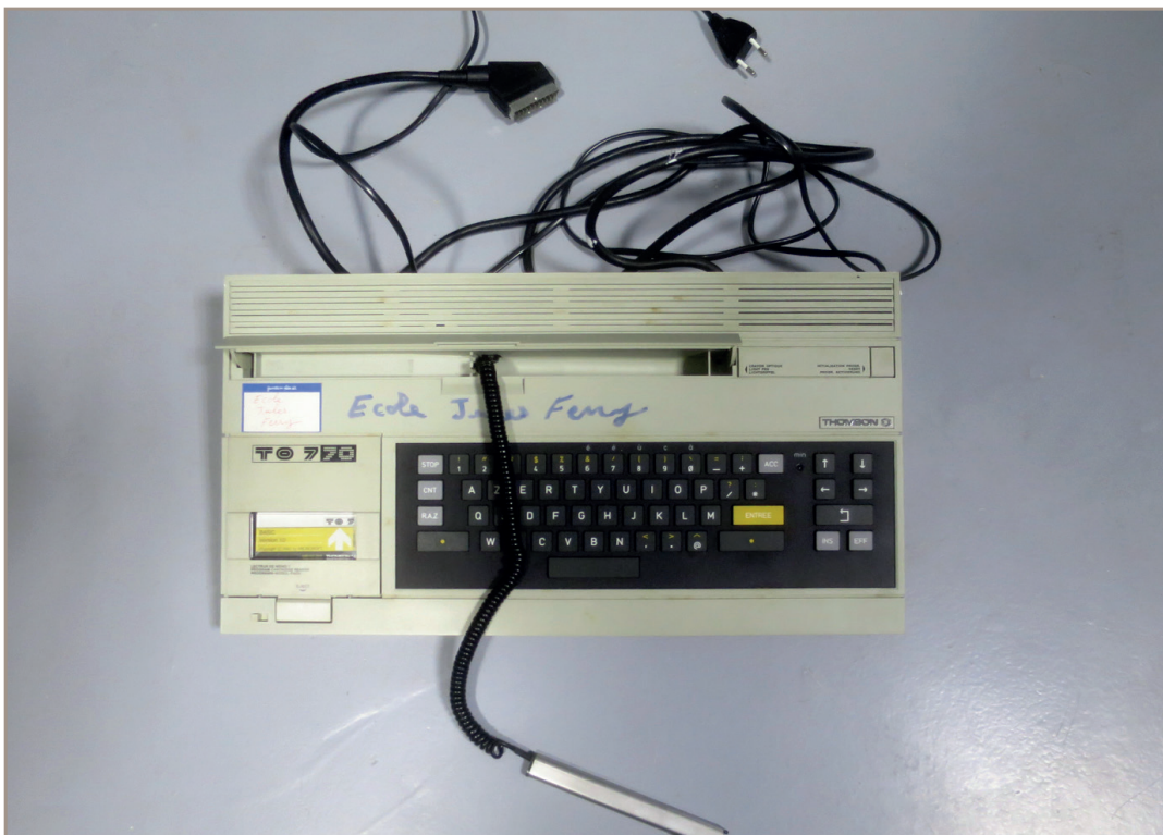
Figure 1 - L'ordinateur Thomson TO7/70, ses périphériques d'entrée (clavier et stylo optique) et câble de sortie (péritel) et leur emballage