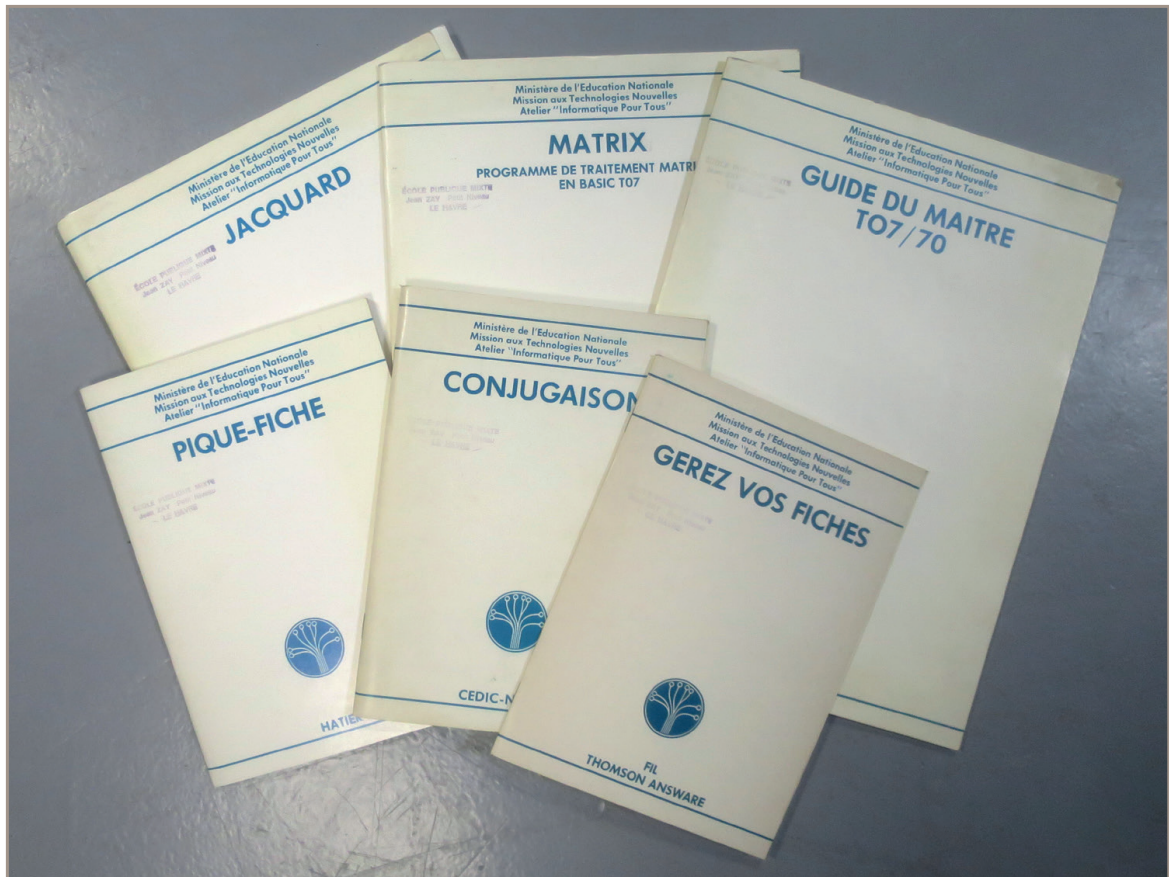
Figure 3 - Sélection de manuels accompagnant les programmes sur cassettes

Notons que la définition d'affichage du TO7/70 était 320 x 200 pixels en 16 couleurs. L'argumentaire commercial est le suivant : « Avec Colorpoint, si vous avez un micro, vous savez dessiner ».