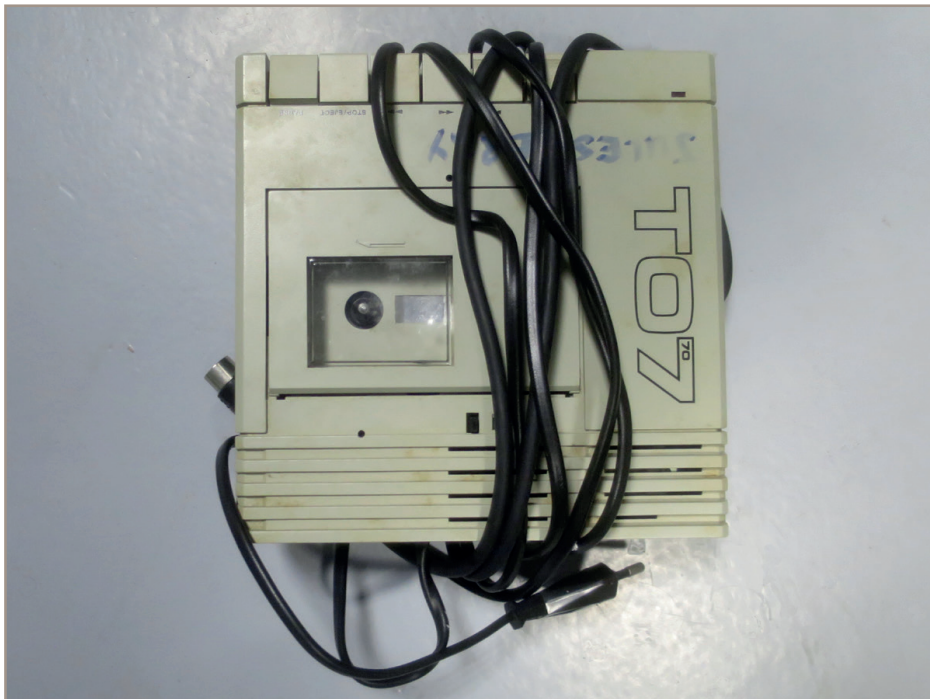
Figure 2 - Le lecteur de cassettes T07 et son emballage