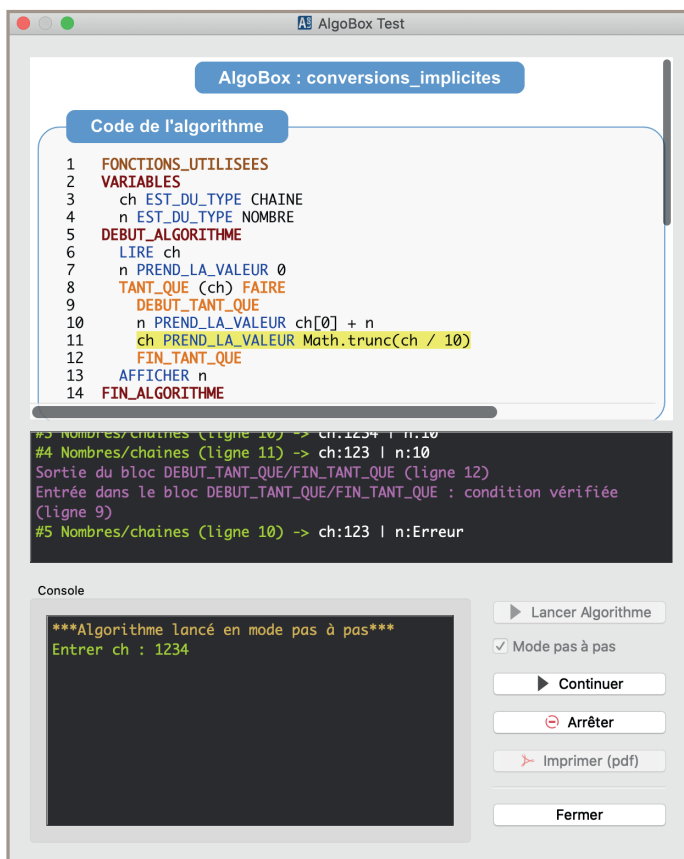
Figure 2 - Fenêtre d'exécution