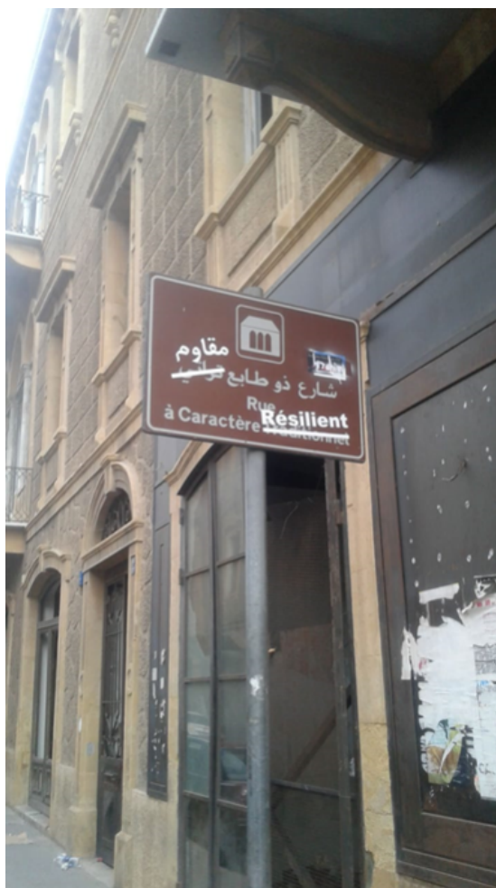
Figure 2. L'usage populaire du terme « résilient » dans le quartier de Gemmayzeh.