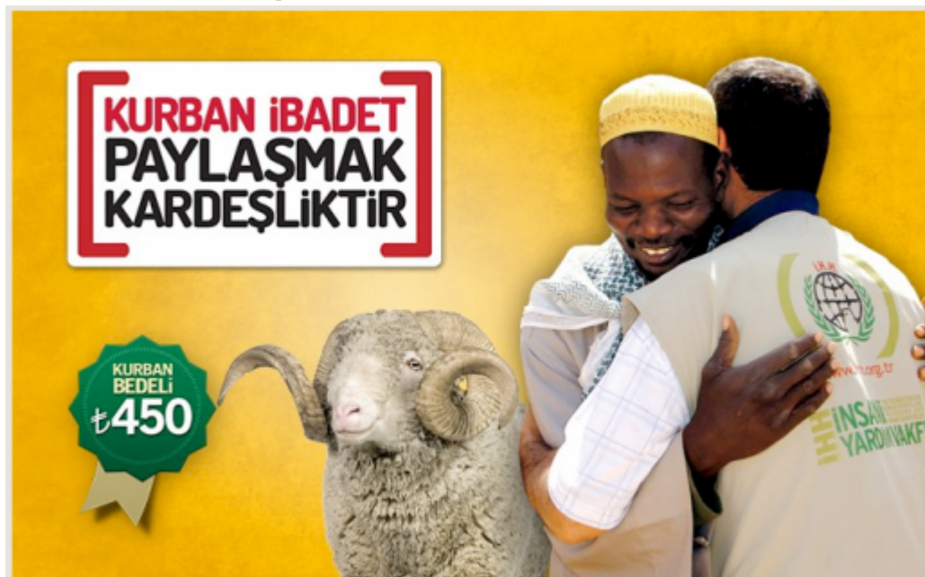
Figure 10 : Page online donation pour le kurban , ONG IHH (2014)