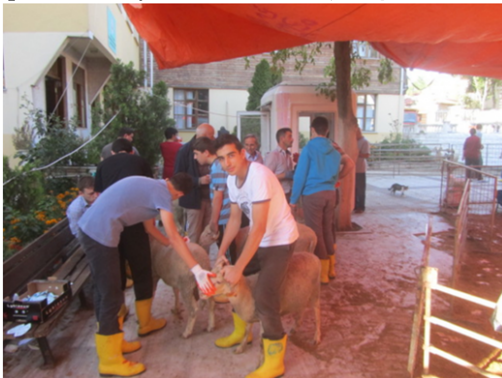
Figure 2 : Kurban Bayramı dans une école du quartier de Zeytinburnu (Istanbul, 2014).