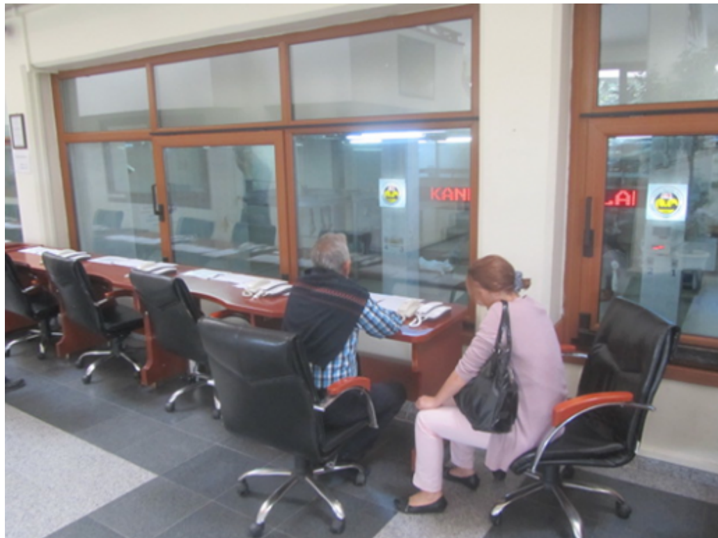
Figure 6 : Adak kurban dans l'abattoir municipal d'Eyüp (Istanbul, 2014)