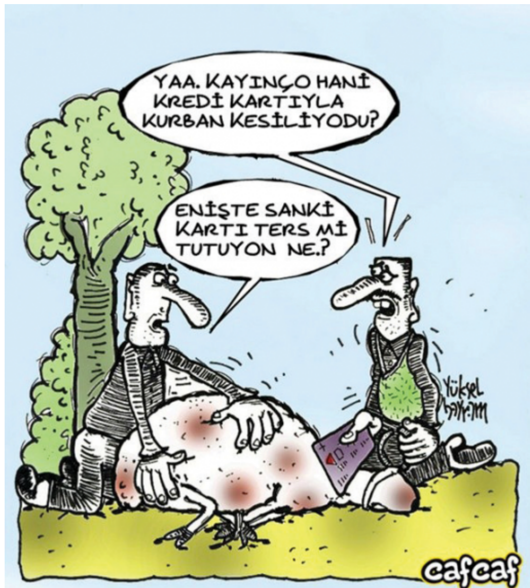
Figure 11 : Kredi kartıyla kurban kesilir mi ? (Peut-on sacrifier une victime avec une carte de crédit ?)

commerciales et humanitaires développées plus haut constituent deux facettes complémentaires.