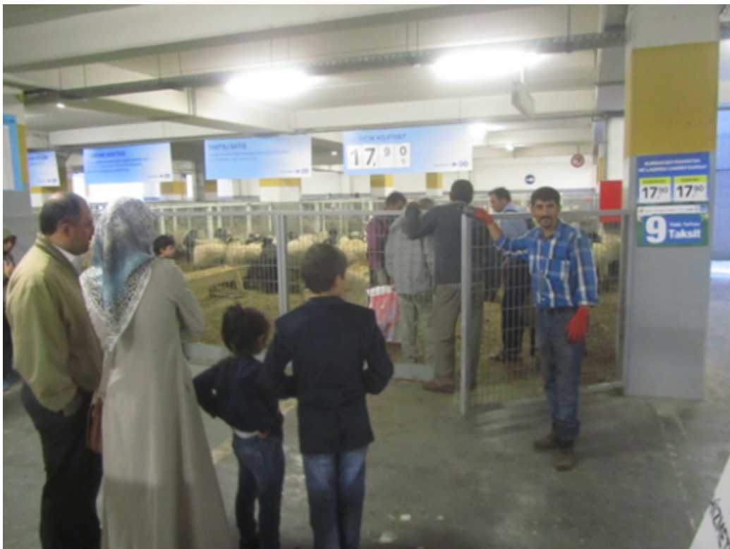
Figure 4 : Kurban Bayramı dans l'hypermarché Carrefour SA, municipalité de Bayrampaşa (Istanbul, 2014)