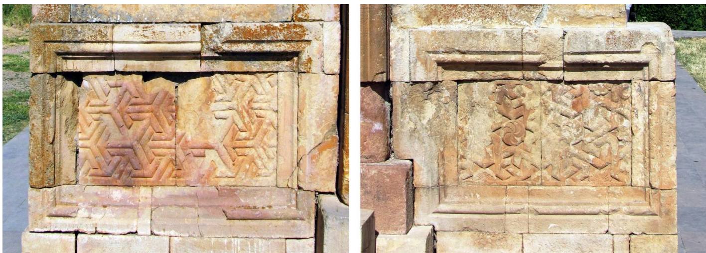
Fig. 11b. Monastère de Noravanq, deux piédestaux de khatchqar (à gauche : c. 1318 ; à droite : motif un peu différent).