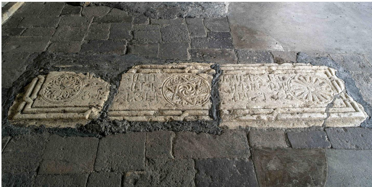
Fig. 3. Monastère de Gandzassar (Artsakh). Intérieur du narthex. Pierre tombale du prince Hassan Djalal-Dawla de Khatchèn (1261).