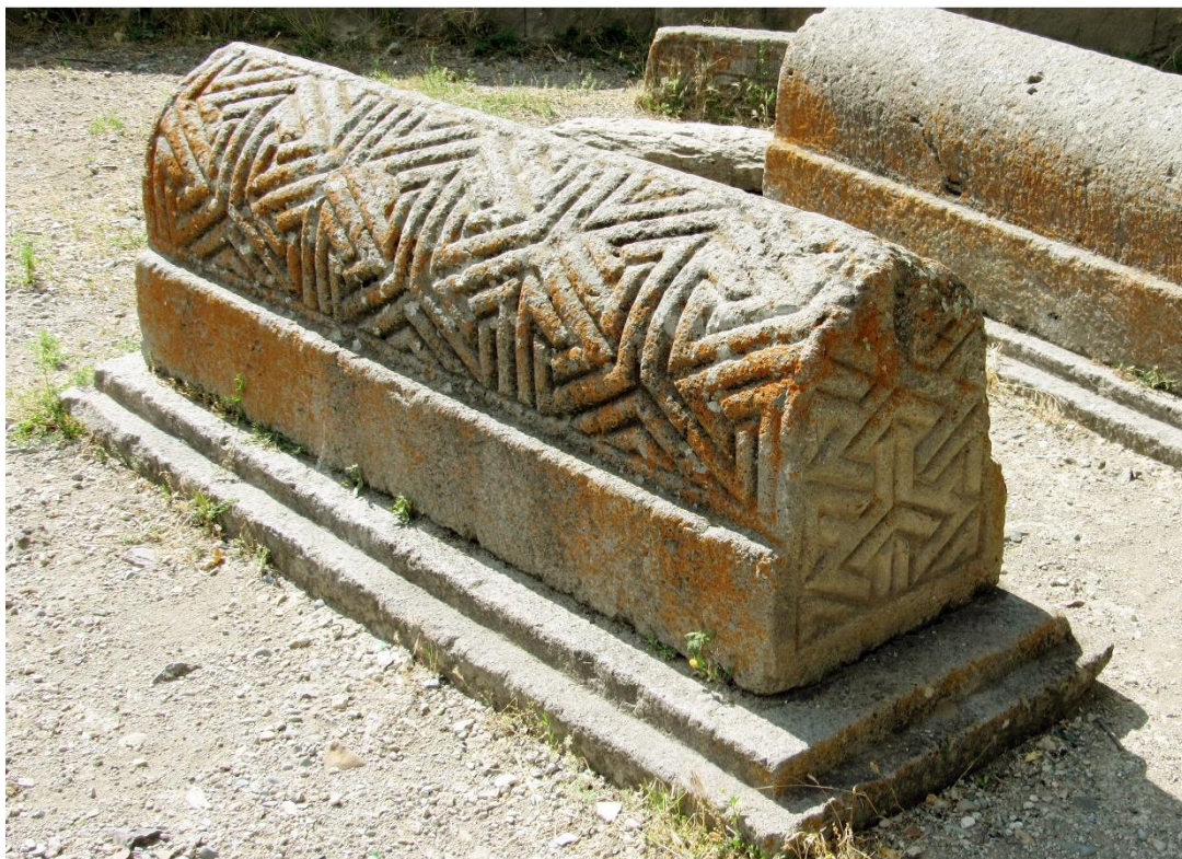
Fig. 11a. Éghéguis, cimetière des Orbélian. Pierre tombale de Səmbat (1280)