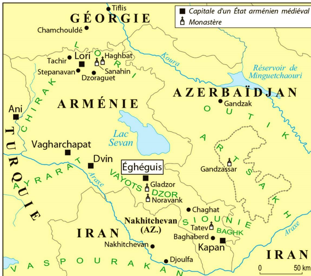
Fig. 1. Éghéguis dans l'Arménie du Nord-Est au Moyen Âge. Carte Eric van Lauwe