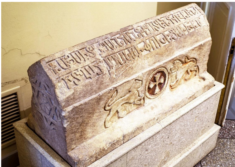
Fig. 14. Solkhat / Saryi Krym (Crimée), pierre tombale arménienne (1362), aujourd'hui à l'Ermitage, Saint-Pétersbourg, n° inv. sol-28.