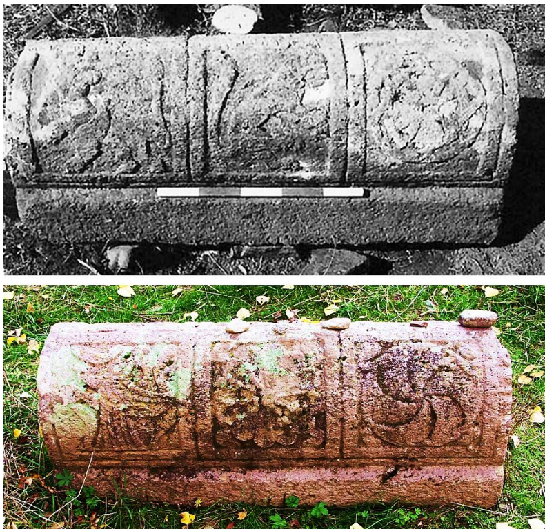
Fig. 8. Éghéguis, cimetière juif. Pierre tombale n° 6.