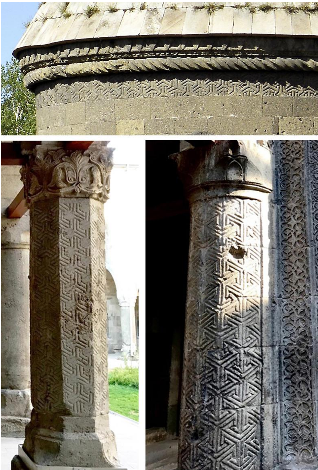
Fig. 12. Erzurum. A) Bas : Médressé aux deux minarets (2 e moitié du XIII e siècle).