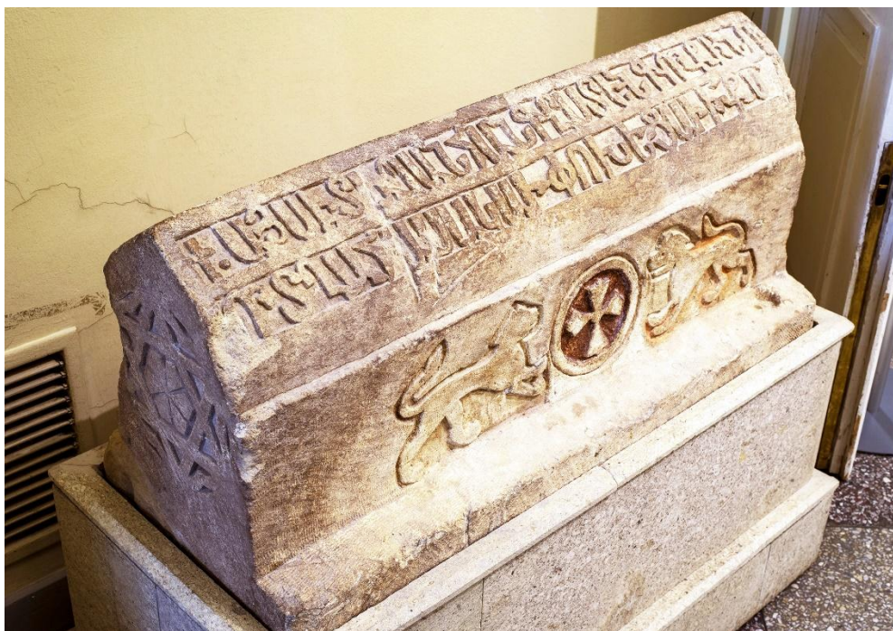
Fig. 14. Solkhat / Saryi Krym (Crimée), pierre tombale arménienne (1362), aujourd'hui à l'Ermitage, Saint-Pétersbourg, n° inv. sol-28.