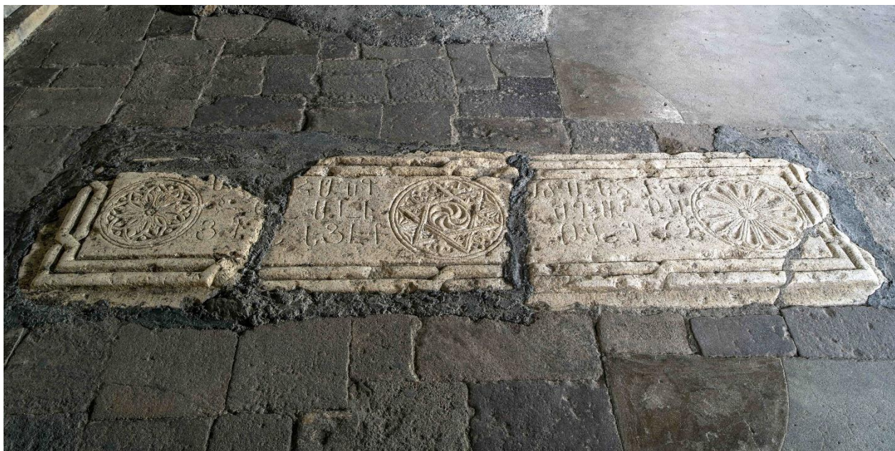
Fig. 3. Monastère de Gandzassar (Artsakh). Intérieur du narthex. Pierre tombale du prince Hassan Djalal-Dawla de Khatchèn (1261).