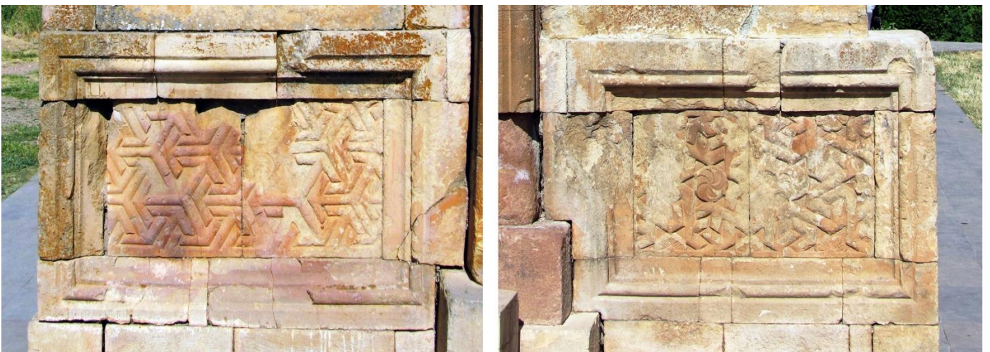
Fig. 11b. Monastère de Noravanq, deux piédestaux de khatchqar (à gauche : c. 1318 ; à droite : motif un peu différent).