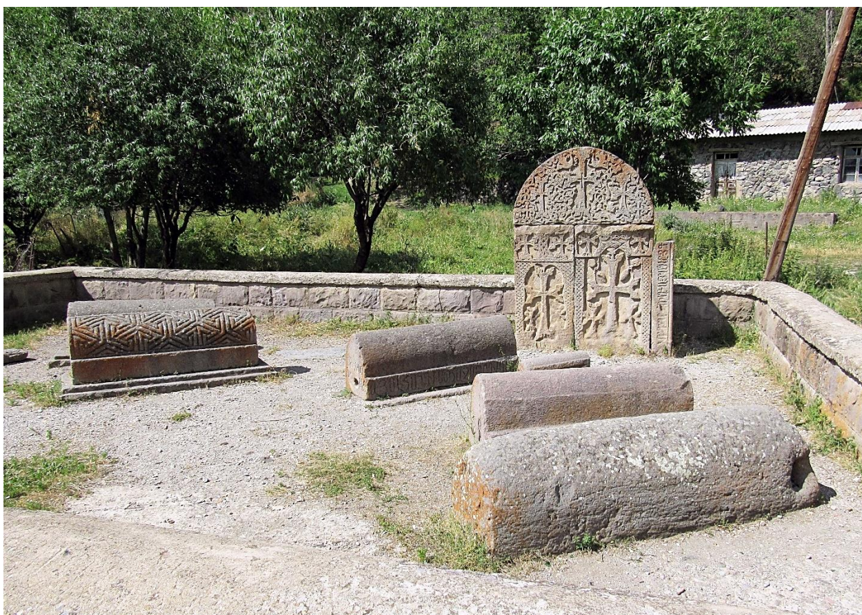
Fig. 4. Éghéguis, cimetière des Orbélian. Vue du sud. Au fond, à droite, le monument à deux khatchkars (entre 1273 et 1290).