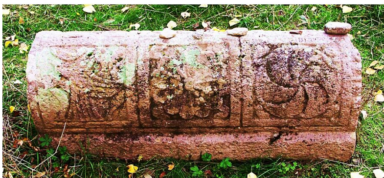
Fig. 8. Éghéguis, cimetière juif. Pierre tombale n° 6. Photo en noir et blanc (haut) : d'après Stone & Amit 2006, p. 104, fig. 28