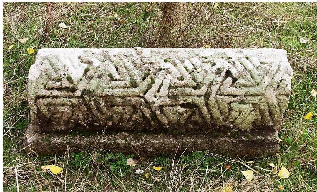
Fig. 10. Éghéguis, cimetière juif. Pierre tombale n° 9.