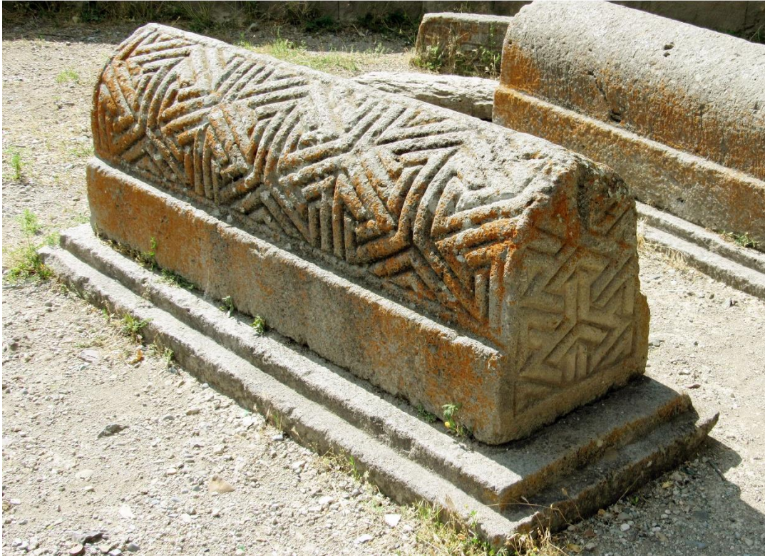
Fig. 11a. Éghéguis, cimetière des Orbélian. Pierre tombale de Səmbat (1280)