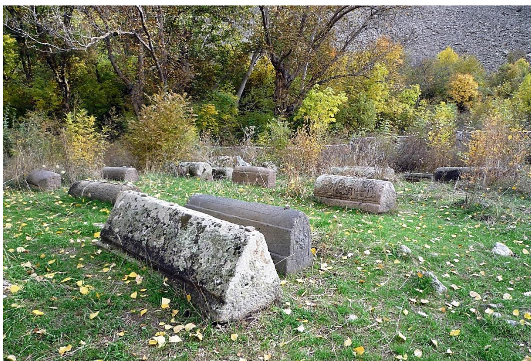
Fig. 6. Éghéguis, cimetière juif. Vue partielle du nord-ouest.