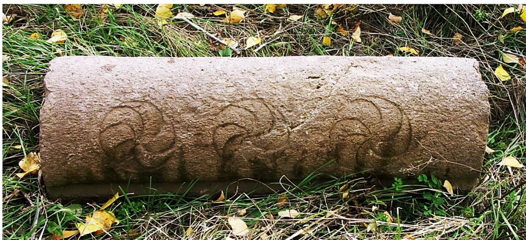
Fig. 9. Éghéguis, cimetière juif. Pierres tombales n° 12 et 41.