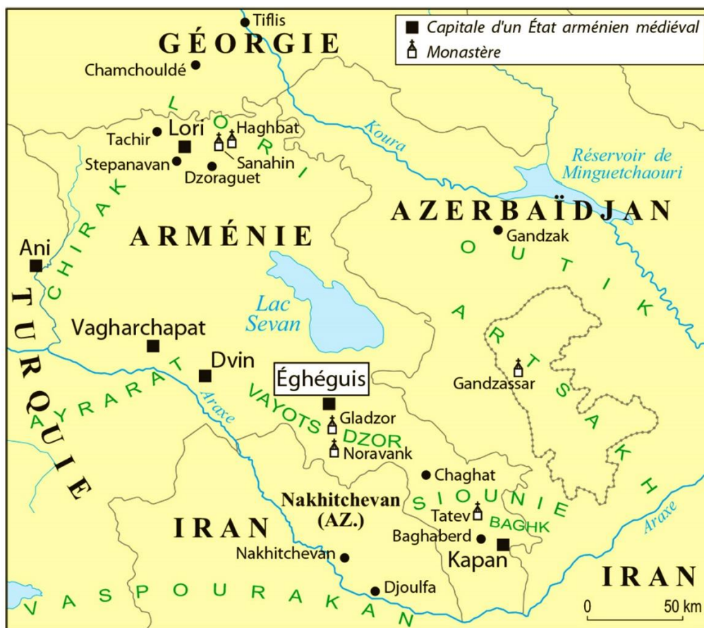
Fig. 1. Éghéguis dans l'Arménie du Nord-Est au Moyen Âge. Carte Eric van Lauwe