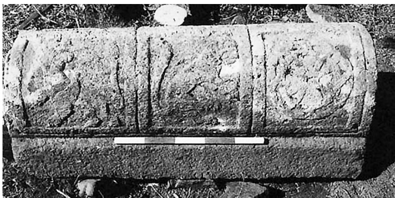
Fig. 7. Éghéguis, cimetière juif. Quelques-unes des inscriptions. D'après Amit & Stone 2002, p. 75 (inscr. 1), 76 (inscr. 2 et 3), 77 (inscr. 5), 79 (inscr. 7 et 8), 82 (inscr. 10) et Stone & Amit 2006, p. 108 (inscr. 19)