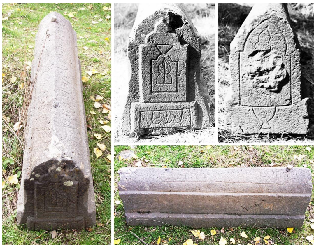
Fig. 13. Éghéguis, cimetière juif. Pierre tombale n° 49. En haut, à droite : d'après Stone & Amit 2006, p. 132, fig. 9 et p. 133, fig. 12 ; à gauche et en bas : photos auteur