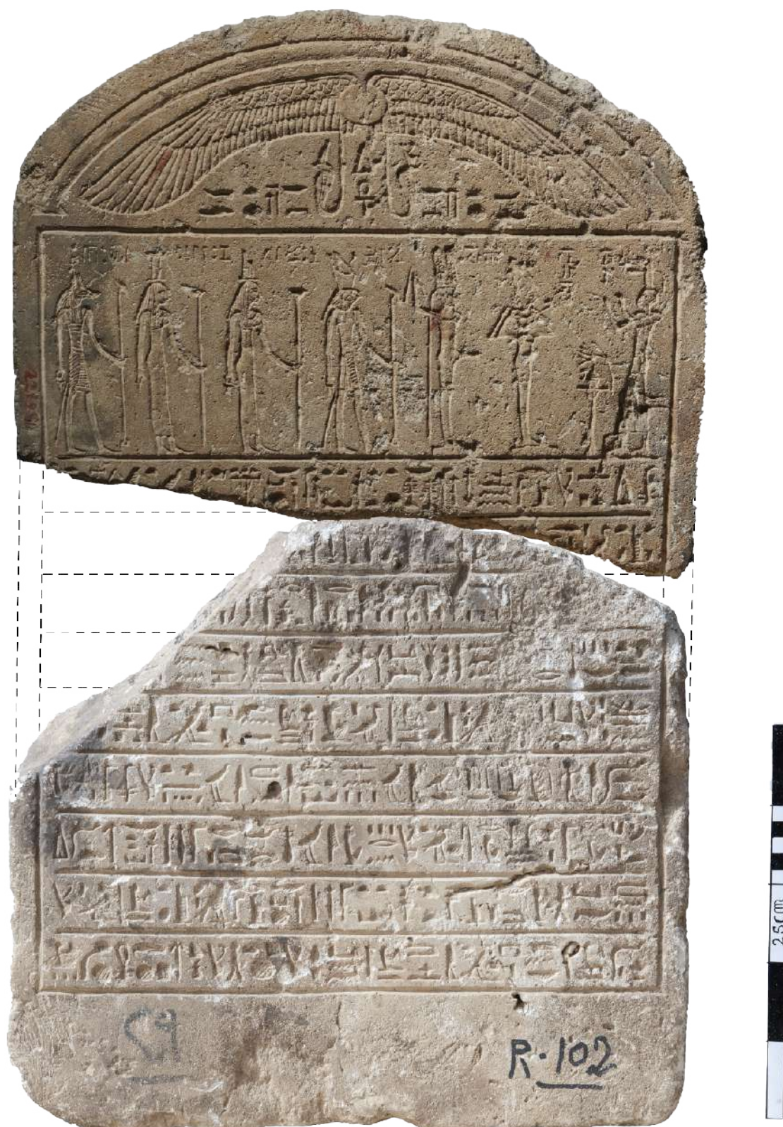
Fig. 3. Proposition de raccord entre les fragments Caire CG 22128 et Gadaya R-102.