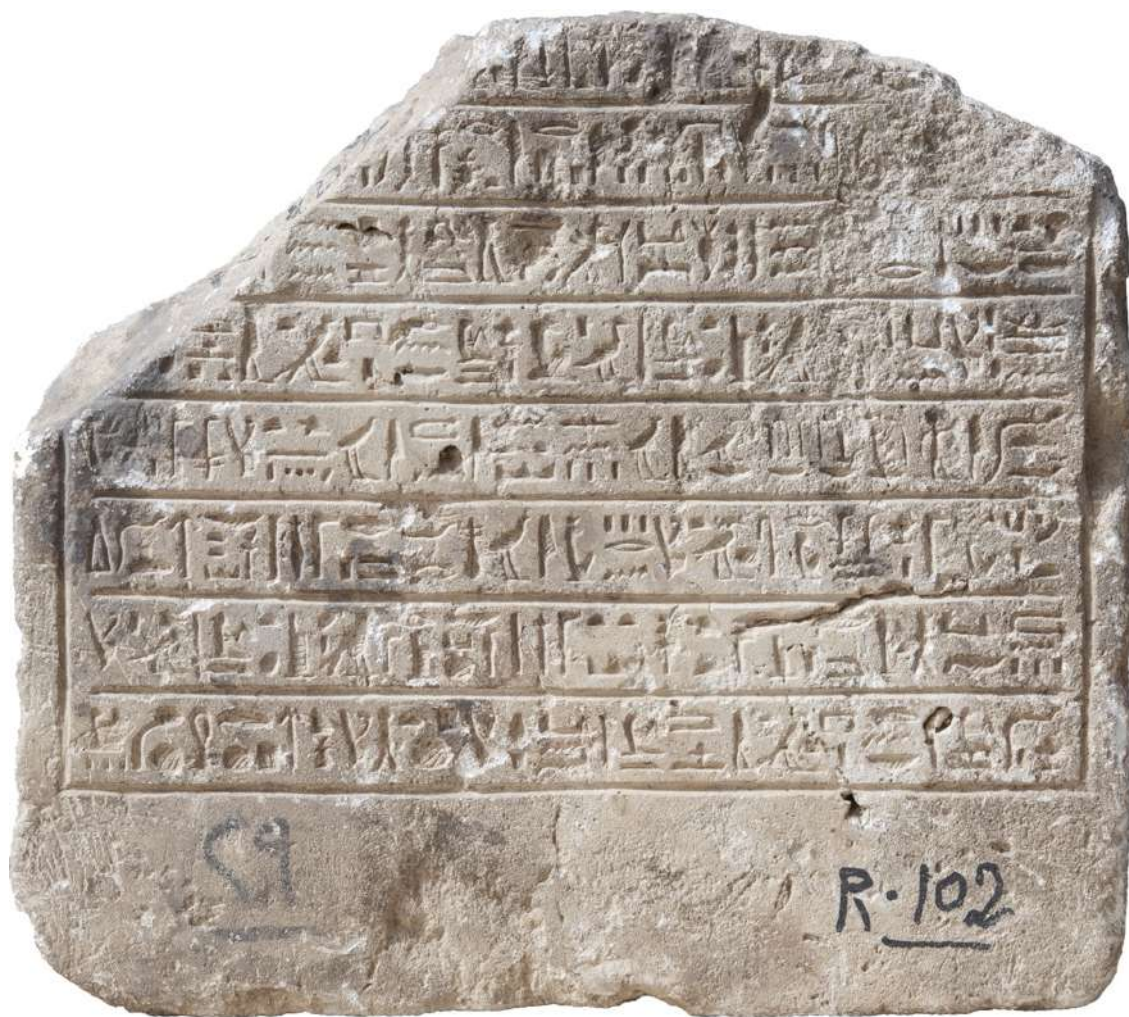
Fig. 1. La stèle de Harsiésis, fils de Téos.

courant à l'époque ptolémaïque 16 . Harsiésis fils de Téos ne semble pas répertorié dans les généalogies akhmîmiques 17 et aucun des protagonistes n'est associé à une prêtrise ou une charge administrative, ce qui semble dénoter la modestie de leur origine. La troisième séquence du texte est un appel aux vivants, prêtres du culte divin et ceux qui officient dans la nécropole pour qu'ils perpétuent le souvenir du défunt auprès d'Osiris et assurent son alimentation (pain de Pé et bière de Dep) dans l'Au-delà. La relative sobriété du texte de cette stèle funéraire contraste avec d'autres exemplaires beaucoup plus développés produits par les ateliers de l'antique Panopolis.