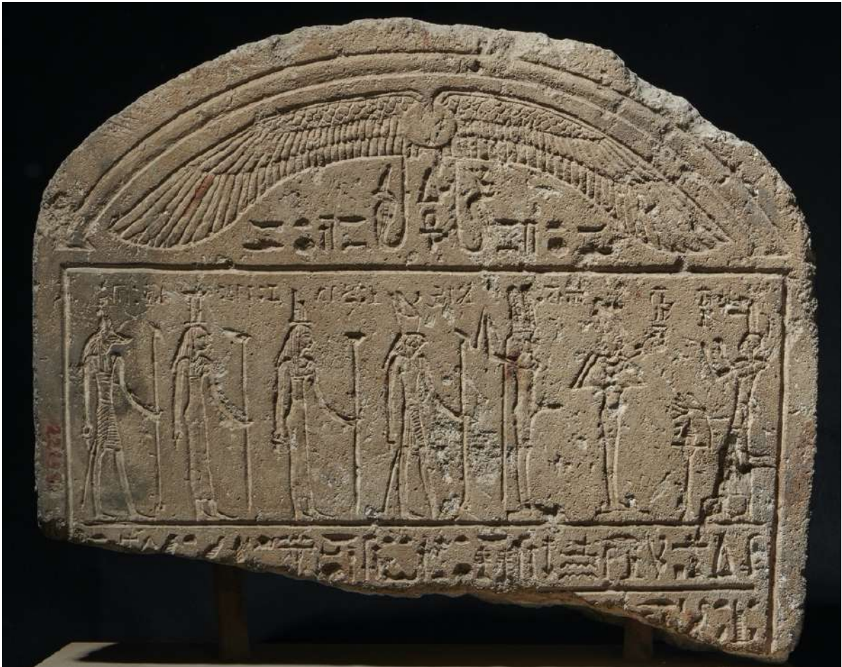
Fig. 2. La stèle CGC 22128 (© Musée égyptien du Caire/A. Amin).

Les données internes du fragment de Gadaya permettent de proposer un rapprochement avec la partie supérieure d'une stèle conservée au Musée égyptien du Caire [fig. 2]. Il s'agit de la stèle CGC 22128, provenant d'Akhmîm (calcaire ; 37 × 44 × 9,5 cm ; gravure en creux) 18 . Elle appartenait à un certain Harsiésis, figuré dans le cintre, sous un disque solaire ailé. Tête surmontée d'un cône d'encens traversé par une fleur de lotus, le défunt debout devant un guéridon chargé d'offrandes se présente bras levés en adoration face à Osiris, Min-Rê, Harendotès, Isis, Nephthys et Anubis. Au-dessous, dans le champ de la stèle, sont préservés les restes des deux premières lignes de texte. Plusieurs signes (panicule de roseau- j et oiseaux notamment) sont traités avec les hachures caractéristiques déjà évoquées et des restes d'ocre rouge témoignent du travail préparatoire de gravure. La scène du cintre et le texte sont encadrés par une ligne en creux. Les données épigraphiques, les caractéristiques techniques, les dimensions et l'orientation de la cassure, tout converge pour faire de ce fragment la partie supérieure manquante de la stèle de Gadaya [fig. 3-4].