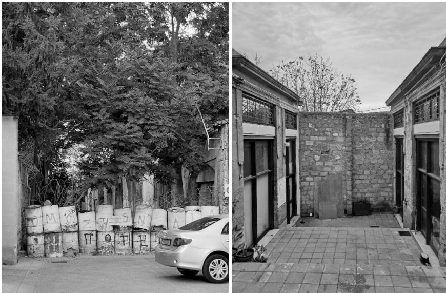
Figures 4 & 5 – Différence de matérialisation de la Ligne Verte au Sud et au Nord de Nicosie.

« dur » la séparation murale, puisque les éléments de division sont facilement modulables et effaçables (les barbelés, les sacs de sable, les barils sont des ostensifs de guerre mais ils marquent le caractère délébile de la fermeture : on peut les déplacer plus aisément, voire les enlever sans que de gros efforts ne soient déployés). On pourrait ajouter qu'on peut y voir « à travers » : il est plus aisé d'apercevoir « l'autre côté » dans les interstices des barbelés ou au-dessus des sacs et des barils. Il nous semble donc qu'il y ait cette possibilité d'ouverture, comme si cette armature n'avait pas vocation à s'ancrer dans le sol.