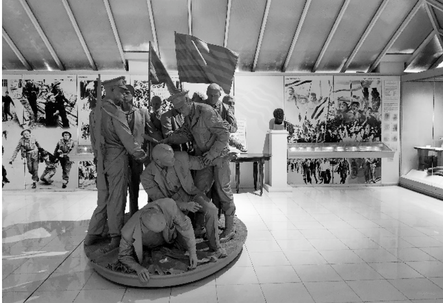
Figure 6 – Une des salles du musée de la Lutte à Nicosie Sud, constituée d'une sculpture grandeur nature, de photographies et d'objets appartenant aux soldats indépendantistes Marie Pouillès Garonzi 2018

britannique et du vandalisme turc pour bien établir le parallèle entre les deux opposants au combat indépendantiste. Papadakis explique également que les Turcs sont représentés comme des collaborateurs [p.405,406]. Ce musée semble identifier et surtout inscrire dans les murs les ennemis battus lors de la guerre d'indépendance tout en illustrant en filigrane les adversaires actuels. Les héros-martyrs sont mis en exergue dans cet établissement ressemblant plus à un patchwork de photographies d'époque qu'à un musée à visée historique avec un fondement scientifique et nuancé.