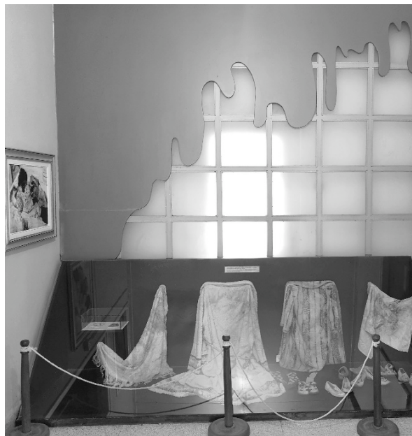
Figure 7 – Exposition des biens des défunts dans le décor sanguinolant du musée de la Barbarie à Nicosie Nord.

Le musée de la Barbarie quant à lui se trouve dans le centre-ville de Nicosie Nord, à l'intérieur d'une maison et relate l'assassinat d'une famille chypriote turque par la milice chypriote grecque EOKA 11 pendant les événements violents de décembre 1963. Le visiteur retrouve également de nombreuses photographies dans des salles dédiées aux hommes mutilés, aux réfugiés, aux destructions de quartiers et de villages, comme dans le musée de la Lutte dans le Sud, et encore une fois très peu de texte à part des coupures de presse et des encarts victimistes (figure 7).