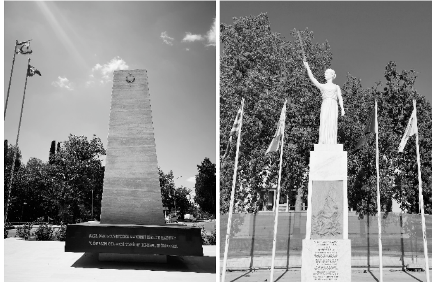
Figures 2 & 3 – Exemples de monuments disposés sur un rond-point de Nicosie Nord et aux abords d’une grande voie de circulation à Larnaca Marie Pouillès Garonzi 2018