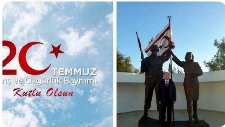
Capture d'écran d'un tweet posté le 20 juillet 2019 célébrant l'intervention turque de 1974 appelée « opération de paix » par les turcophones

Kıbrıs Barış Harekatının 45'inci yıl dönümünde; aziz şehitlerimizi rahmet ve minnetle, gazilerimizi şükranla yâd ediyorum. #kktc #kıbrısbarışharekatı #kıbrıs #cyprus