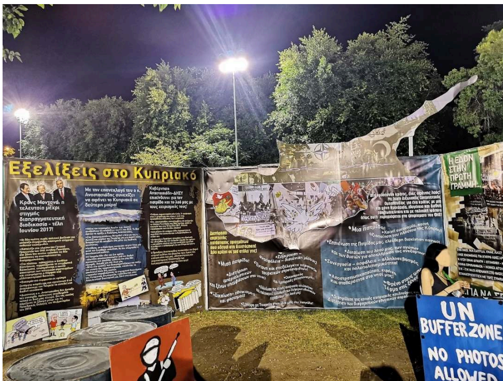
Fresques du festival de la jeunesse communiste à Nicosie Sud Marie Pouillès Garonzi, 2018