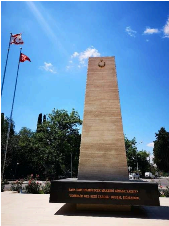
Mémorial des martyrs sur un rond-point près du lycée turc de Nicosie Nord Marie Pouillès Garonzi, 2018