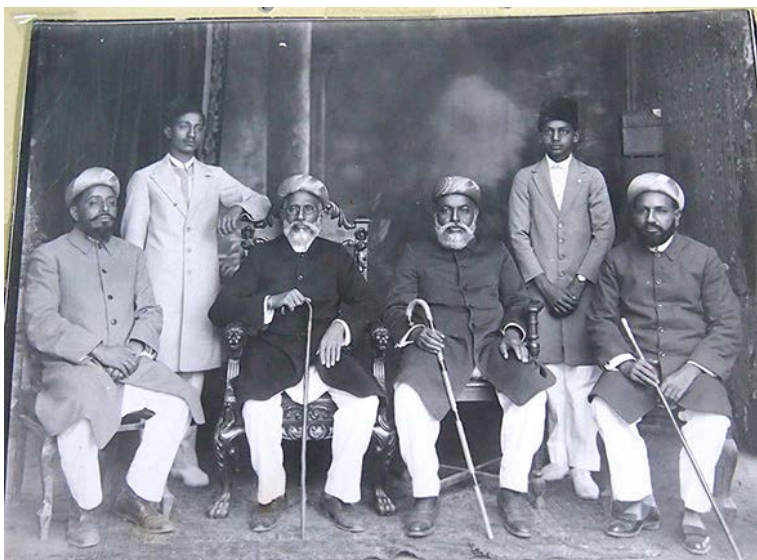
Collection particulière, avec l'autorisation et crédit de M. Hussein.