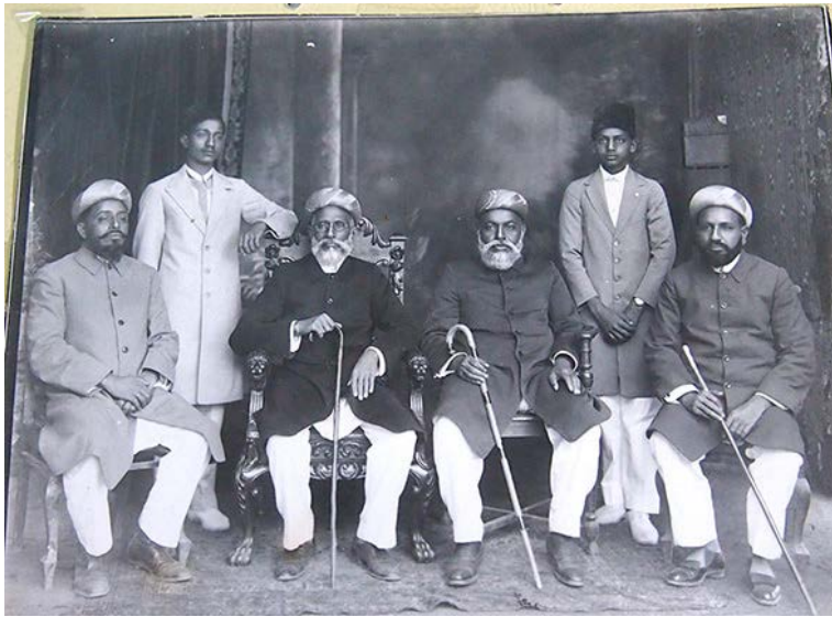
Collection particulière, avec l'autorisation et crédit de M. Hussein.