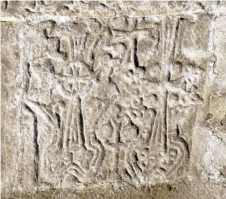
15a. Tambour, face sud (la plaque étant renversée, la photo est remise dans la bonne position)