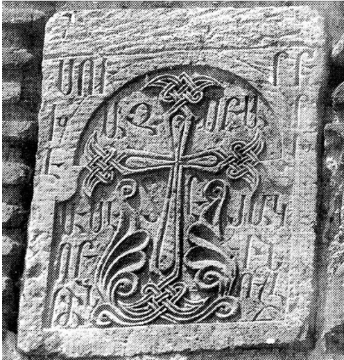
16a. Monastère de T'elet'i au sud de Tbilissi. Petit khatchkar mural de 1681. État de la plaque en 1992.