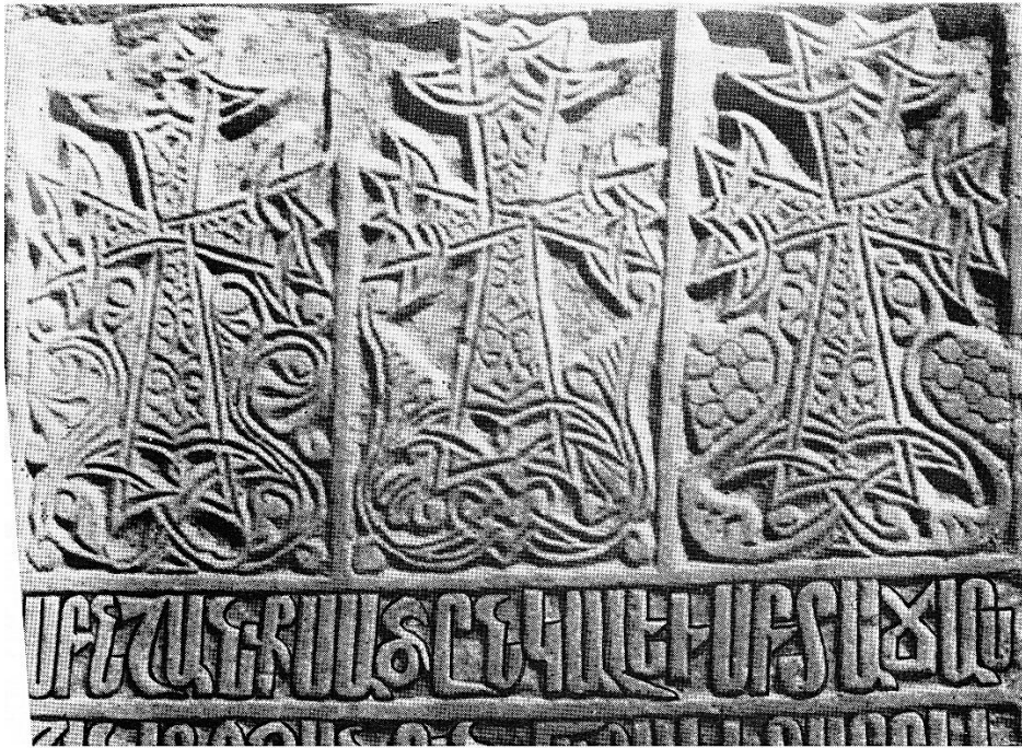
Fig. 3 (cf. p. 460-462, 470). Crimée, Caffa