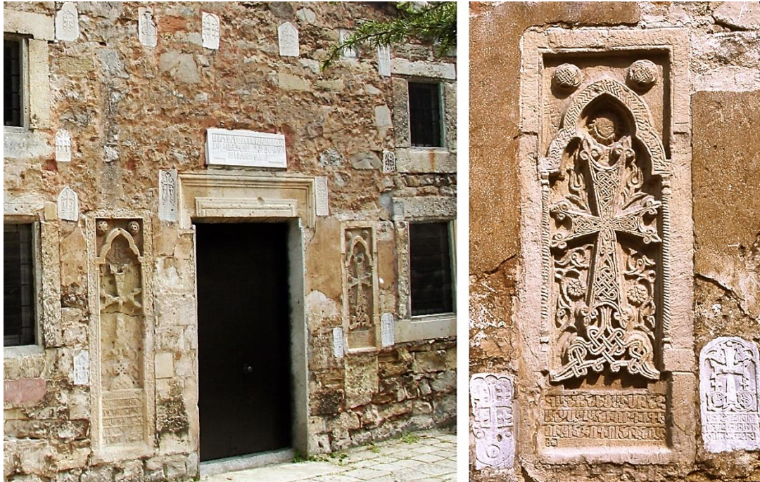
1a. Centre de la façade.