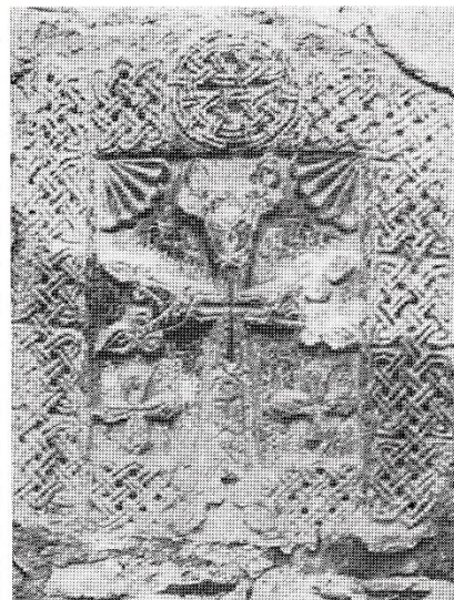
14b. Axalgori, église Sainte-Mère de Dieu. Plaque à croix de 1462. D'après Muradjan 1985, pl. X, n° 1