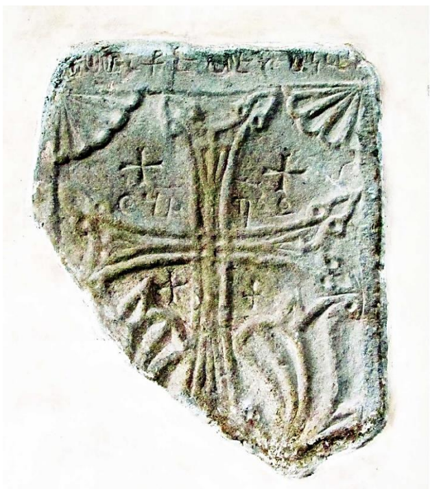
14c. Tbilissi, église Saint-Georges, intérieur, face ouest du mur à gauche de l'abside. Plaque à croix de 1417 (?) (50 x 40,5 cm).