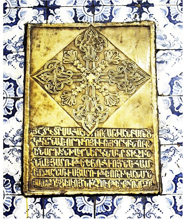
12b. Plaque à croix de 1733 (45,3 x 35 cm).