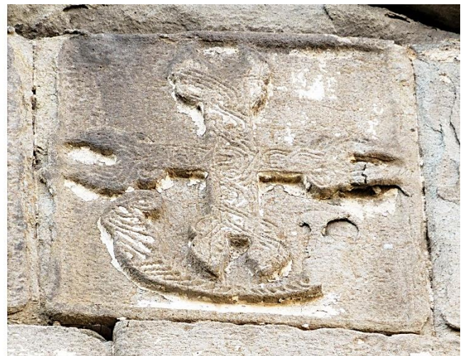
15d. Pignon en haut de la façade est