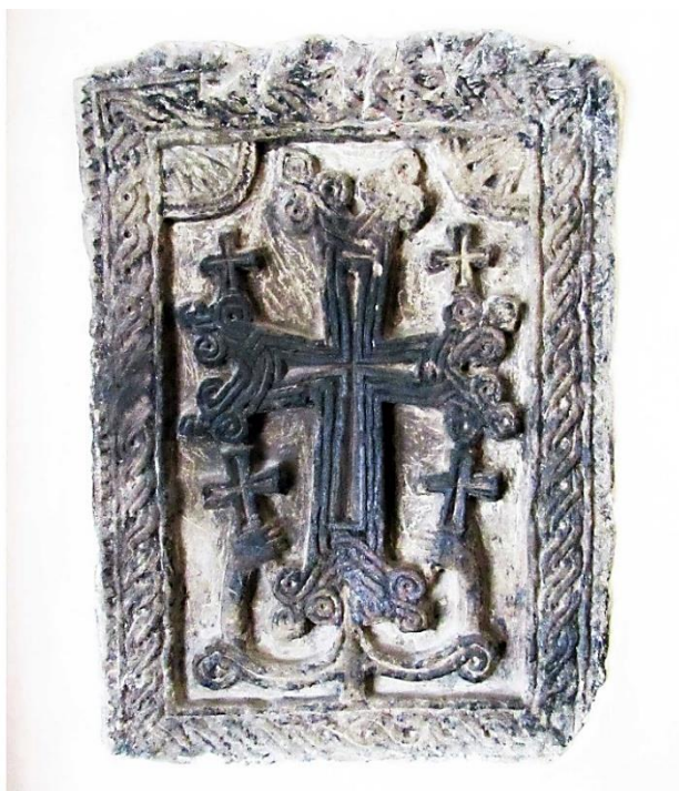
14d. Tbilissi, Saint-Georges, intérieur, mur gauche de l'entrée nord. Plaque non datée (56,5 x 41 cm).