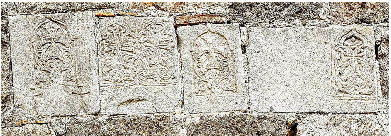
13c (cf. p. 477). Façade sud de l'église, rang de quatre plaques