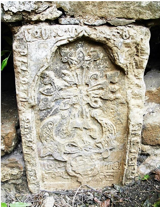
Fig. 5 (cf. p. 463). Crimée, villages de Topty/Topolevka et Sala/Gruševka