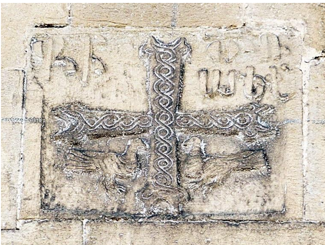
15c. Pignon en haut de la façade nord ; datation probable : 1746