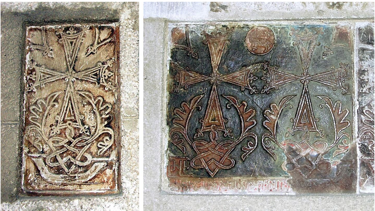
9a. Une des deux plaques non datées, quasi identiques ; celle-ci : 23 x 13 cm