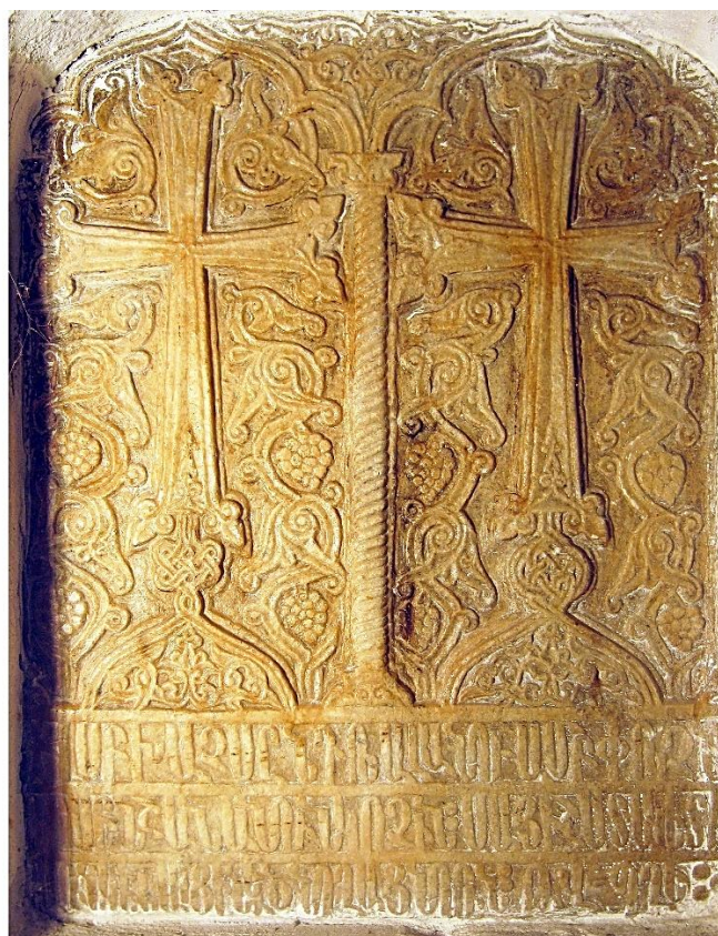
10b. Bessarabie, Akkerman/ Bilhorod, église Saint-Auxence, sacristie sud-est. Plaque à deux croix de 1446 (59 x 47 cm).