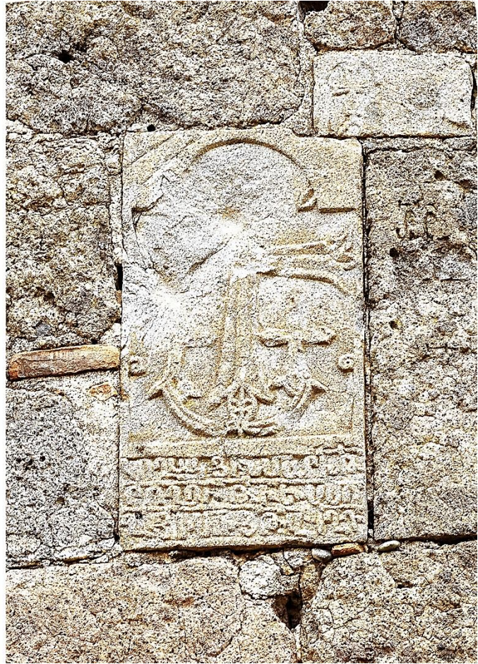
13b (cf. p. 477). Façade sud de l'église, partie ouest. Plaque à croix de 1445