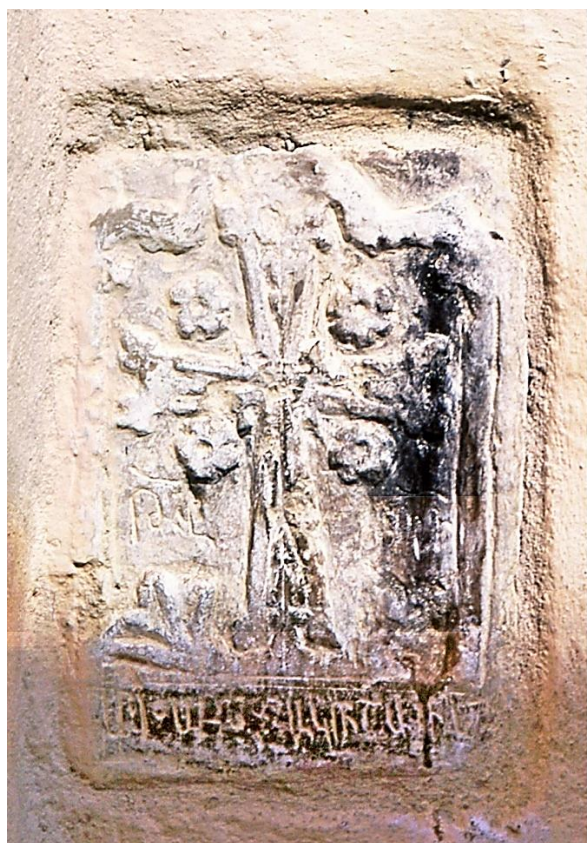
10a. Podolie, Kamianiec Podolski, chapelle de l'Annonciation. Plaque à croix de 1554 (27 x 19 cm).