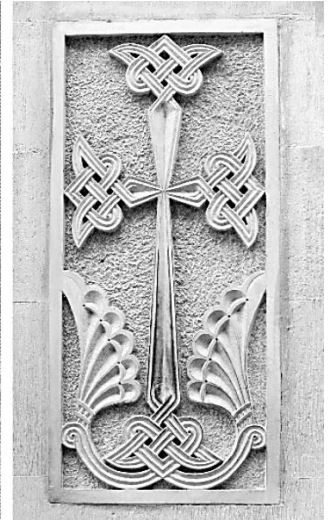
16c. Tbilissi, 10 rue Mixeil Asat'iani (quartier de Saburt'alo). Réinterprétation de l'image sur une église orthodoxe géorgienne nouvellement construite. Photo auteur (2017)