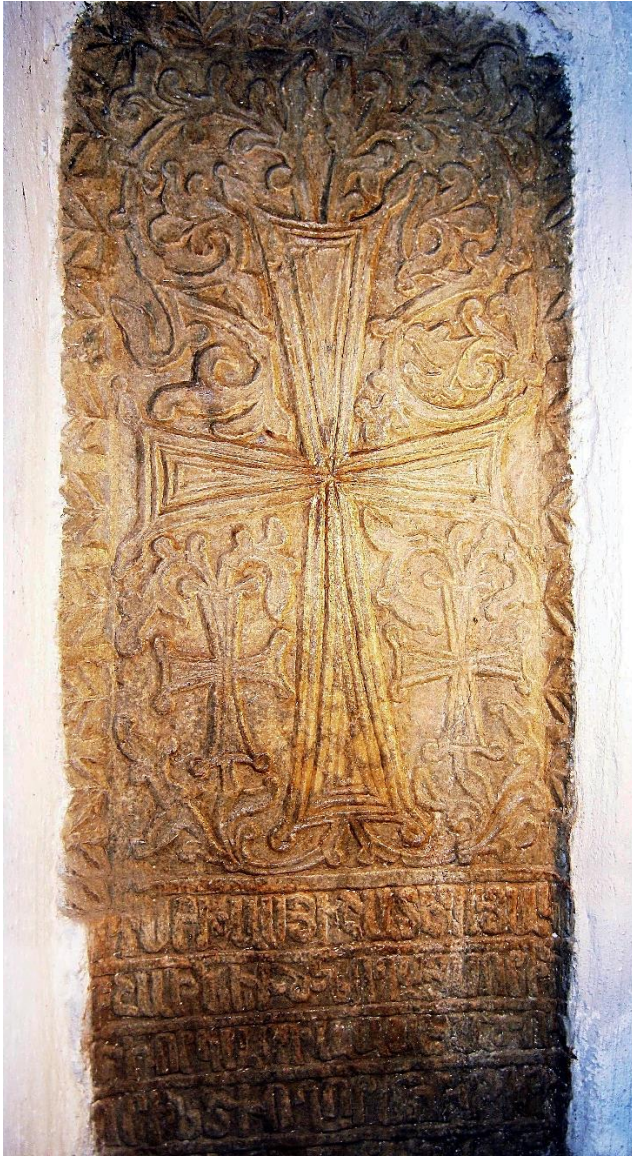
11a. Akkerman/Bilhorod, égl. Saint-Auxence. Plaque non datée (97,5 x 41,5 cm).