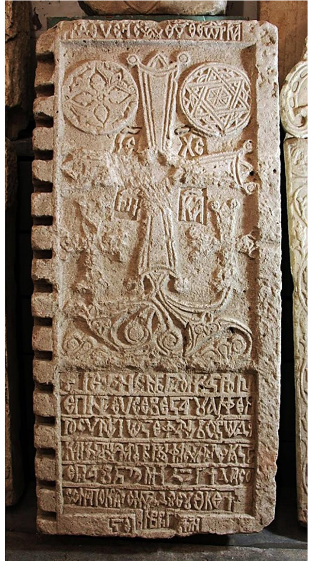
11b. Stèle à croix à inscription grecque de 1440 (115 x 51,5 x 18 cm) provenant de la citadelle d'Akkerman/Bilhorod, conservée au musée régional de Chersonèse, Sébastopol, Crimée.