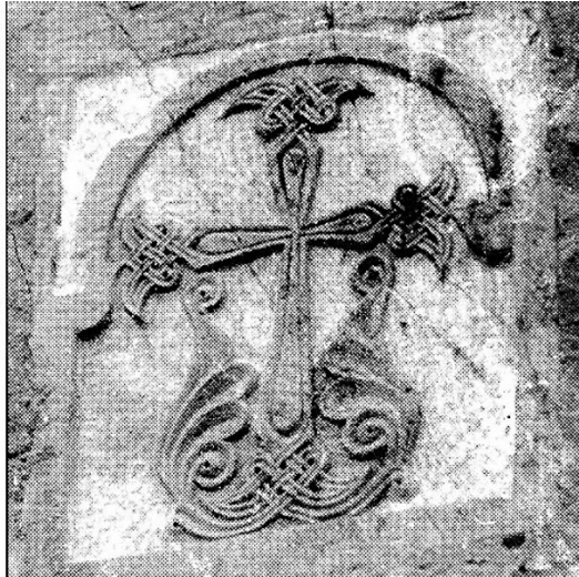
16b. T'elet'i, état de la plaque en 1997.