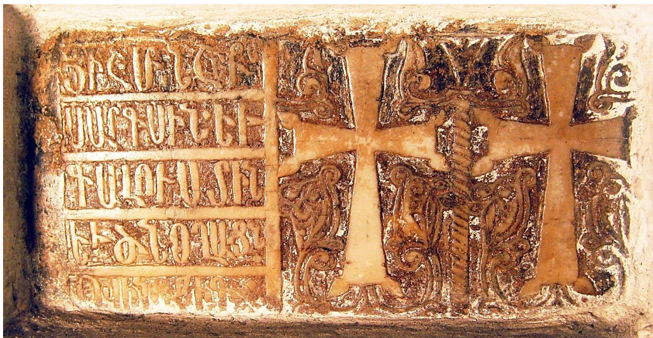
10c. Akkerman, Saint-Auxence. Plaque à deux croix de 1474, avec inscription sur le côté gauche (29,5 x 16 cm).