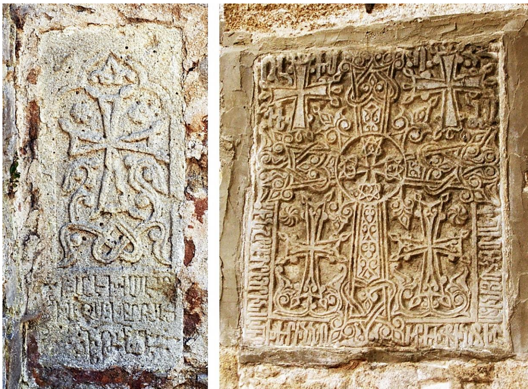
2a (cf. p. 459). Façade nord du narthex. Khatchkar de 1356 (76 x 34 cm).