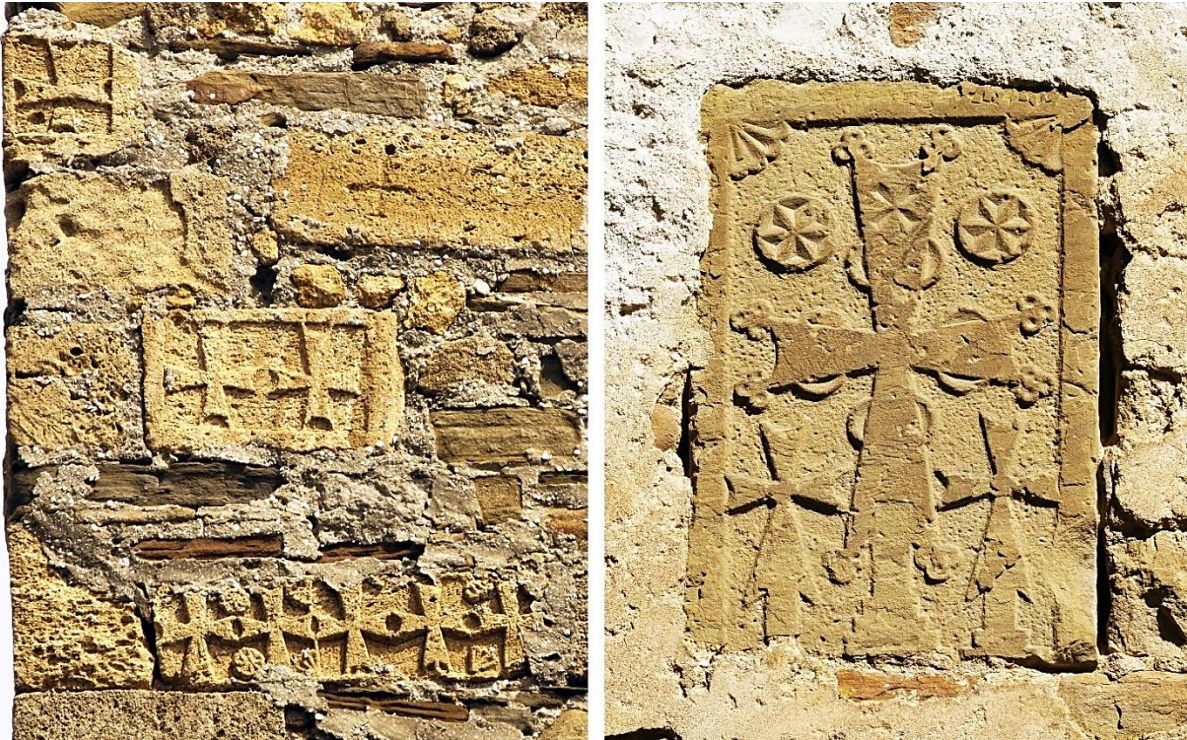
6a. Tour du consul F. Astaguera (1386), face sud. 6b. Tour de F. di Pagano. Plaque à restes d'inscription