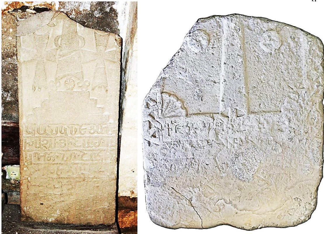
Fig. 7 (cf. p. 465). Crimée, Soldaïa/Sudak.