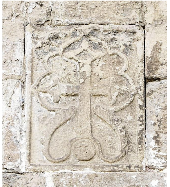
15b. Façade nord, partie est