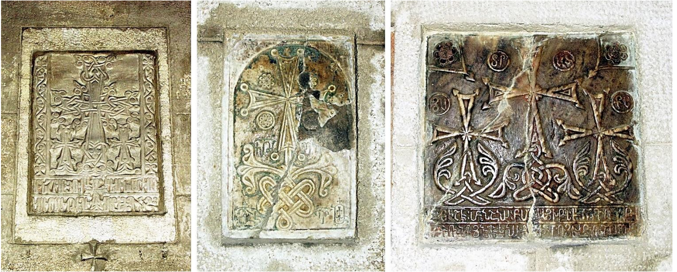
8a. Plaque de 1427 (45 x 32 cm). 8b. Plaque de 1441/-49 (20 x 13 cm). 8c. Plaque de 1461 (23 x 23 cm)