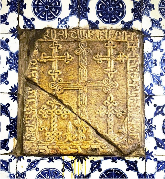
12a. Plaque à croix de 1435 ou 1439 (42,5 cm de côté).