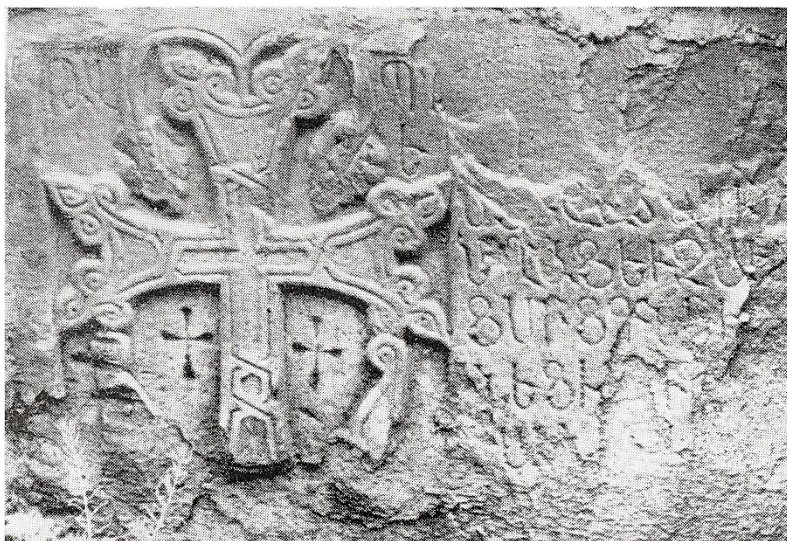
14a. Dirbi, plaque à croix de 1456. D'après Muradjan 1985, pl. IX, n° 2