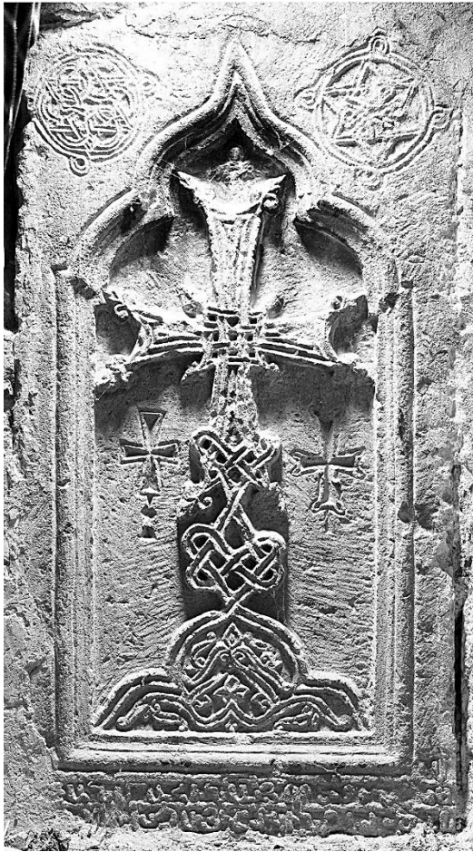
13a (cf. p. 473, 477-478). Intérieur de l'église, plaque dans une niche du mur sud