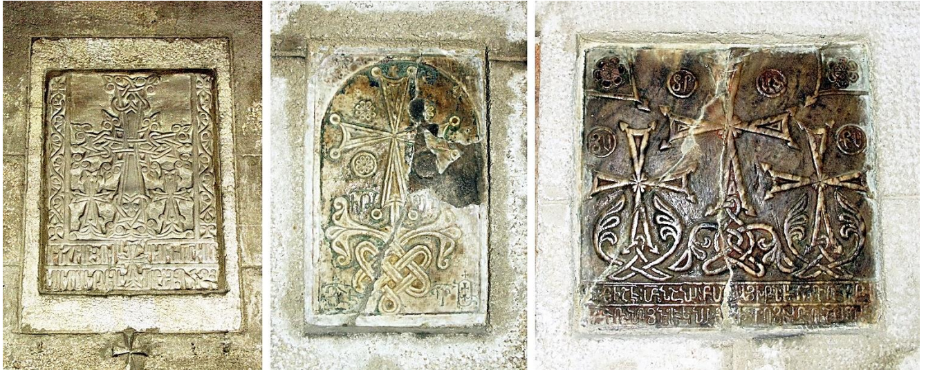
8a. Plaque de 1427 (45 x 32 cm). 8b. Plaque de 1441/-49 (20 x 13 cm). 8c. Plaque de 1461 (23 x 23 cm)