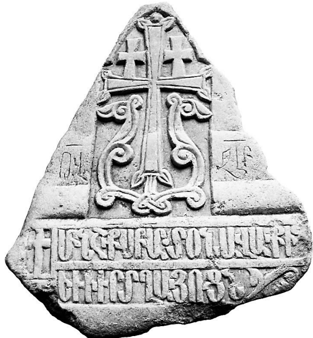
5a. Topty/Topolevka, chapelle de Vendredi/Sainte-Parascève, plaque d'Aramayis (1381).