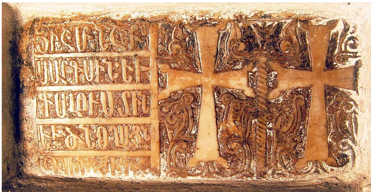
10c. Akkerman, Saint-Auxence. Plaque à deux croix de 1474, avec inscription sur le côté gauche (29,5 x 16 cm).