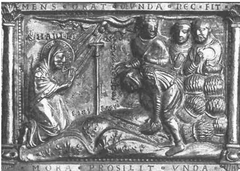
Fig. 2 : Châsse de saint Hadelin, saint Hadelin fait jaillir une source (bois verni recouvert d'argent repoussé et de bronze fondu). Visé, église Saint-Martin.

On peut y joindre, parmi d'autres œuvres de moindre ampleur, les châsses de saint Mengold et de saint Domitien à Huy, le chef-reliquaire du pape Alexandre 1 er à Stavelot (aujourd'hui aux Musées royaux d'Art et d'Histoire de Bruxelles) ou la châsse de saint Éleuthère à Tournai. Notre-Dame-aux-Fonts était la paroisse primitive de Liège et avait le privilège d'administrer le baptême pour toute la ville. Celui-ci