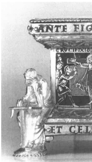
Fig. 3 : Autel portatif de Stavelot, côté entre saint Marc et saint Luc. Bruxelles, Musées royaux d'Art et d'Histoire.

était contesté par les collégiales Saint-Jean-l'Évangéliste et Saint-Pierre. Entre 1107 et 1118, l'abbé de Notre-Dame-aux-Fonts, Hillin, dit « réaliser » les superbes fonts baptismaux aujourd'hui conservés en l'église Saint-Barthélemy. Une étude épigraphique séduisante interprète les douze bœufs qui les soutenaient non comme les apôtres – représentés sur le couvercle - mais comme les abbés-chanoines de Notre- Dame-aux-Fonts menant « la vie apostolique », responsables du baptême pour toute la ville. Sur la cuve, Pierre et Jean administrent le baptême au centurion Corneille et au philosophe Craton, scènes exceptionnelles sur des fonts baptismaux. L'inscription du bord supérieur de la cuve dit : « C'est ici [Notre-Dame-aux-Fonts], fontaine de la foi, que Pierre et Jean [les collégiales Saint-Pierre et Saint-Jean] lavent ceux-ci [Corneille et Craton] ». Ces fonts baptismaux participent ainsi de la défense d'un privilège 12 .