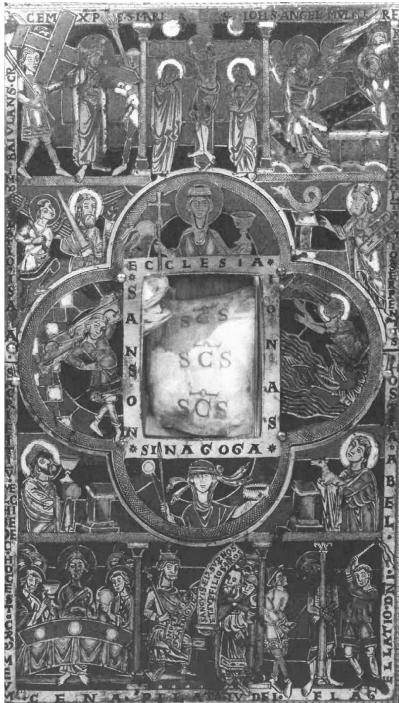
Fig. 4 : Autel portatif de Stavelot, plat supérieur. Bruxelles, Musées royaux d'Art et d'Histoire

Le XII e siècle développe une iconographie typologique basée sur les commentaires d'une exégèse quelque peu exubérante. L'autel portatif de Stavelot (Bruxelles, Musées royaux d'Art et d'Histoire) en est un bon exemple (fig. 3 et 4). La grande inscription déclare que « la croix, mort et victoire du Christ, a été figurée et présignée par les patriarches et les prophètes ». Sur le dessus de l'autel, cène, jugement de Pilate, flagellation, portement de croix, crucifixion, résurrection sont mis en rapport avec le sacrifice d'Isaac, le serpent d'airain, Samson et les portes de Gaza, Jonas rejeté par le poisson, l'offrande de Melchisédech,