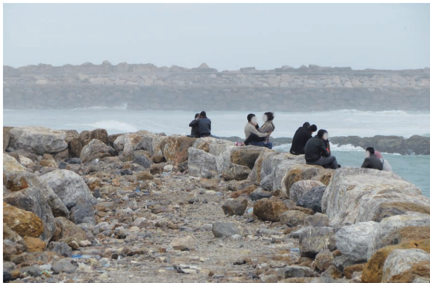
Photographie 2 – La spatialisation de la séduction et du flirt sur le littoral de Rabat

Les couples observés et photographiés témoignent, dans chaque cas, de coopérations ayant pour finalité de « sauver la face » (Goffman, 1973) lors des interactions intimistes. Ces couples se comportent en effet tels des « équipes » dans l'espace public selon la terminologie d'Erving Goffman. Contrôle minutieux des gestes (en particulier les plus ostentatoires), coopération dans des espaces spécifiques en bord de mer, contrôle de la représentation de soi à travers le couple, contrôle des distances corporelles (entre les deux membres du couple et entre le couple et les individus coprésents) et enfin contrôle des distances des regards d'autrui. Ces équipes, solidaires dans le maintien des bonnes conduites, s'accordent donc sur des comportements routiniers structurés par l'intériorisation des normes sociales en vigueur au Maroc dans l'espace public. Complices dans le couple et entre les couples dans un même lieu, les membres de ces équipes peuvent flirter dans des « bulles géographiques », à distance du contrôle des autorités, où le collectif finalement l'emporte sur l'individu. C'est, en effet, grâce à des pratiques collectives et complices que les couples sont protégés, à l'instar des analyses d'Amélie Le Renard sur le terrain saoudien pour qui des transgressions assumées par les jeunes femmes contribuent en retour à « normaliser » les normes sociales (Le Renard, 2011).