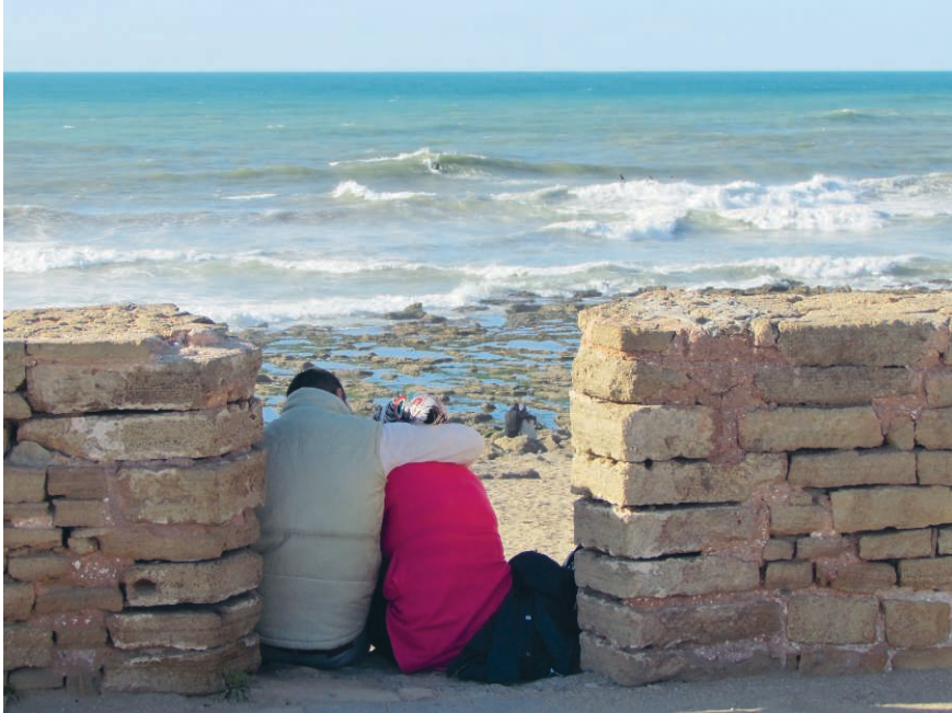
Photographie 1 – La spatialisation de la séduction et du flirt sur le littoral de Rabat (Cliché : Christophe Guibert, avril 2016)

créneaux de la vieille muraille face à la mer, qui sont ici utilisés pour s'asseoir et s'enlacer, à l'abri des regards.