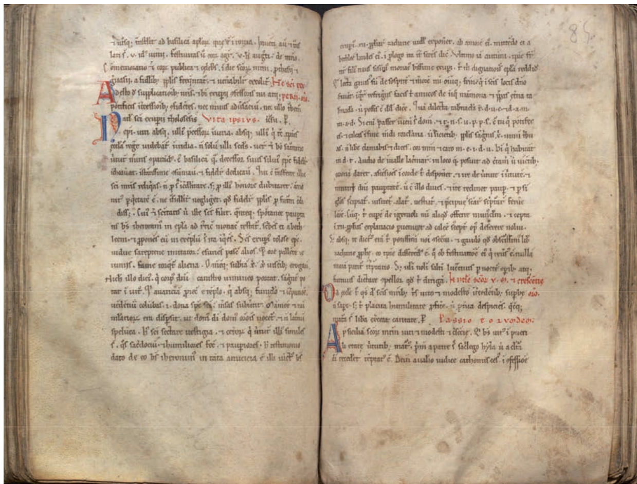
FIG. 2. EL ESCORIAL, H.III.11, fol. 84v-85.

1. Incipit uita beatissimi Exuperii confessoris atque tholosani episcopi, sub attestatione Iheronimi edita, cuius transitus celebratur XVIII o KL. Iulii. Translatio uero eiusdem IIII o KL octobris 1 .