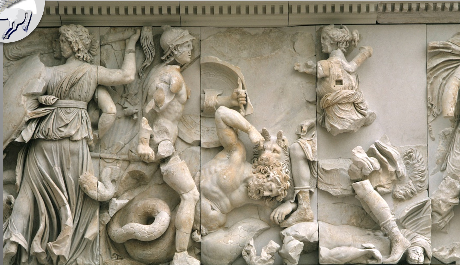
Partie sud de la frise est du Grand autel de Pergame, vers 175 av. n.è. Antikensammlung, Staatliche Museen zu Berlin, inv. AvP III.2 GF 10, 2 - 10, 5