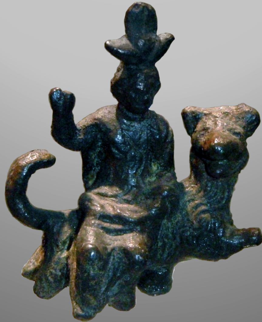
Isis chevauchant le chien Sirius, II e s. Musée du Vatican (Collection Grassi) inv. 15623, bronze, ± 10cm