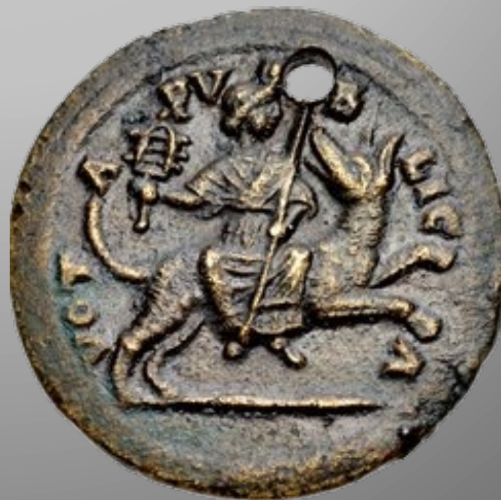
Revers d'une médaille de Valentinien (émission en 369) Coll. particulière, bronze, 24mm