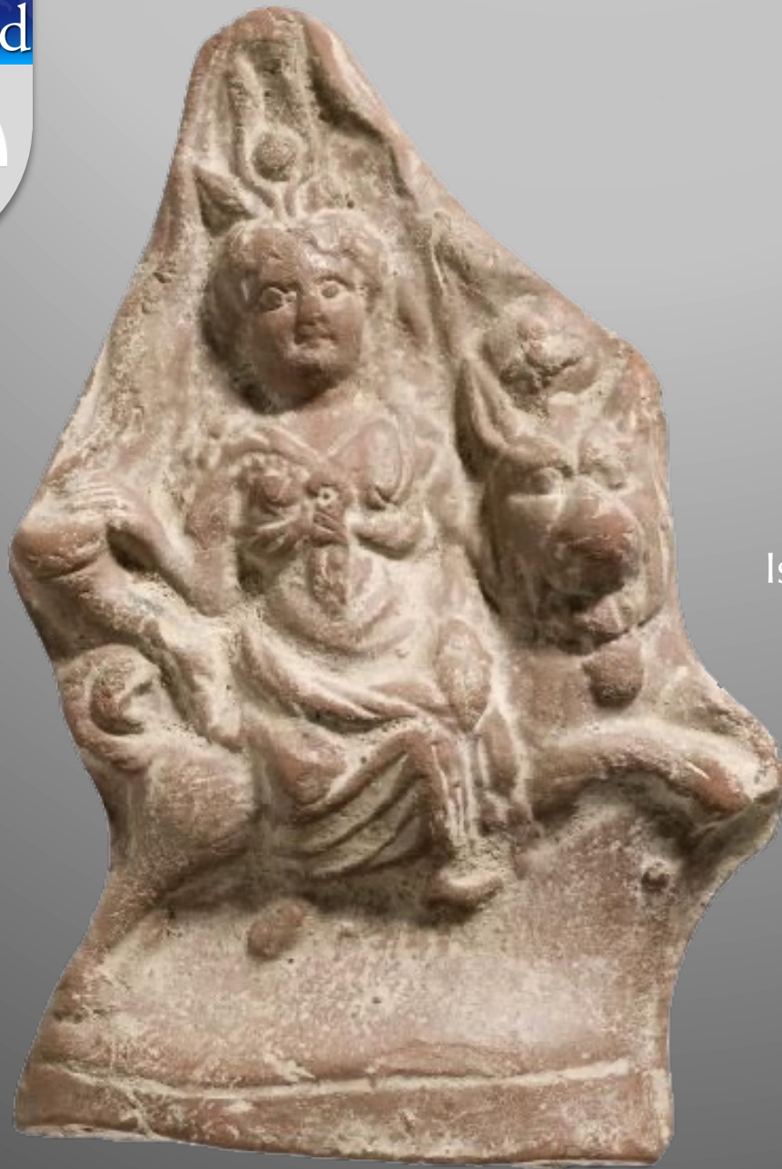
Isis chevauchant le chien Sirius Musée du Caire inv. CG 26924, terre cuite, époque romaine, ± 14cm