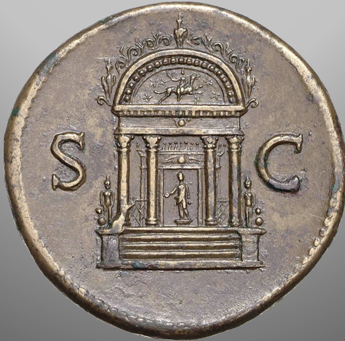
Revers d'un sesterce de Vespasien (émission en 71) Münzkabinett, Staatliche Museen zu Berlin inv. 18204484, bronze, 35mm