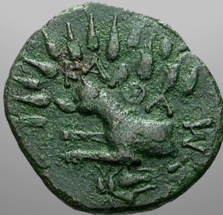
Protomé radié du chien Sirius sur le revers d'une monnaie de Karthaia, île de Céos III e s. av. n.-è.