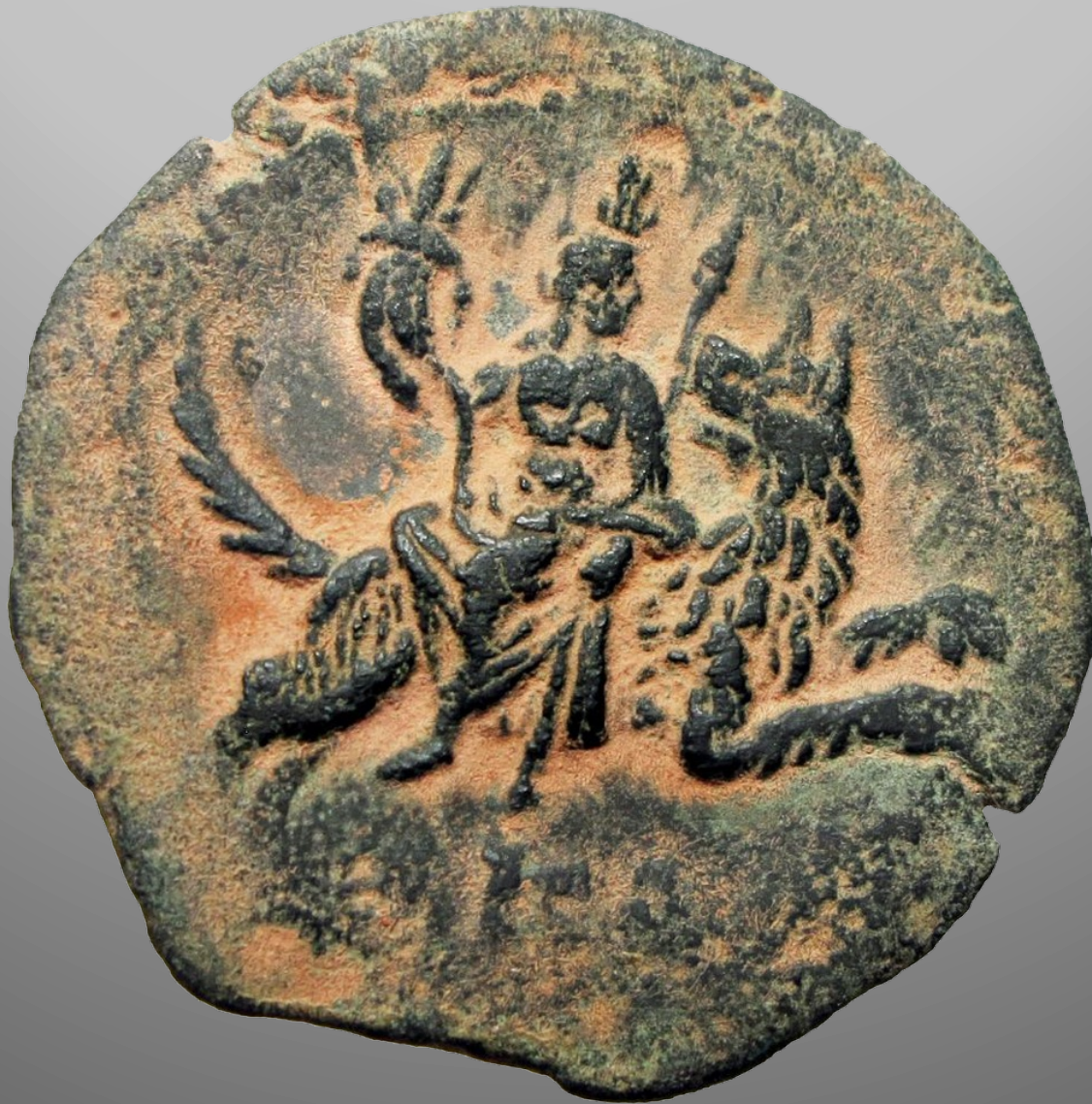
Revers d'une drachme d'Antonin le Pieux (émission en 157-158) Coll. particulière, bronze