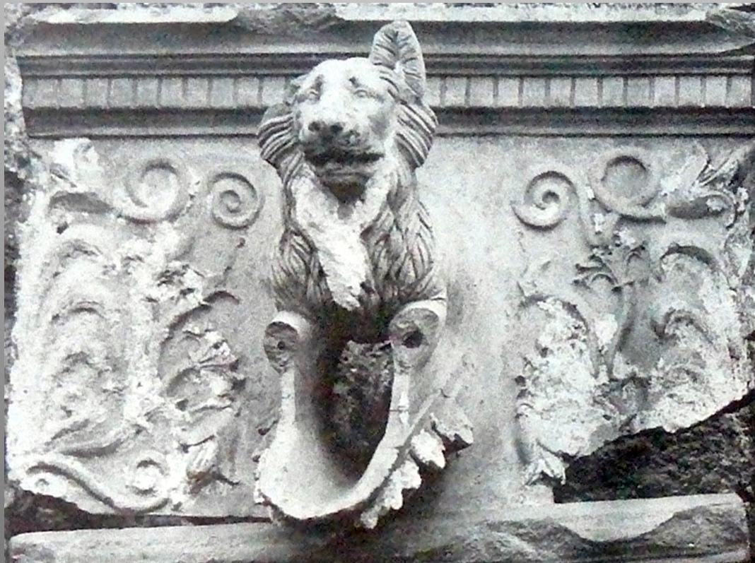
Plaque architectonique en terre cuite avec chien-gargouille de Pompéi, I e s. d'après P. Pensabene, Terrecotte del Museo nazionale romano I. Gocciolatoi e protomi da sime , Rome, 1999, p. 55, fig. 29