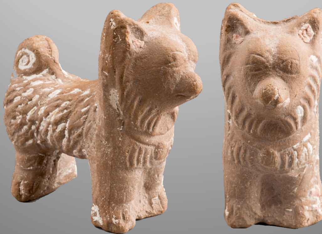
Chien maltais découvert à Karanis – Fayoum, Égypte Kelsey Museum inv. KM 6909, époque romaine, 7,4cm