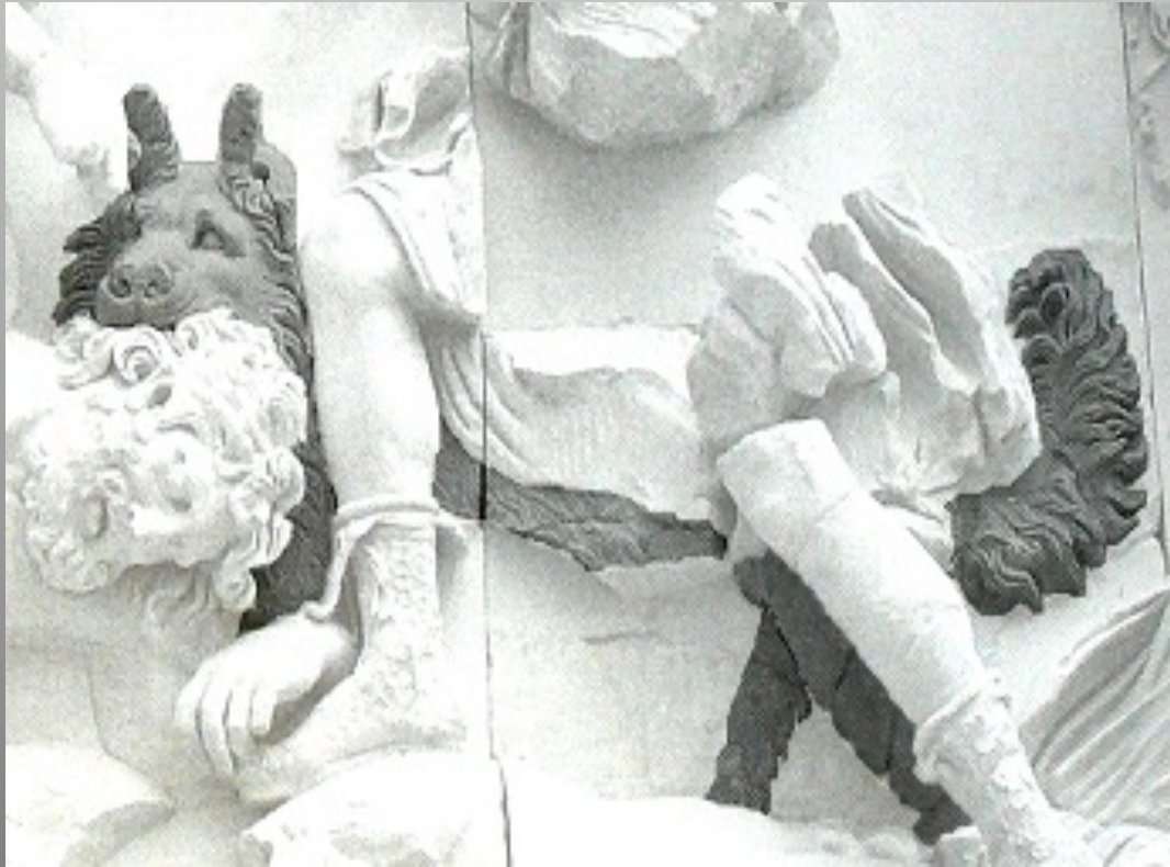
Le Μέγας Κύων ou Grand Chien Sirius assistant Artémis pendant la gigantomachie