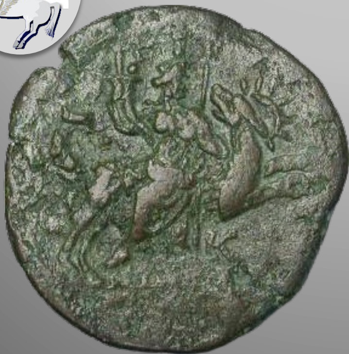
Revers d'une drachme d'Antonin le Pieux (émission en 159) Coll. particulière, bronze, 25mm