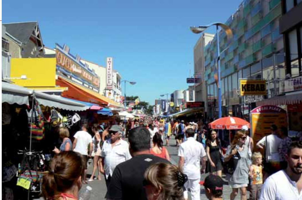
L'avenue de la Mer au mois d'août.