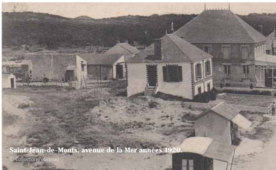
Saint-Jean-de-Monts, avenue de la Mer années 1920.

Johan Vincent Chercheur associé au CERHIO Tw. : @moijv