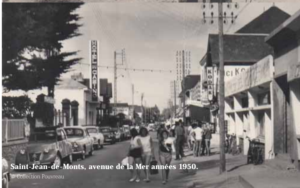
Saint-Jean-de-Monts, avenue de la Mer années 1950.