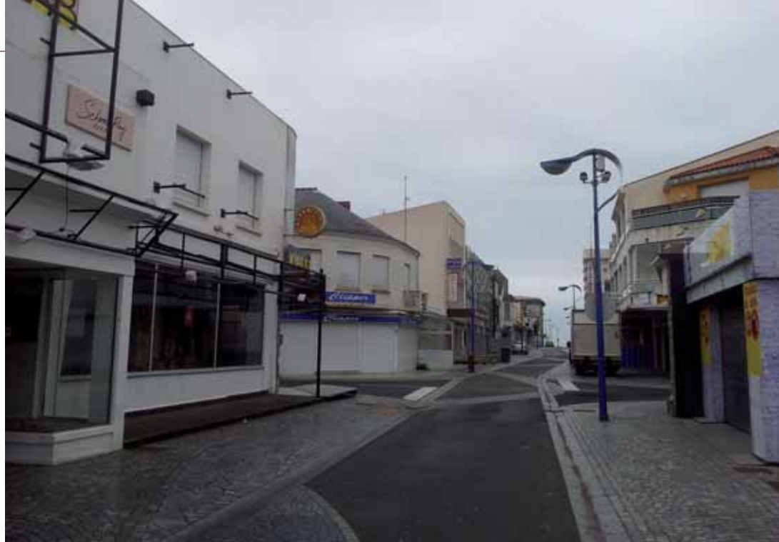
L'avenue de la Mer au mois de janvier.

La municipalité, intéressée par son développement touristique, voit la station balnéaire comme une excroissance. Seule véritable réglementation, les constructions doivent respecter l'alignement qui a été imposé au début des années 1930. C'est la seule obligation sur laquelle la Ville ne transige pas. Pour le reste, tout est fait pour accueillir toujours plus de touristes. Cette mutation des espaces résidentiels