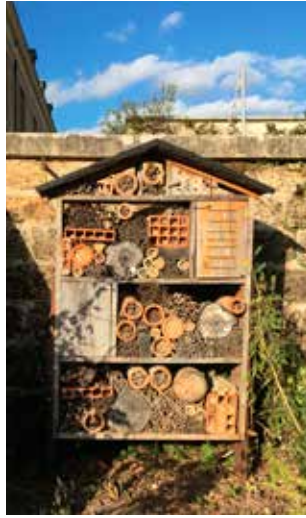
Versailles, Potager du roi, hôtel à insectes.