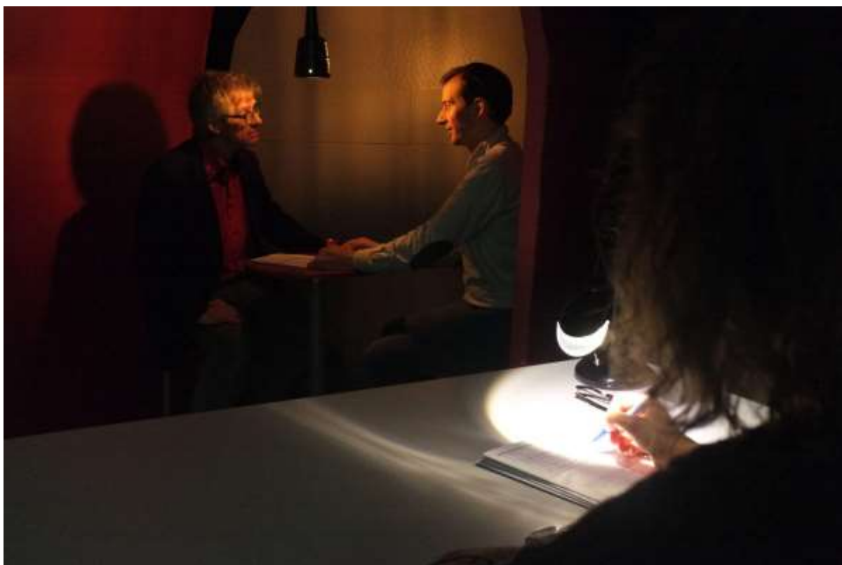
Image 1 – Une enquêtrice en observation lors du spectacle interactif Sain et sauf ? .