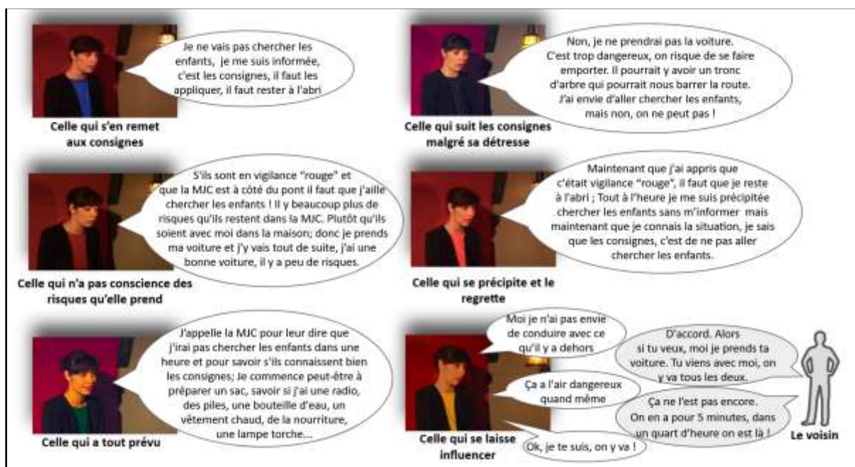
Image 3 – Les six personnages et leurs réponses au stimulus « prendre la voiture » du scénario inondation.