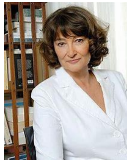
Lionel Jospin, 1 er Ministre de la France 1997-2002 Sylviane Agacinski, Philosophe

Invité par René Girard, Derrida participe en 1966 à l'université Johns Hopkins de Baltimore à un colloque resté fameux pour avoir lancé la French Theory aux États-Unis, où elle allait trouver un développement considérable. La vie de Derrida bascule et devient publique à partir de 1967-1968, et la publication de plusieurs ouvrages importants ( L'Écriture et la Différence , De la Grammatologie ) et de sa conférence sur « La Différance ». C'est certainement le philosophe le plus célèbre dans le monde à la fin du XX ème siècle. Pourtant, lors de sa mort le 9 octobre 2004 d'un cancer au pancréas diagnostiqué un an auparavant, la France ne lui rend pas vraiment l'hommage national auquel on aurait pu s'attendre. La nouvelle ne passe pas à proprement parler inaperçue, mais elle ne prend pas de véritable résonance populaire, ni même médiatique, sans doute parce que Derrida, sur aucun point, n'a jamais adopté les positions tranchées qui rendent visibles ceux qui les défendent.