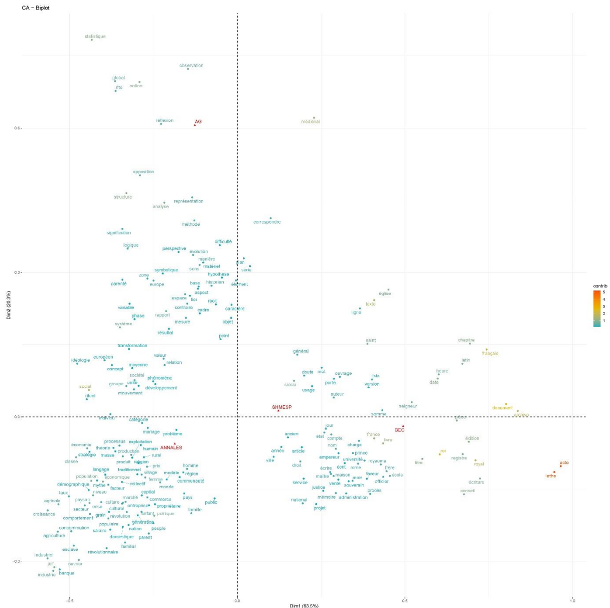
Fig. 1 : Analyse factoriel (AFC) du lexique (500 lemmes principaux) dans les Annales (ANNALES), les volumes des congrès de la SHMESP, la Bibliothèque de l'École des chartes (BEC) et le corpus des textes d'Alain Guerreau (AG). Plan factoriel 1-2. L'échelle colorée (Contrib) correspond à la « contribution » de chaque terme à l'ordonnancement de l'AFC 16 .

Ainsi, en préambule de cette étude, il semblait intéressant de mesurer globalement le lexique de l'auteur, afin de voir comment celui-ci s'insérait dans les grandes tendances historiographiques des cinquante dernières années. Or, l'extraction du vocabulaire des corpus précités, puis la modélisation de la matrice lexicale obtenue par analyse factorielle, permettent d'observer immédiatement la singularité de la position d'Alain Guerreau dans cet ensemble :