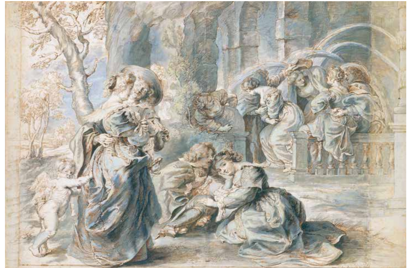
Pierre Paul Rubens, Le Jardin d'amour , 1633-1635, plume, encre brune et couleurs, New York, The Metropolitan Museum of Art.

conduites d'eau, afin de pouvoir fuir au sec ; les autres le suivant, une fois revenus au calme, pourraient être encore plus baignés et rafraîchis 9 ."