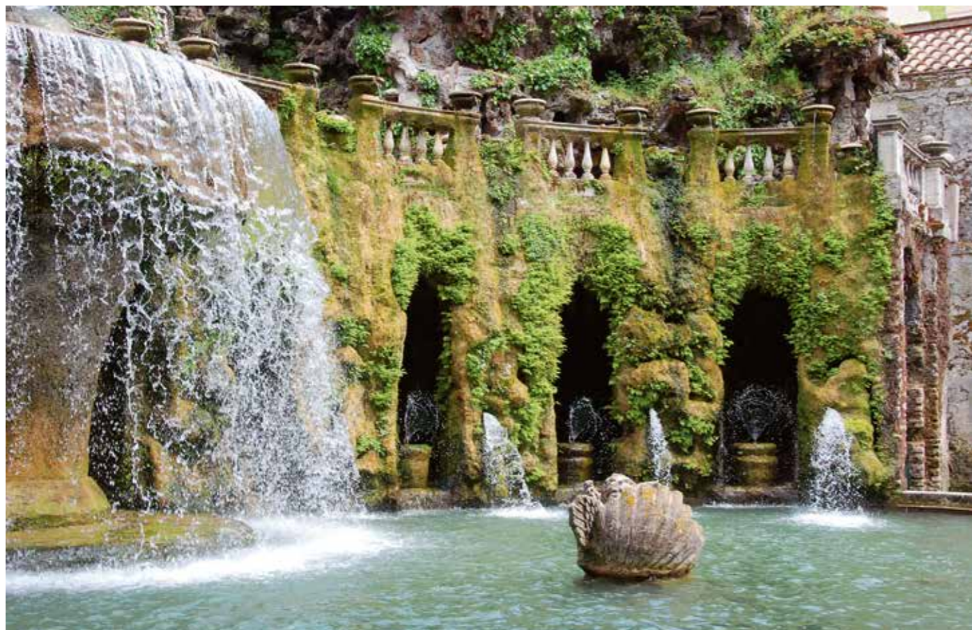
Tivoli, villa d'Este, fontaine de la Sibylle (détail).

de mouvements plaisants tirés de l'eau, ils sont pareils, si le Florentin n'a quelque peu plus de mignardise en la disposition et ordre de tout le corps du lieu ; Ferrare en statues antiques, et en palais, Florence ; en assiette du lieu, beauté du prospect, surpasse infiniment Ferrare et dirais en toute faveur de nature, s'il n'avait ce malheur extrême que toutes les eaux, sauf la fontaine qui est au petit jardin tout en haut et qui se voit en l'une des salles du palais, ce n'est qu'eau du Teverone duquel il a dérobé une branche, et lui a donné un canal à part pour son service. Si c'était eau claire et bonne à boire, comme elle est au contraire trouble et laide, ce lieu serait incomparable, et notamment sa grande fontaine qui est la plus belle manufacture et plus belle à voir avec ses dépendances que nulle autre chose ni de ce jardin ni d'ailleurs. À Pratolino, au contraire, ce qu'il y a d'eau est de fontaine [source] et tirée de fort loin 10 ."