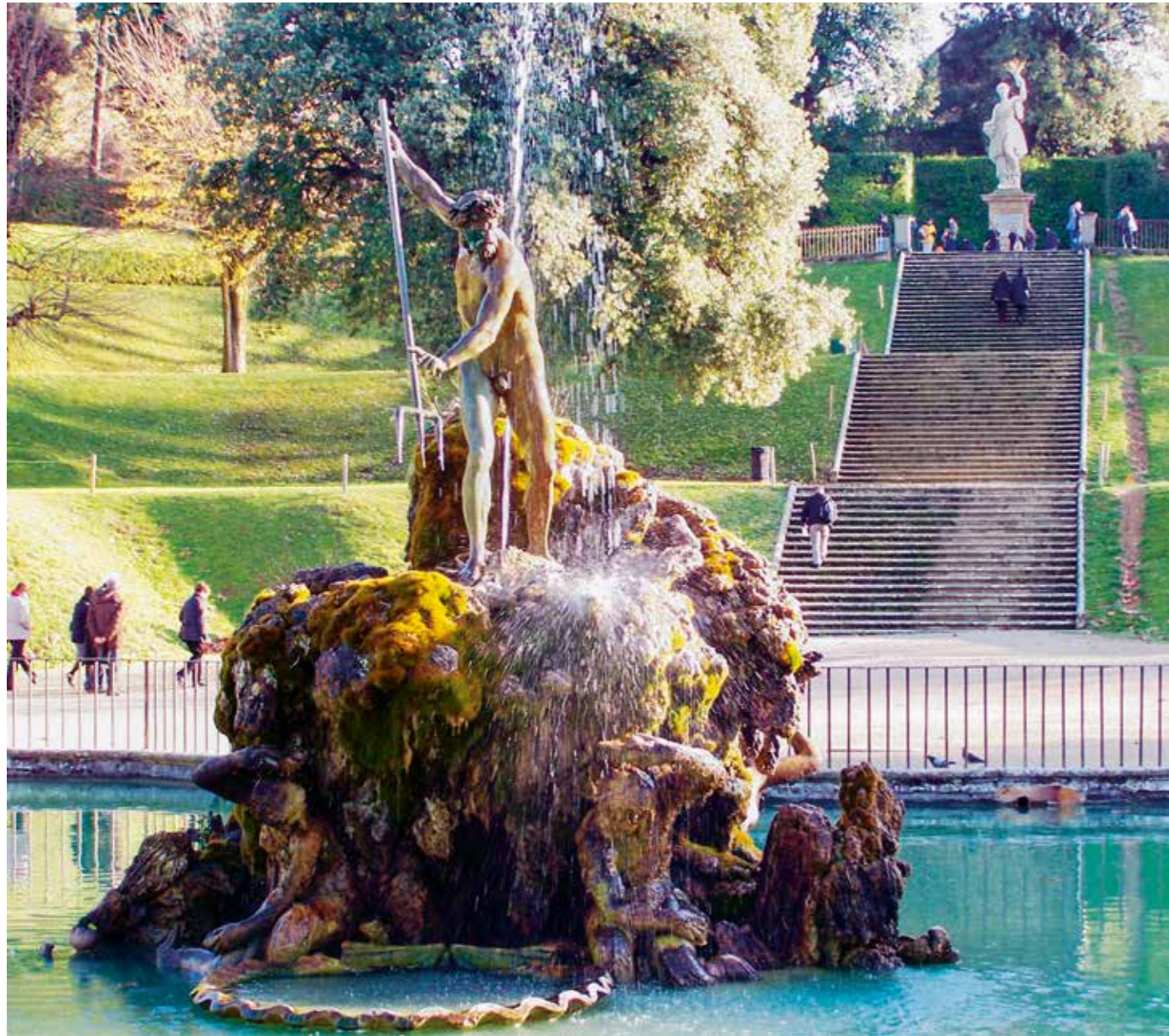
Florence, jardin Boboli, fontaine de Neptune.

11. Il s'agit de l'Acqua Vergine. Dans la suite, le passage coupé rappelle les grands travaux menés par Agrippa pour l'adduction d'eau à Rome.