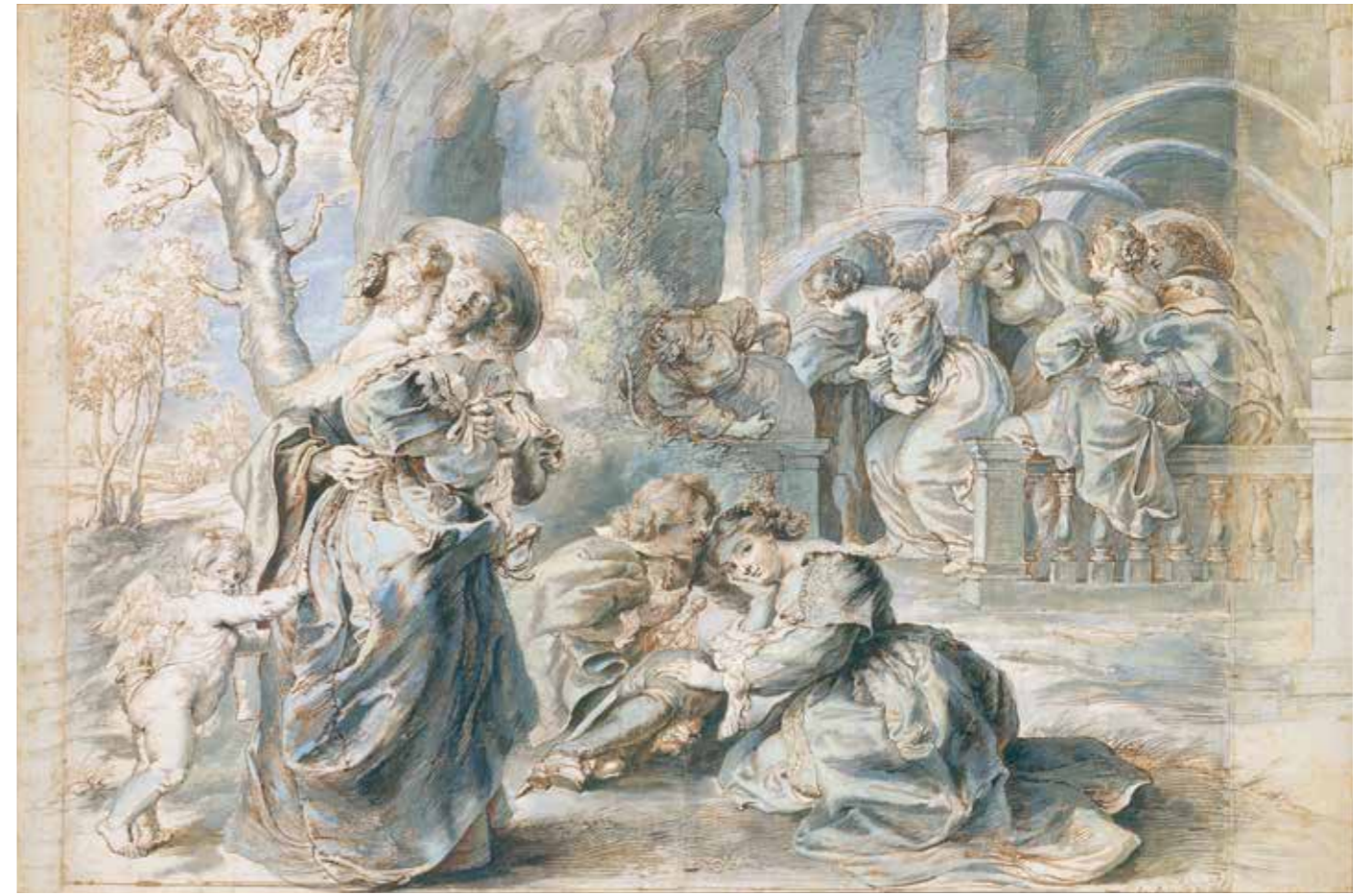
Pierre Paul Rubens, Le Jardin d'amour , 1633-1635, plume, encre brune et couleurs, New York, The Metropolitan Museum of Art.

Dans sa description de la villa civile , un projet idéal, Anton Francesco Doni explique : "Sous la grotte, j'aimerais qu'une partie de l'eau soit dissimulée ; au contact d'un pied sur le sol, elle jaillirait des deux côtés par des jets fins, hauts de deux ou trois brasses [environ 1,50 mètre], depuis les murets servant de siège comme des parties où l'on reste debout, en atteignant les gens qui se retrouveraient dans un tel lieu pour leur plaisir. On prévoira certains abris à l'attention de celui qui connaîtra les secrets des