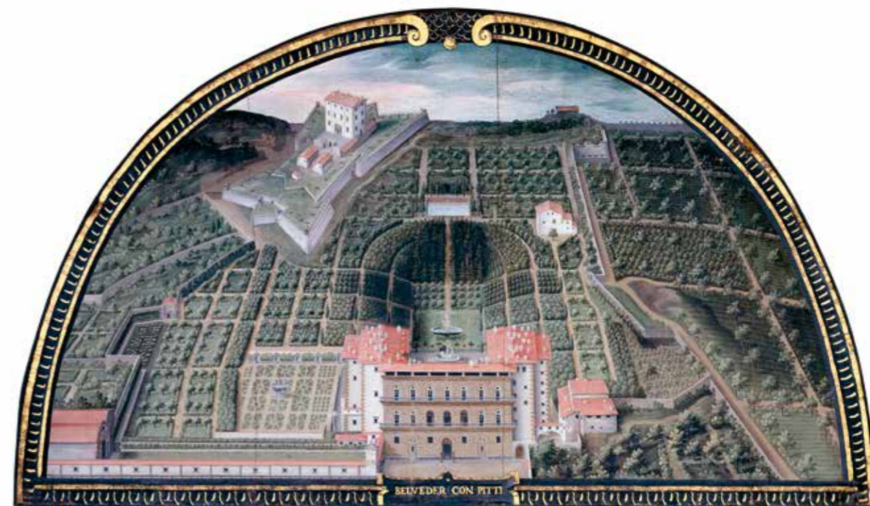
Giusto Utens, Boboli , vers 1600, Florence, villa La Petraia.