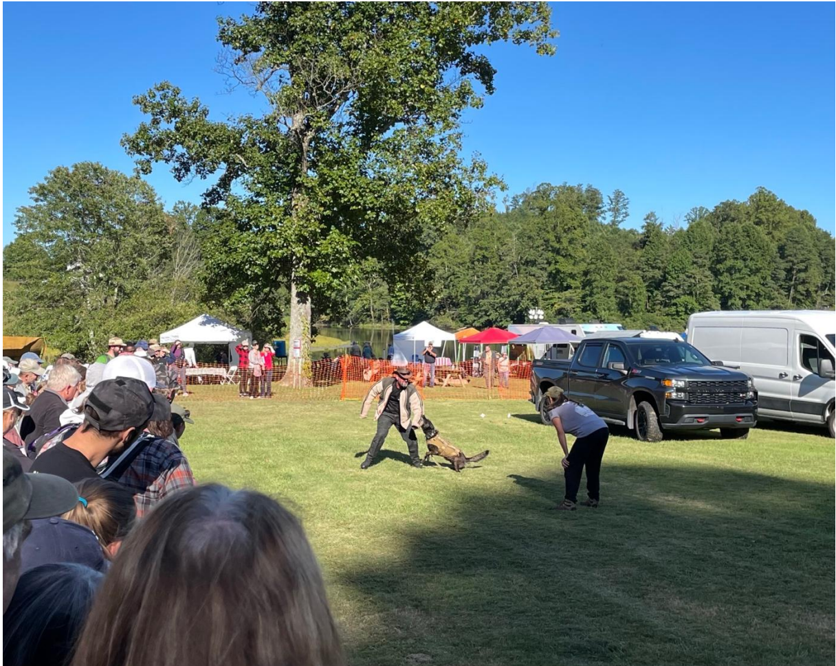
Illustration n°3 – Démonstration des capacités de « défense » de chiens entraînés