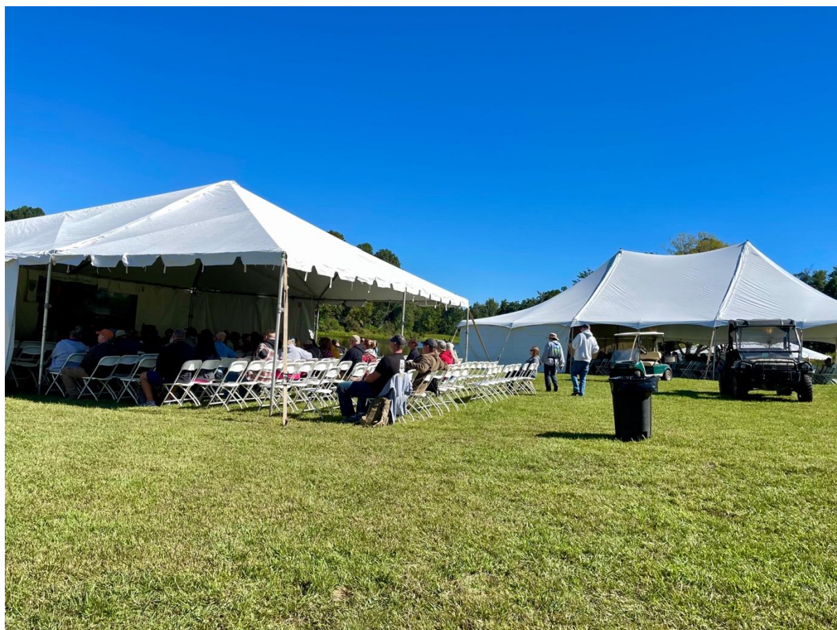
Illustration n°2 – L'une des tentes dédiées aux cours et enseignements

The Survival Expo s'organise principalement autour de deux zones : un espace commercial où une trentaine d'exposants tiennent des stands et un espace plus pédagogique, organisé autour de sept tentes blanches de taille variable. Une fois passé le portique, je m'oriente grâce au planning affiché à l'entrée. Le visiteur peut composer son programme parmi les dizaines de classes offertes, qui se répètent sur les trois jours [Illustration n°2]. On y trouve des enseignements sur l'utilité de la préparation ( Getting Off Grid – Now !, Prepping Priorities... ), sur la production et la conservation de nourriture ( Mushrooms, Beekeeping, Wild Edible Survival... ), sur l'épargne et l'économie ( Gold & Silver, Entrepreneurship for Survivalists ), sur la santé ( Pandemic Survival, Colloidal Silver ) et, pour près d'un tiers, sur la sécurité ( Survival Groups, Urban Survival, etc. ).