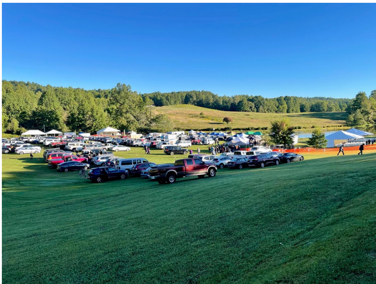
Illustration n°1 – Arrivée à The Survivalist Expo (jour n°1)

The Survivalist Expo – ou TSE – est aujourd’hui l’une des principales conventions prepper aux États-Unis, voire au monde. Durant trois jours, elle réunit près d’un millier de participants à quelques miles de Brath – une petite ville de la Bible Belt , cette zone du Sud des États-Unis dont la population blanche se retrouve autour d’une interprétation rigoureuse et identitaire du protestantisme. Au cœur des vallons de la chaîne des Blue Ridge , TSE réunit celles et ceux qui désirent se former à la « préparation ». Pour un peu moins de 100 dollars le pass (sans l’hébergement), la convention offre une série de « classes » où des instructeurs dispensent des savoirs et des techniques choisis pour affronter le ou les bouleversements futurs qui, pensent les preppers , détruiront notre quotidien