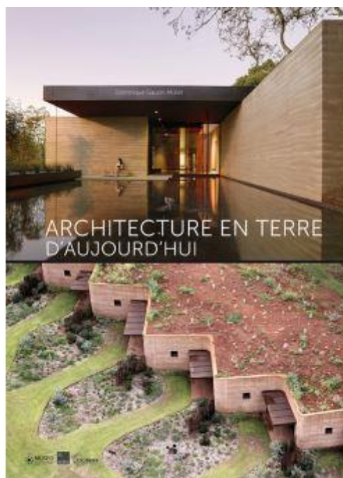
Figure n°5 : la couverture du livre de Dominique Gauzin-Müller, Architecture en terre d'aujourd'hui (2017).

Plus récemment, les historiens de l'architecture documentent un retour à la terre, d'abord dans les années 1970. En France en 1985, la réalisation du Domaine de la Terre est ainsi particulièrement mise en avant, tout en notant sa difficulté à se traduire en un mouvement plus large. Enfin, l'année 2008, marquée par la livraison du bâtiment de l'entrepreneur et artisan du pisé Martin Rauch en 2008, constitue l'entrée dans une nouvelle phase, avec un grand retentissement médiatique et un tournant vers des réalisations plus vastes et aux programmes plus complexes, prenant place dans des espaces urbains. Diverses innovations techniques, telles que la préfabrication, jouent un rôle dans ce retour. Sa réintroduction dans l'enseignement, dans des centres pionniers comme le laboratoire CraTerre de l'école d'architecture de Grenoble ou à l'école polytechnique de Lausanne, vise à remettre en circulation un savoir oublié, tout en expérimentant ses nouvelles potentialités. Parmi elles, les qualités thermiques, hygrométriques et plus largement écologiques du matériau terre sont particulièrement mises en avant. C'est là un point d'accroche avec la thématique de l'urgence écologique.