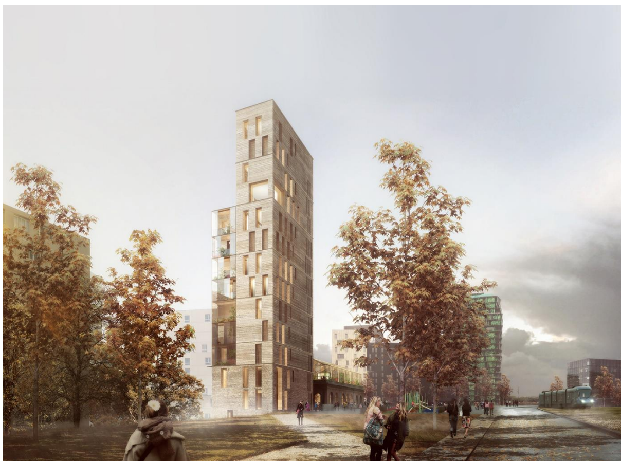
Figure n°4 : Tour de logements en terre crue et restructuration de l'ancienne gare Masséna en marché couvert, Concours international Réinventer Paris, Terre à bâtir, terre à nourrir 2015. Projet finaliste 2 e Prix, Agence Joly & Loiret.