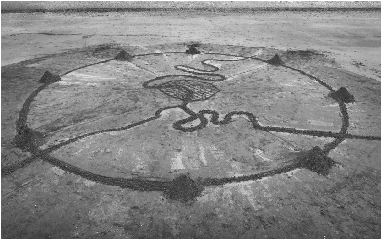
Figure 2 : « Le projet des Belvédères réconcilie action artistique paysagère de Land Art et valorisation dynamique des terres excavées. Il célébrera une forme d'identité métropolitaine du XXIème siècle soucieuse d'associer industrie circulaire, écologie et identité culturelle. »

et les spectateurs de ces photographies au cœur de la matière et de ses mouvements, dans un espace dominé par le travail mécanique (où les hommes sont quasiment absents) et sans donner à voir et à percevoir les relations de ces artefacts sédimentaires avec leur environnement.