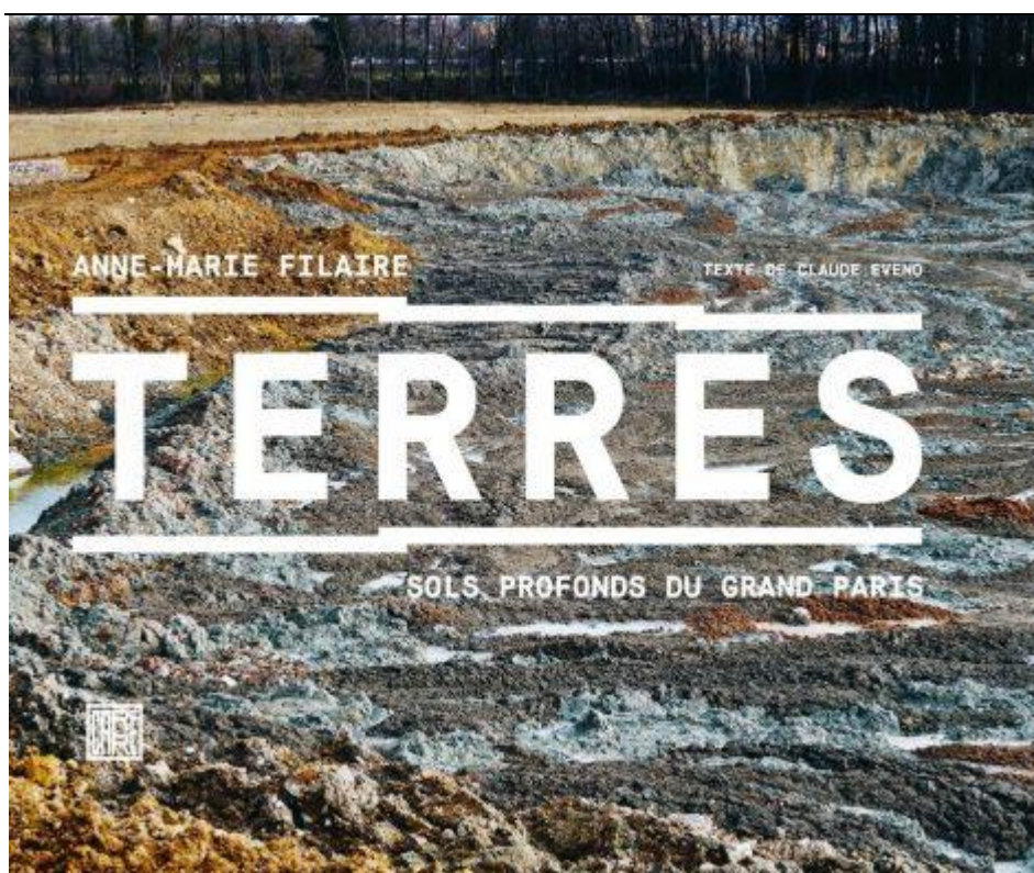
Figure 1 : La couverture du livre d'Anne-Marie Filaire

Un premier point d'analyse de ces représentations porte sur les spatialités dévoilées par les choix esthétiques respectifs des auteurs. Ainsi, le travail photographique d'Anne-Marie Filaire privilégie-t-il un point de vue du dedans, à hauteur « de femme », rarement panoramique et parfois même plutôt en contre-plongée dans les strates charriées et étendues par les engins qui déposent et modèlent les terres excavées. Cette position au plus près des terres permet de percevoir leur matérialité même, dans ses variations de texture, de granulométrie, d'humidité ou de couleurs. Certes, le point de vue photographique offre parfois des échappées visuelles sur l'environnement immédiat des zones de dépôt mais tend pour l'essentiel à placer l'observatrice