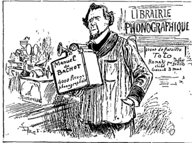
FIGURE 2 – Robida, 1892, p. 64

Comme le montre l'illustration ci-dessous, son intuition l'amène même à penser de nouvelles formes d'apprentissage mobile, comme le podcast.