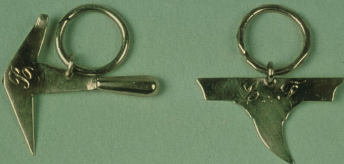
Joins (anneaux d'oreille) de compagnons couvreurs avec outils suspendus (marteau et enclumette), 19 e siècle (coll. Musée du Compagnonnage de Tours).