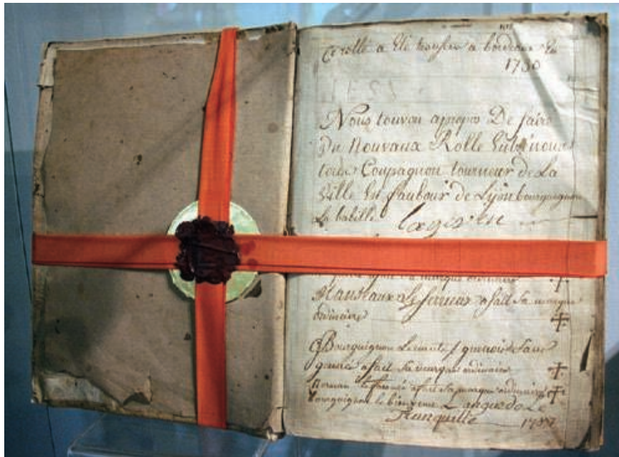
Livre des règles et registres, dit « Rôle », des compagnons tourneurs sur bois de la ville de Lyon (1730 ; coll. Musée du Compagnonnage de Tours)

dans de nombreuses autres corporations), est celui qui est capable d'exhiber les stigmates de sa profession, traces de limites approchées. Dans l'ombre de l'Orient, il y a toujours, pour faire l'homme de métier, la découverte périlleuse de l'impossibilité d'une maîtrise totale, dont l'expérimentation douloureuse constitue le mal nécessaire. Or ces blessures laissées par l'exercice du métier possèdent également un autre niveau de lecture qui, hors du champ du travail, signifie dans l'ordre de la personne et du genre l'accession à un degré supérieur de virilité. Passé le moment de la blessure elle-même, l'exhibition, ostentatoire ou discrète, des cicatrices du métier possède son immédiate traduction dans les termes du passage à l'âge d'homme. C'est que la maîtrise de soi ne peut réellement se mesurer, ou au moins s'établir, qu'à partir du moment où elle est mise en danger, contestée, défaillante. Pour la faire exister, il faut bien y déchoir à un moment ou à un autre.