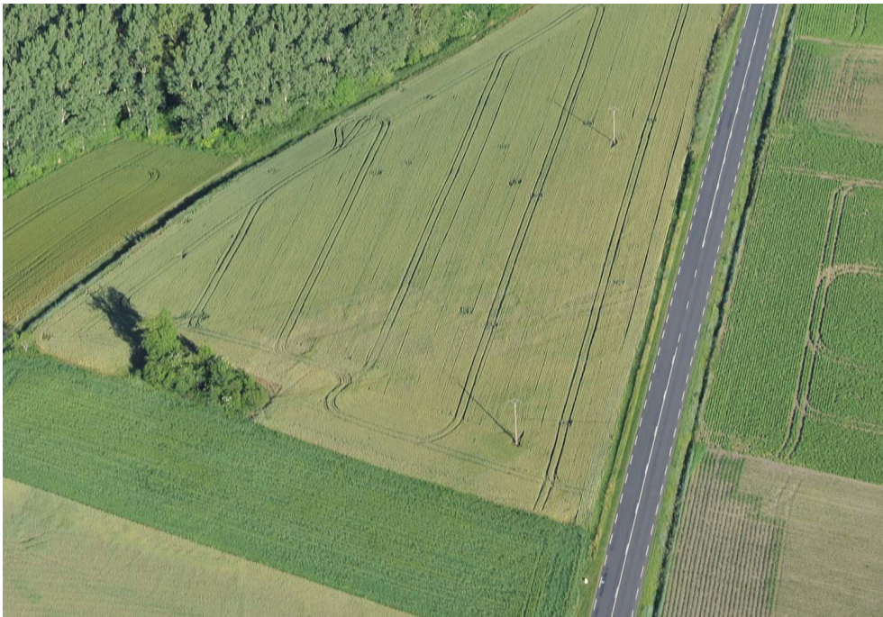
Fig. 1 – Pars urbana de la villa romaine de Fiole (Vassel)