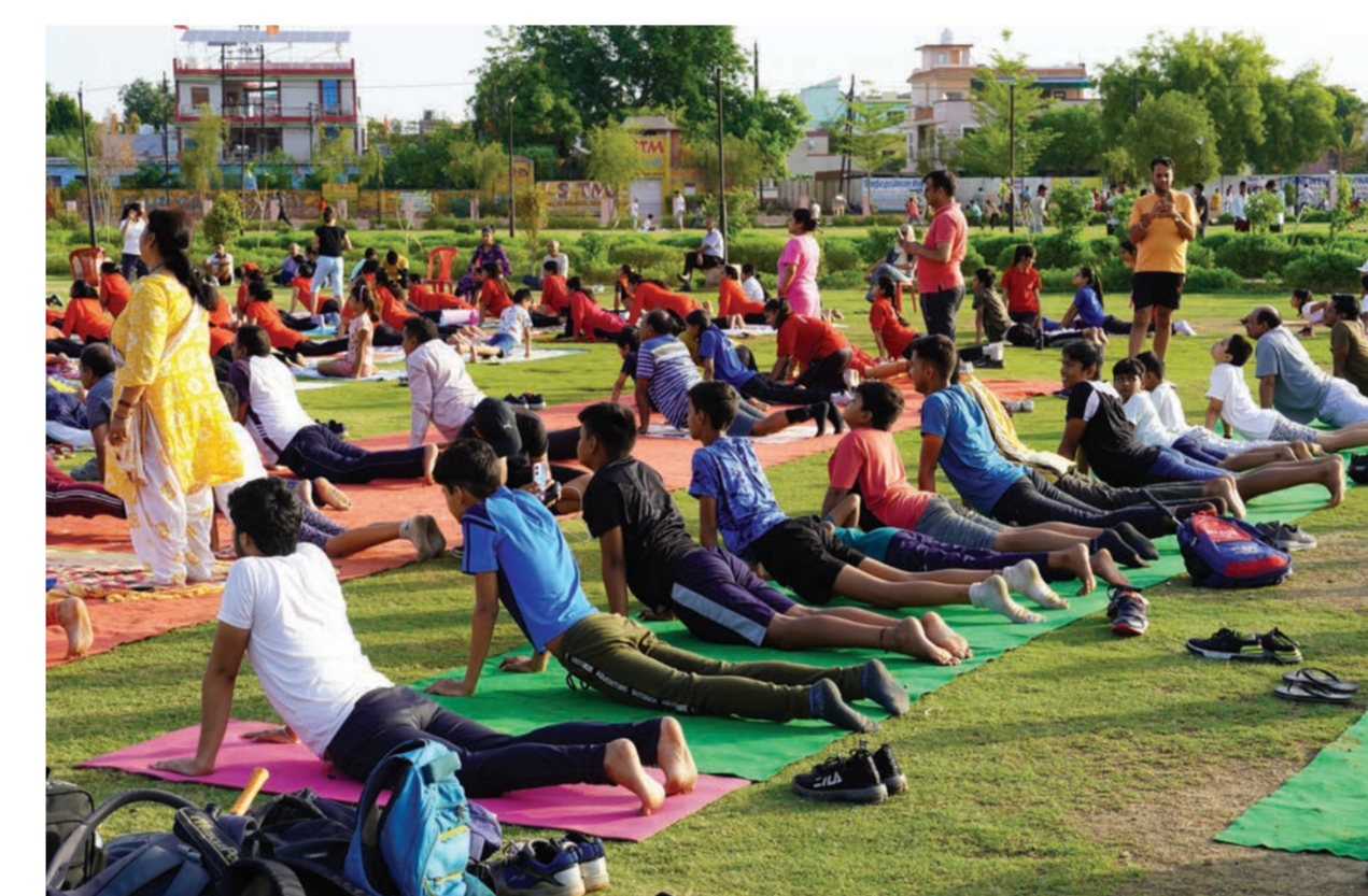
Le yoga en Inde : d'une pratique spirituelle réservée aux ascètes (Sadhus)... à une pratique grand public visant la santé (International Yoga Day).