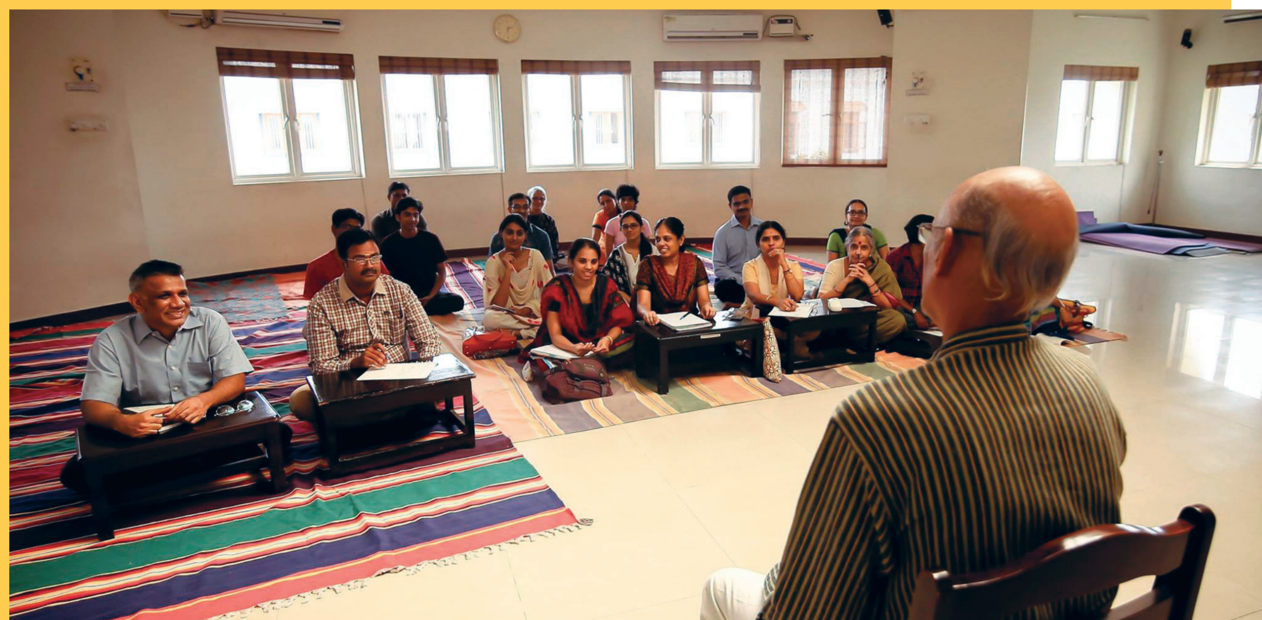
Workshop d'enseignement du yoga, centre KYM, Chennai, Inde.

80 % des pratiquants français sont des femmes (source : INJEP, 2020)