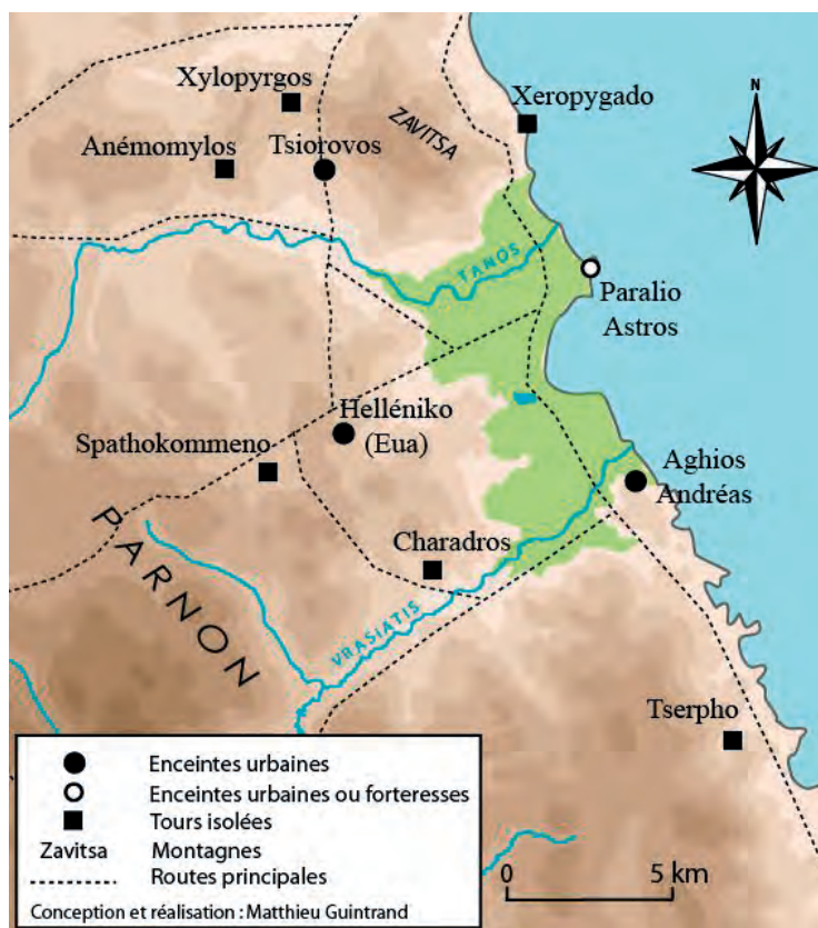
Fig. 1 — Carte des ouvrages fortifiés de Thyréatide.

L'annexion de la Thyréatide par Sparte, au VI e s., aurait été motivée par le besoin de faire reconnaître sa puissance territoriale auprès de cités récalcitrantes du Péloponnèse, telle Argos. L'intervention de Cléomène dans la région, à la veille des guerres médiques, marquerait l'affirmation spartiate sur celle-ci 6 .