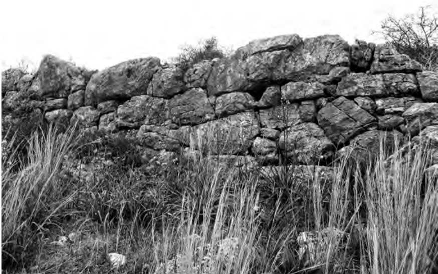
Fig. 4 — Parement extérieur du rempart du site de Paralio Astros (cl. M. Guintrand 2012).