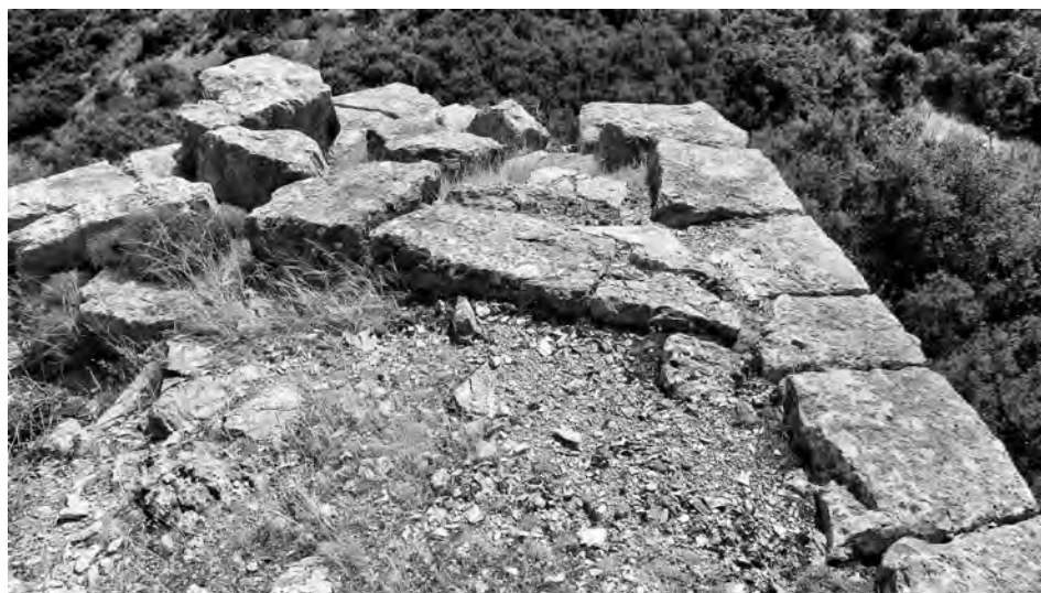
Fig. 8 — Bastion sud de l'enceinte d'Helléniko (Eua).

Pour finir, on a pu aussi observer que certaines courtines d'Eua sont constituées d'un appareil parallélépipédique qui pourrait correspondre également à une phase hellénistique de restauration des défenses. Ainsi, le bastion implanté au Sud de l'enceinte d'Eua, présente un appareil parallélépipédique pseudo isodome (fig. 8) qui doit être un ajout. Celui-ci pourrait dater de la période où les Argiens, au milieu du iii e s., ont bénéficié de l'appui des souverains macédoniens, Antigone Gonatas puis Antigone Dosôn, pour défendre les villes isolées du Parnon 60 . Ils ont alors pu procéder au renforcement des fortifications existantes.