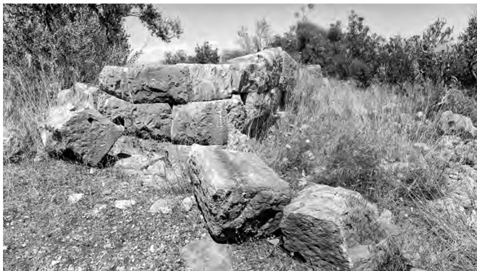
Fig. 7 — Angle sud-ouest de la tour de Tserpho.

Une fois effectué cet inventaire des vestiges fortifiés connus de Thyréatide, toute la difficulté de l'étude des politiques défensives de la région réside dans le fait de distinguer les fortifications d'époque lacédémonienne de celles de la période argienne. L'étape suivante consiste donc à tenter de replacer celles-ci dans leur contexte historique pour essayer de distinguer qui, d'Argos ou de Sparte, en fut l'initiatrice.