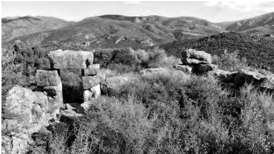
Fig. 6 — Tour de Charadros.