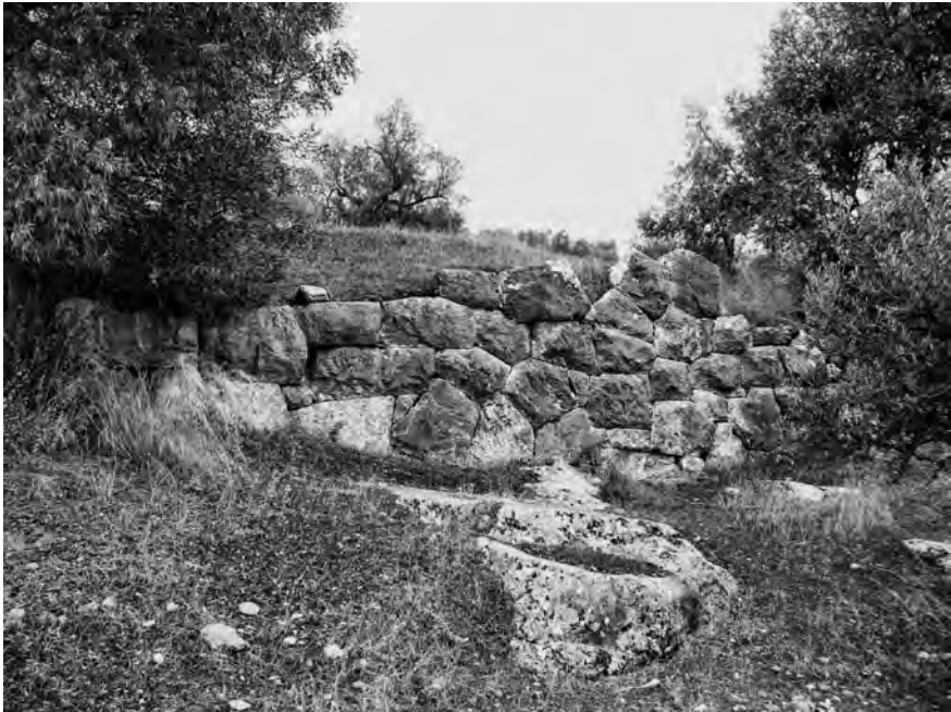
Fig. 3 — Parement extérieur du rempart nord de l'enceinte d'Ag. Andréas (cl. M. Guintrand 2012).