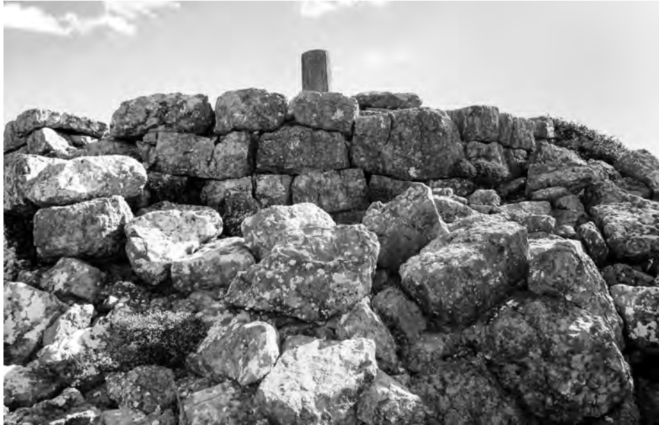
Fig. 5 — Tour de Xylopyrgos (cl. M. Guinrand 2014).