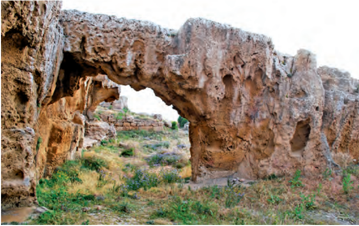
Figure 3. Arche rupestre sous la rampe d'accès à la porte Nord-Ouest. Vue vers le sud.