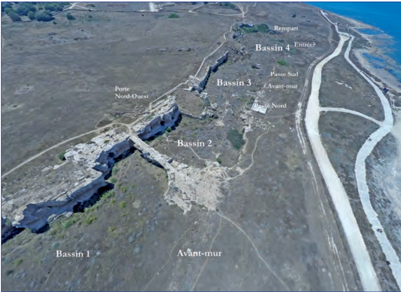
Figure 7. Identification des aménagements rupestres dans le fossé en avant du rempart occidental. Vue vers le sud.