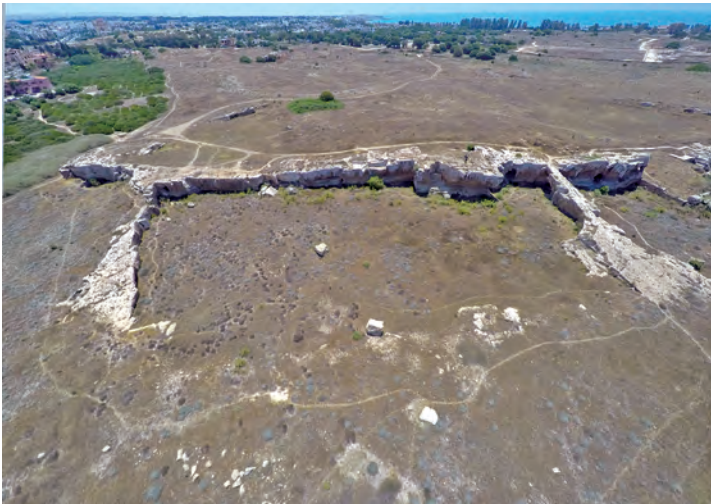
Figure 2. La rampe Nord et le pont rupestre. Vue vers l'est.

n'est identifiable à Paphos, mais ces comparaisons permettent d'affirmer que des bateaux de dimensions similaires auraient pu y tenir, arrimés le long du fossé, au pied du rempart. De même, les dimensions des passages, celui le plus au nord à l'ouest du fossé, ainsi que celui sous le pont rupestre, respectivement de 7,60 et 6 m, s'avèrent compatibles avec le passage de bateaux importants : ainsi, au Pirée, l'entraxe des néôria de Zéa est de 6,50 m, et celle des néôria de Mounichie de 6,25 m 18 . Ces dimensions sont compatibles également