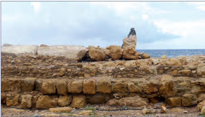
Figure 8. Vestiges d'assises de boutisses à l'extrémité orientale du rempart sud. Vue vers le sud.

comment, sous le règne de ce souverain, a été créée une navarchie générale et permanente à la tête de laquelle était Kallicratès de Samos. Il poussa au développement de chantiers navals dans toutes les possessions lagides, à Chypre comme ailleurs 28 . Ainsi, il est possible que les longs bassins identifiés au nord-ouest de la ville aient été creusés pour