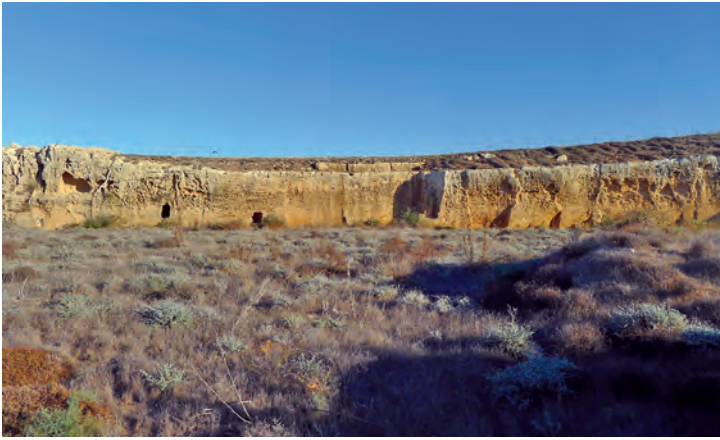
Figure 1. Le fossé au pied du rempart occidental. Vue vers l'est.