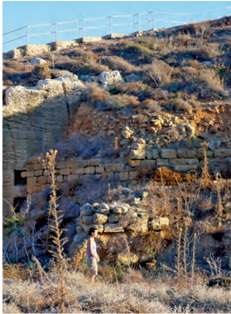
Figure 9. Épais remblai sous la fondation d'une tour (T2). Vue vers l'est.

nettement le remblai sur lequel est fondée la tour T2, d'1,60 à 2 m au-dessus du niveau de circulation actuel au fond du fossé. Ces aménagements portuaires semblent avoir été considérés comme ne pouvant plus être remis en service après les tremblements de terre dont Paphos a été victime entre le dernier quart du 1 er siècle av. J.-C. et la deuxième moitié du 1 er siècle de notre ère. Les dernières années de leur existence, ils étaient d'ailleurs peut-être déjà utilisés seulement par des embarcations de faible tirant d'eau en raison du phénomène de colmatage 46 , ce qui a pu conduire à la décision de les remblayer en partie. C'est peut-être au même moment que l'ouverture la plus large taillée dans la paroi ouest du fossé a été barrée : les trois assises encore en place sont constituées de blocs de taille pouvant provenir de l'avant-mur 47 . Dès lors, à l'époque romaine, lorsque la base du rempart occidental est réutilisée, semble-t-il, comme soubassement d'un rempart romain, l'ancien bassin, partiellement remblayé, a servi de fossé, dont le fond était donc beaucoup moins profond que celui, en eaux, d'époque hellénistique. Ce fossé ne semble plus avoir été protégé par un proteichisma : il n'avait pas de valeur véritablement défensive, mais