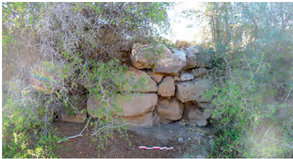
Figure 5. Vestiges du mur barrant la passe nord taillée dans la roche à l'ouest du fossé. Vue vers l'ouest.