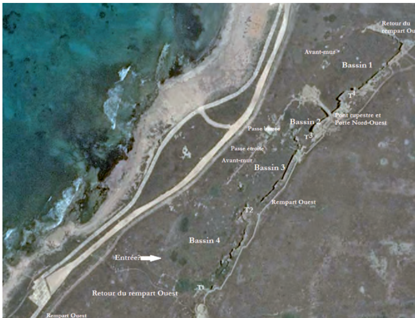
Figure 6. Identification des aménagements rupestres dans le fossé en avant du rempart occidental. Vue orientée au nord.

portuaires chypriotes. En témoignent la présence d'un constructeur de bateau connu par une inscription incisée sur une jarre datée de la période hellénistique I, « Πριτίου ναυπηγῶ », et celle d'un architecte naval, Pyrgotélès, fils de Zoëtos, que Ptolémée Philadelphe lui-même a honoré par l'érection de sa statue dans le sanctuaire d'Aphrodite de l'ancienne Paphos, pour la construction d'une triacontère et d'une eikosère 27 . On sait