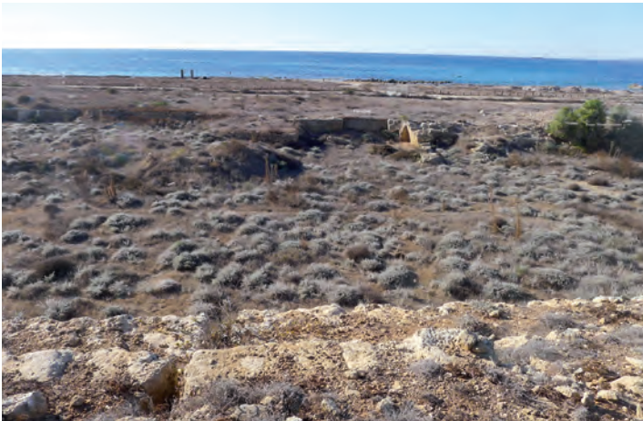
Figure 4. Les deux passes obturées taillées à travers la roche à l'ouest du fossé. Au premier plan, vestiges du rempart occidental. Vue vers l'ouest.

avec la largeur de 11 m que l'on retrouve dans le fossé, d'abord au sud de la porte Nord-Ouest, au point où celui-ci se resserre par une saillie du soubassement du rempart, et ensuite à l'est et à l'ouest de la portion de roche qui subsiste au milieu du fossé. Celle-ci, qui forme approximativement un cube de 1,50 m de côté, a été visiblement conservée à dessein pour distinguer ces deux passages de 11 m de large, probablement pour faciliter la circulation d'embarcations entrant ou sortant des bassins.