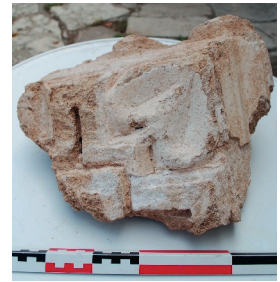
Fig. 12. Corniche d'angle n°6

Fonction : Ce fragment correspond à la partie inférieure du débord d'un entablement de type ionique.