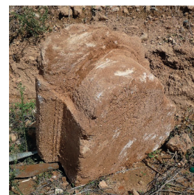
Fig. 11. Base de pilier cordiforme n°10

Fonction : ce type de pilier se trouvait dans un angle rentrant, à l'extrémité d'un mur plein s'articulant avec une structure perpendiculaire ouverte (porte ou portique) comportant au sol un seuil ou un stylobate.