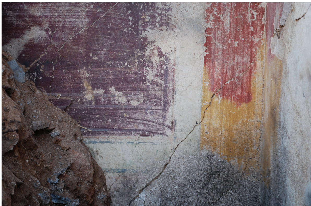
Fig. 7. Espace 0. Face ouest du mur est et angle avec la face nord du mur sud

dans leur partie inférieure ( fig. 5–6 ): leur couleur rouge vif est due à leur oxydation par le feu, lié soit aux activités artisanales effectuées dans la pièce après l'abandon du bâtiment, soit à la décharge moderne 12 .