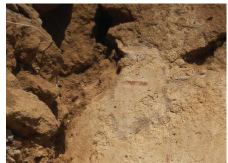
Fig. 4. Hampe à volutes (pièce 2)