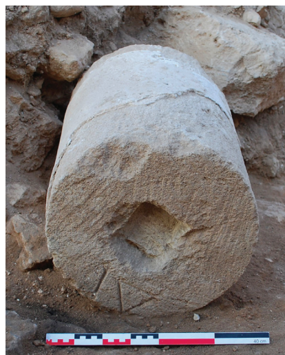
Fig. 9. Tambour de colonne n°4

Fonction : Le nombre delta iota pourrait correspondre à l'emplacement de ce tambour dans la colonne, soit, s'il s'agit du tambour le plus élevé, une hauteur de colonne comprise entre 7 m et 8 m.