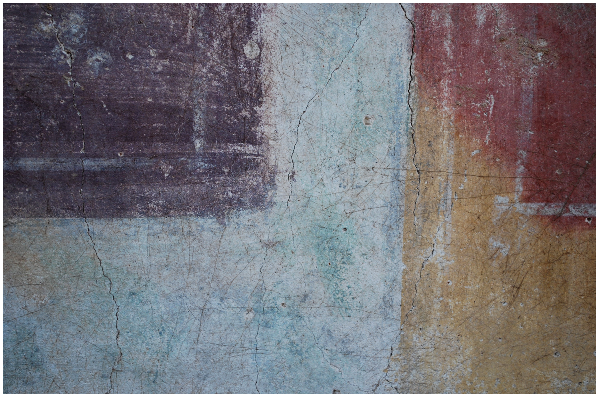
Fig. 6. Espace 0. Face nord du mur sud. Détail