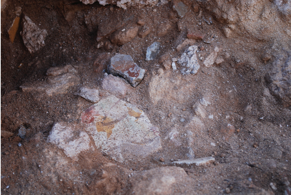
Fig. 8. Espace 0. Dans la couche de destruction, décor fragmentaire semblant imiter la brèche ou l'alabastr

la stratigraphie de l'espace 5), en revanche, la fouille n'a pas encore permis de proposer de datation de la deuxième phase car l'espace 0 a été fortement endommagé par la décharge sauvage qui le recouvrait. En revanche, l'observation technique et pratique faite sur les parois mêmes des murs de l'espace 0 apporte une indication chronologique. Ainsi, la fouille de la porte entre l'espace 0 et l'espace 3 a montré que ce passage avait été réduit, probablement à la suite du séisme ou de la poussée de terrain qui avait conduit à remblayer les espaces 1 et 2 : des traces d'enduits peints sont visibles sur les joints de blocs à l'intérieur du mur. Il s'agit en fait du pilier de la première phase de la porte, contre lequel a été accolé un autre pilier lors de la phase de remaniement du bâtiment 20 . Ce dernier pilier porte encore des restes de plâtre avec une incision en arête de poisson arriccio , précisément destinée à recevoir les différentes fines couches de l'enduit peint. Or, le même type d'incision a pu être observé par E. Hadjistephanou dans la Maison d'Orphée fouillée par D. Michaelides pour l'Université de Chypre. Selon ce dernier cette maison daterait de la fin du II e ou du début du III e siècle ap. J.-C. 21