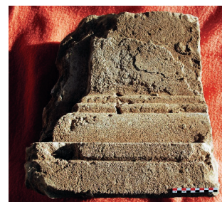
Fig. 10. Fragment de base de pilastre mouluré n°5