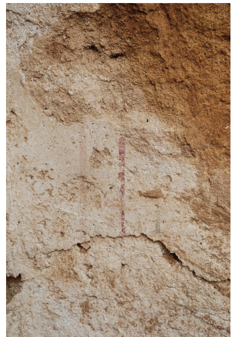
Fig. 3. Filets parallèles

Parfois, ce filet rouge est doublé, voire triplé, d'un filet grisâtre qui lui est parallèle (fig. 3). Sur le mur ouest de la pièce 2, à 1,50 m au Sud de l'angle avec le mur nord, Fr. Alabe a pu voir un décor figuré dans lequel elle a reconnu une hampe à volutes : « deux épaisses virgules ascendantes et divergentes de part et d'autre d'une tige centrale sont reconnaissables comme une hampe à volutes » 5 (fig. 4). Cette hampe sombre, dessinée au pinceau, se trouve dans l'angle supérieur droit d'un cadre délimité par deux filets rouges, vertical et horizontal, précisément à 15 cm sous cet angle. Dans son rapport de 2011, Fr. Alabe précise que « ce motif est assez fréquent, dans sa version la plus simple, dans des décors de la fin du I er siècle av. J.-C., aussi bien en Italie (maison d'Auguste à Rome, maison des Noces d'argent à Pompéi, Solonte, Oplontis) qu'en Gaule (Glanum, Ensérune), en Grèce (Théra) ou au Levant (Masada). Le motif des hampes en volutes est repris à la fin du IV e siècle apr. J.-C. en Asie Mineure et dans le bassin égéen (Théra, Délos, Kos, Ptolémaïs, Éphèse) » 6 . Selon elle,