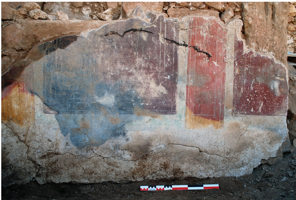
Fig. 5. Espace 0. Face nord du mur sud : enduit peint in situ dans la partie inférieure. Vue vers le Sud

si on rattache ce motif à la série du I er siècle (30–20 av. J.-C.), il serait « un élément de Deuxième style schématique/transition avec le Troisième style pompéien » 7 .