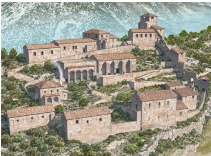
Fig.1 Évocation du castellum de La Malène au début du vi e siècle d'après les fouilles de 2008-2011.

Ce phénomène de respiration des territoires et des communautés s'observe également à une échelle intermédiaire. À un niveau cette fois-ci inférieur à la cité, de petites agglomérations désormais mieux documentées par l'archéologie peuvent également disposer de groupes ecclésiastiques. Ainsi, à Roujan- Medilianum en Biterrois, d'anciens temples antiques sont rasés ou transformés en basilique funéraire tandis qu'un baptistère est édifié dans le courant du vi e siècle 2 . Si la redécouverte de tels petits centres locaux nous permet d'entrevoir la vitalité de communautés locales, ne perdons pas de vue néanmoins la complexité de la mosaïque des paysages. De grandes étendues de terre demeurent sous-peuplées.