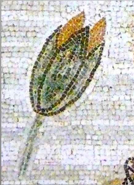
Bouton émergeant des eaux