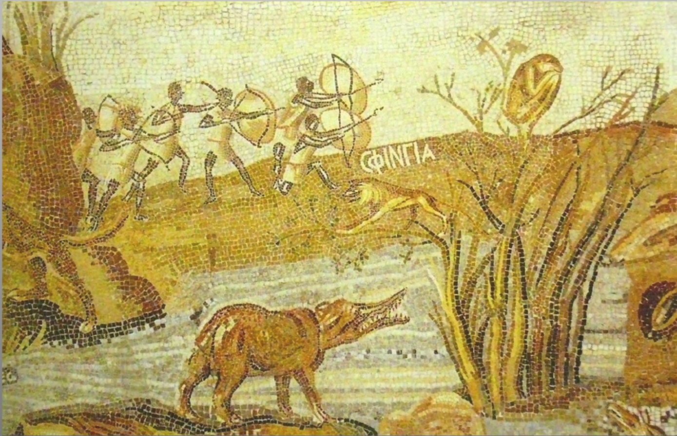
Groupe d'Éthiopiens en action de chasse (section 2)