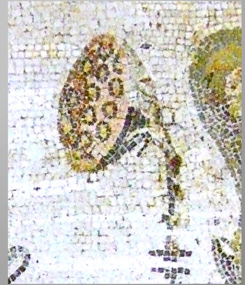
Fruit du nélumbo ( kaborion )

Les étapes de la floraison du nélumbo d'après la mosaïque de la « maison du Faune » (Pompéi, fin du II e s. av. J.-C.)