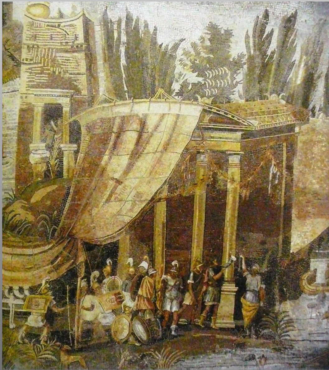
Édifice palatial alexandrin (section 13)