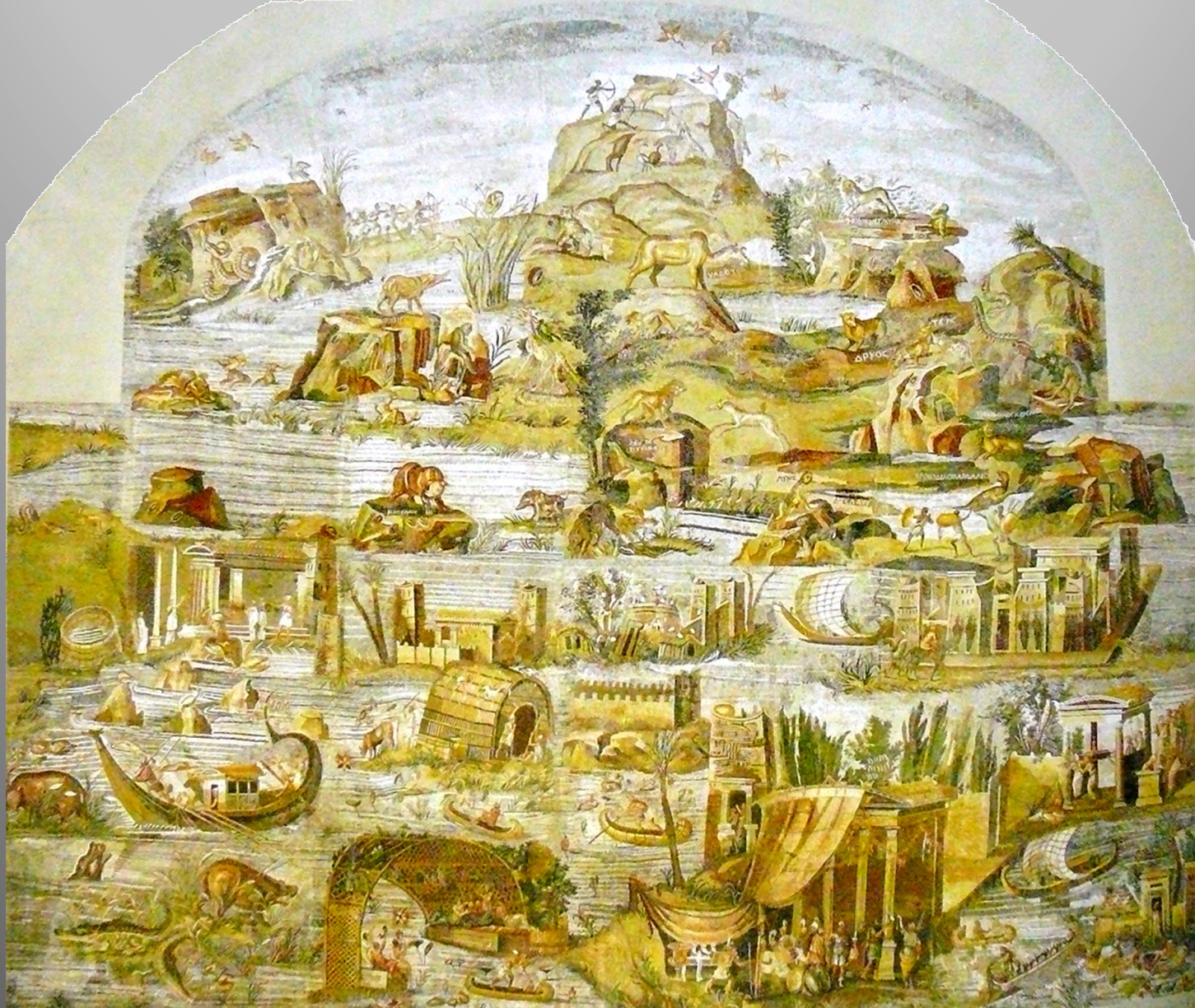
Mosaïque de Préneste (Italie, fin II e s. av. J.-C.)