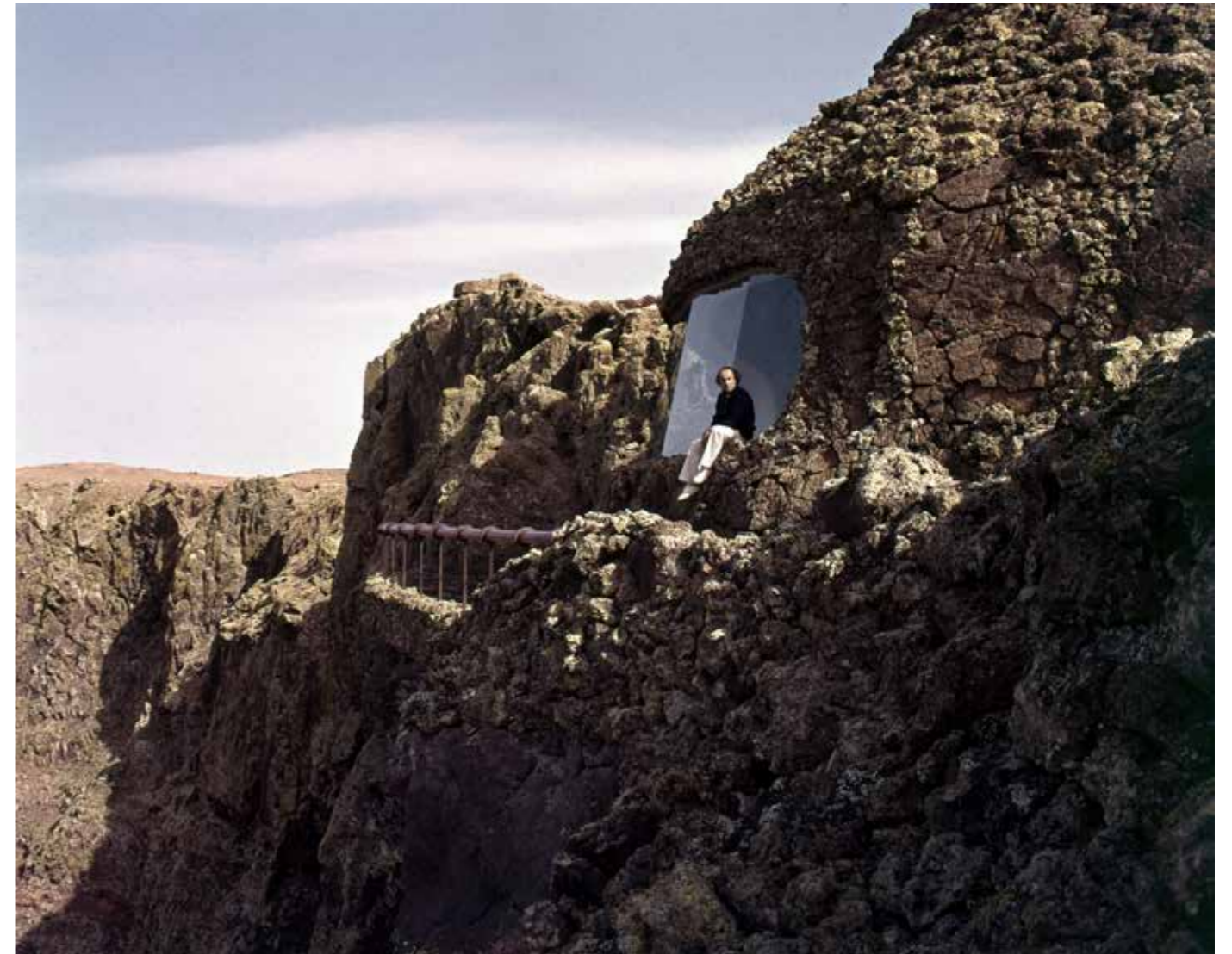
César Manrique au Mirador del Río.