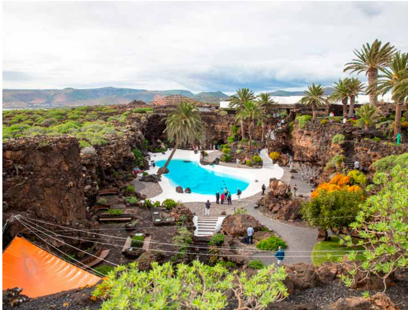
Jameos del Agua (1966-1977).