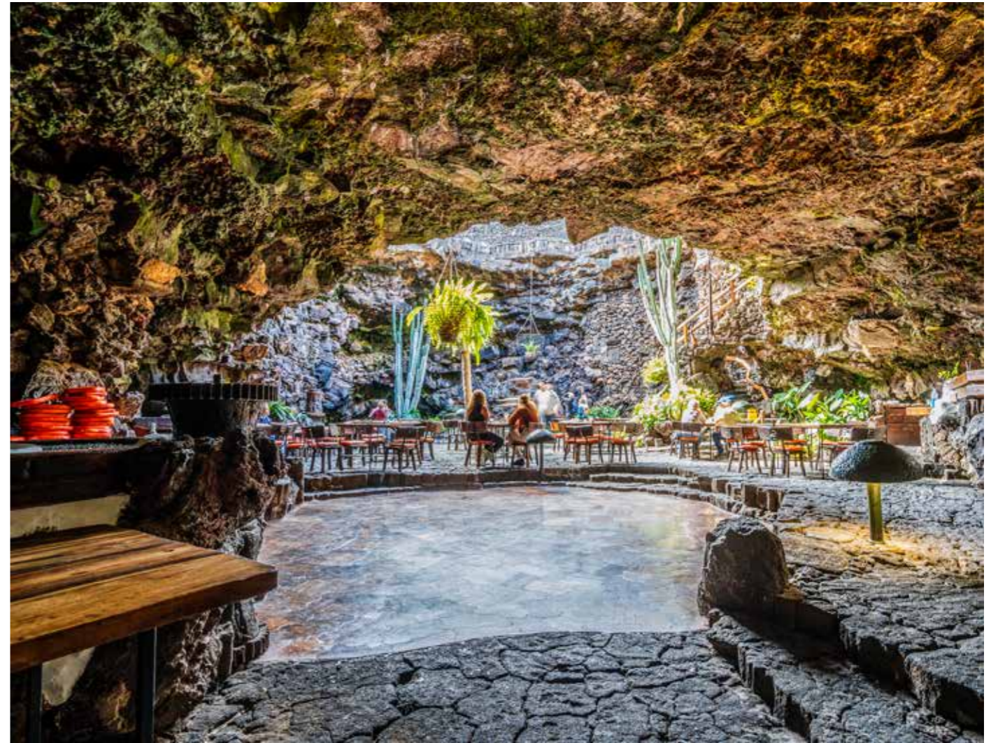
Jameos del Agua (1966-1977).