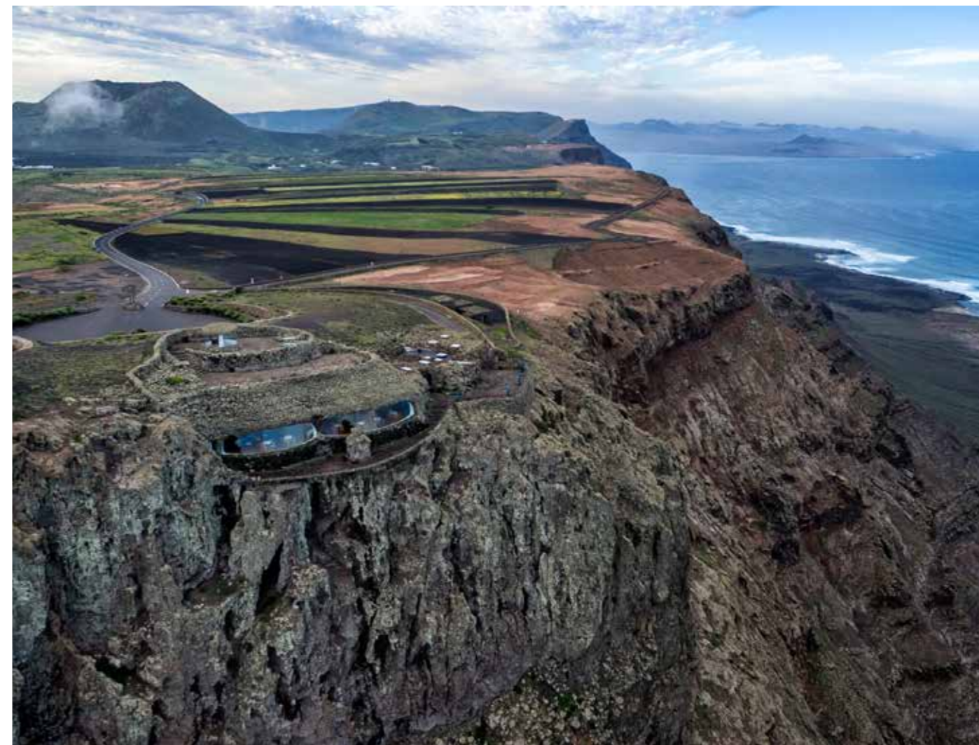
Mirador del Río (1974), aménagement d'un promontoire à l'extrême nord de Lanzarote.