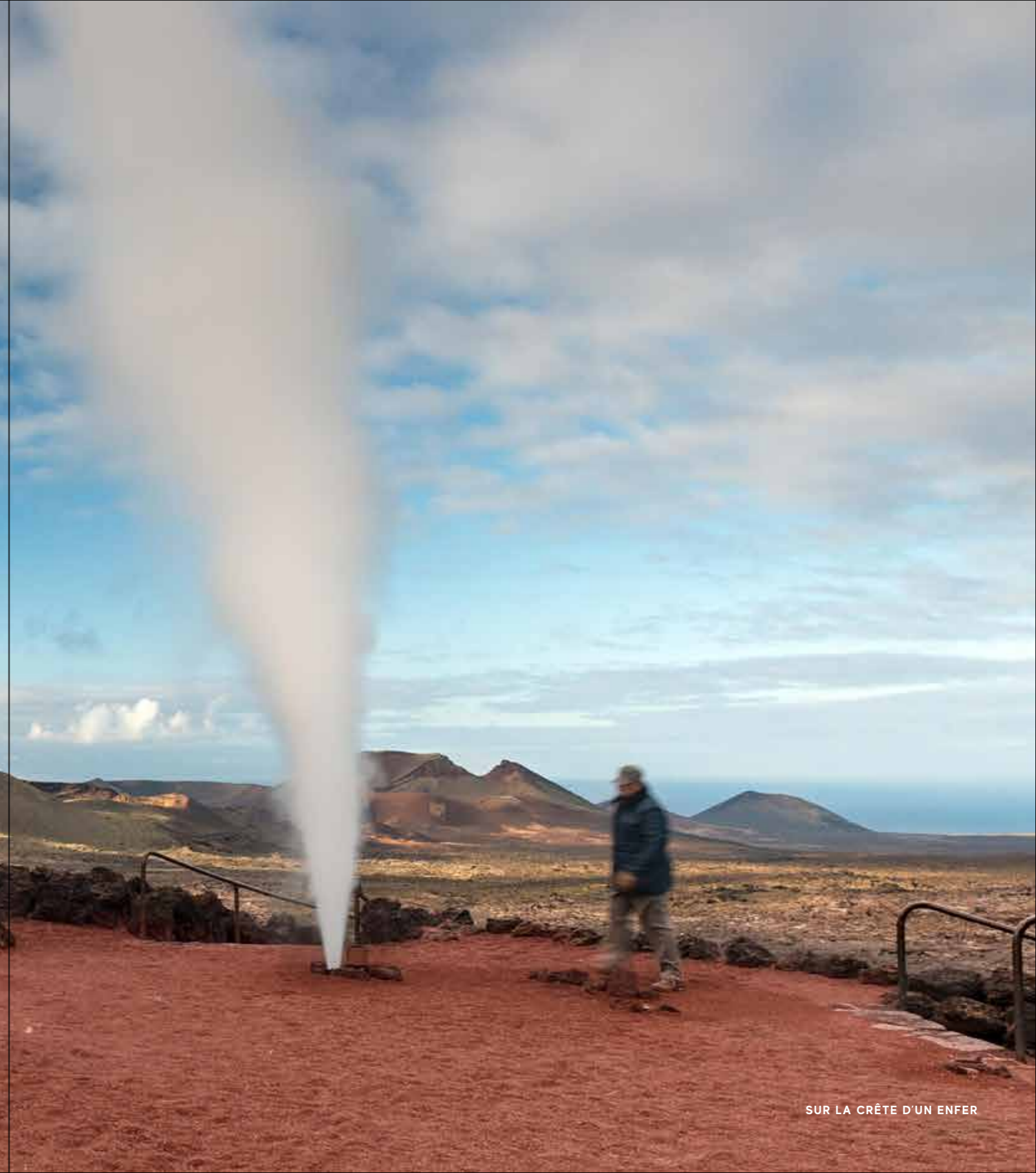
SUR LA CRÊTE D'UN ENFER