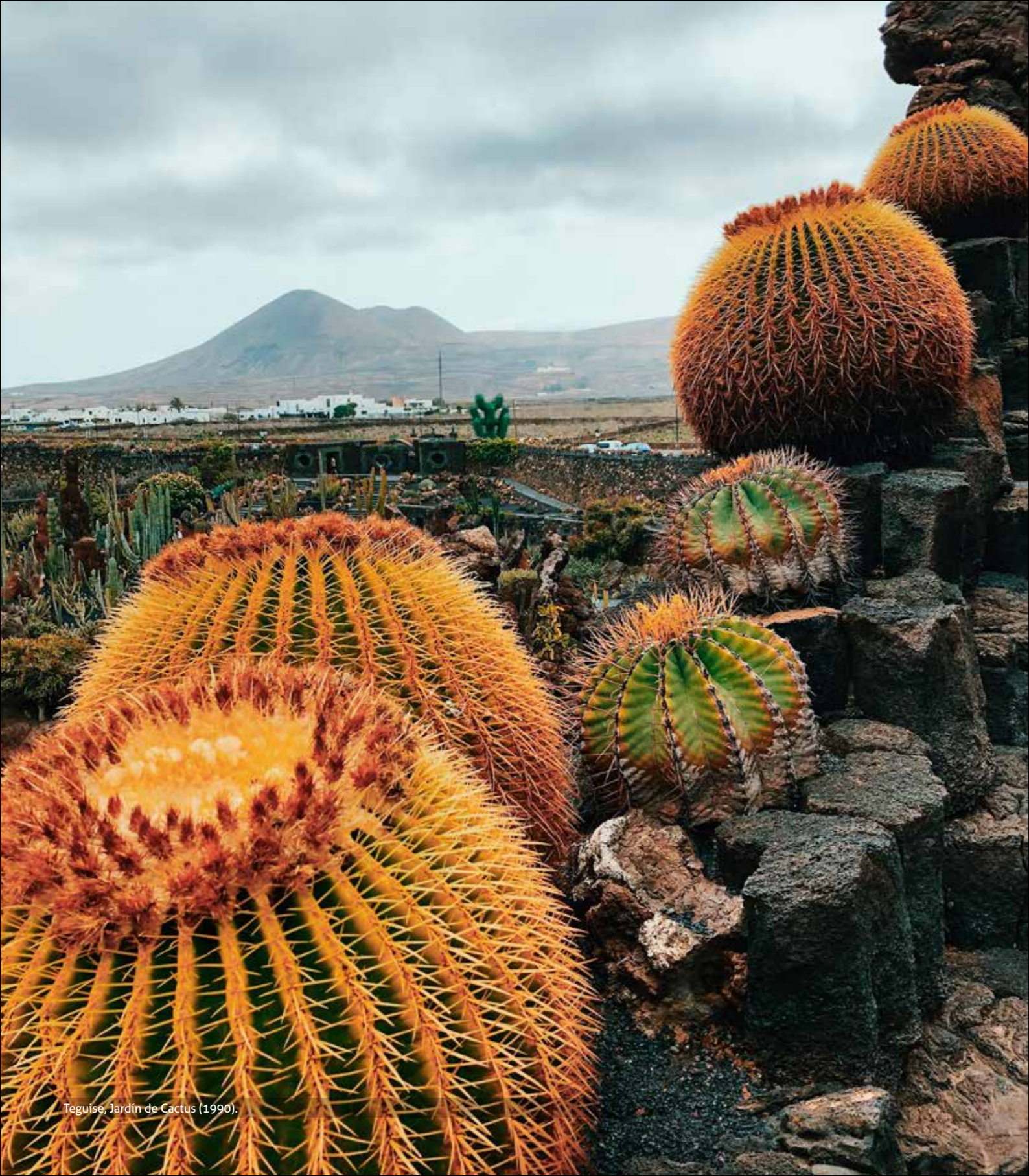
Teguise, Jardín de Cactus (1990).