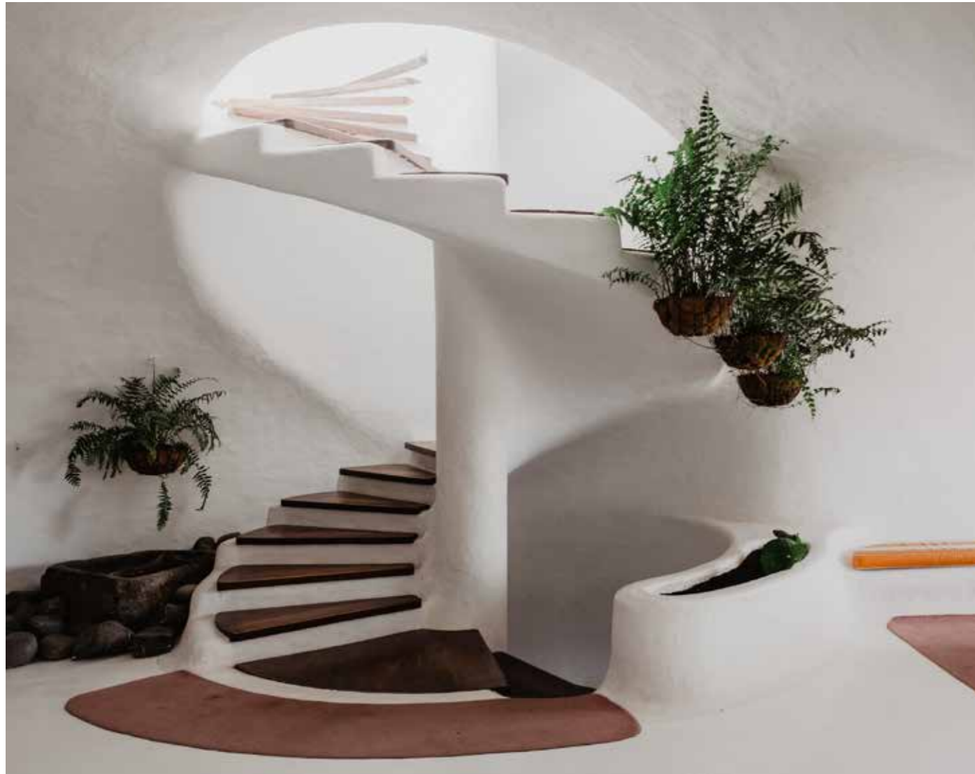
Escalier à l'intérieur du Mirador del Río.