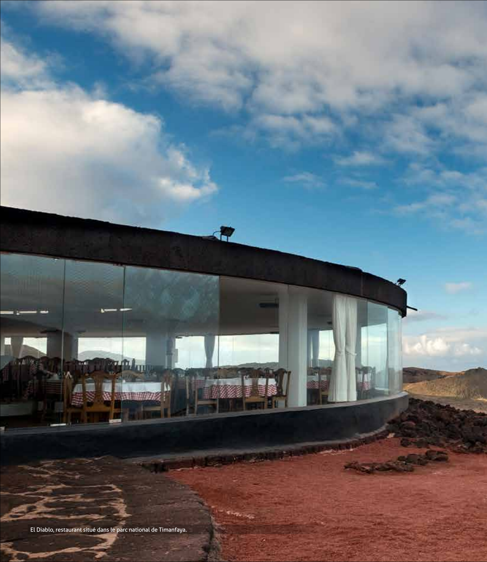
El Diablo, restaurant situé dans le parc national de Timanfaya.