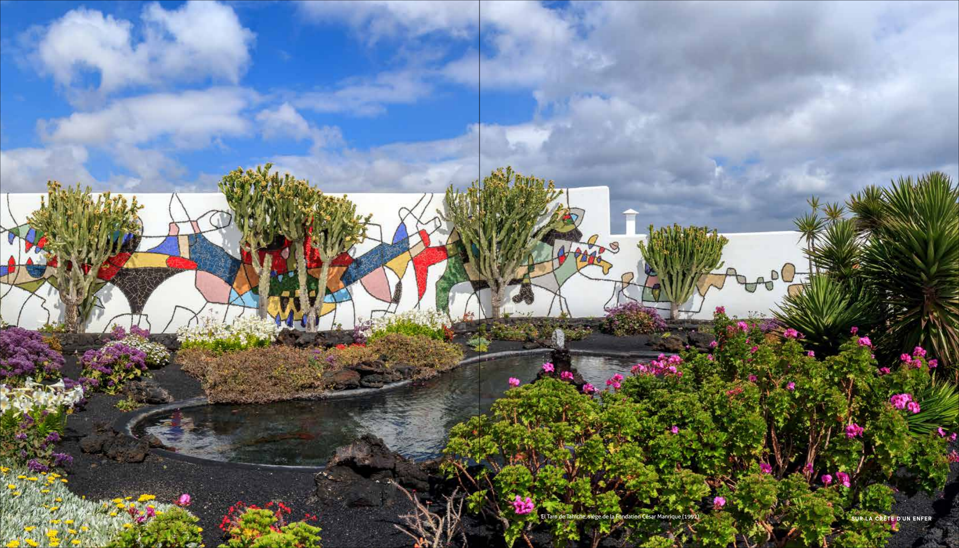
El Taro de Tahiti, siège de la Fondation César Manrique (1992).