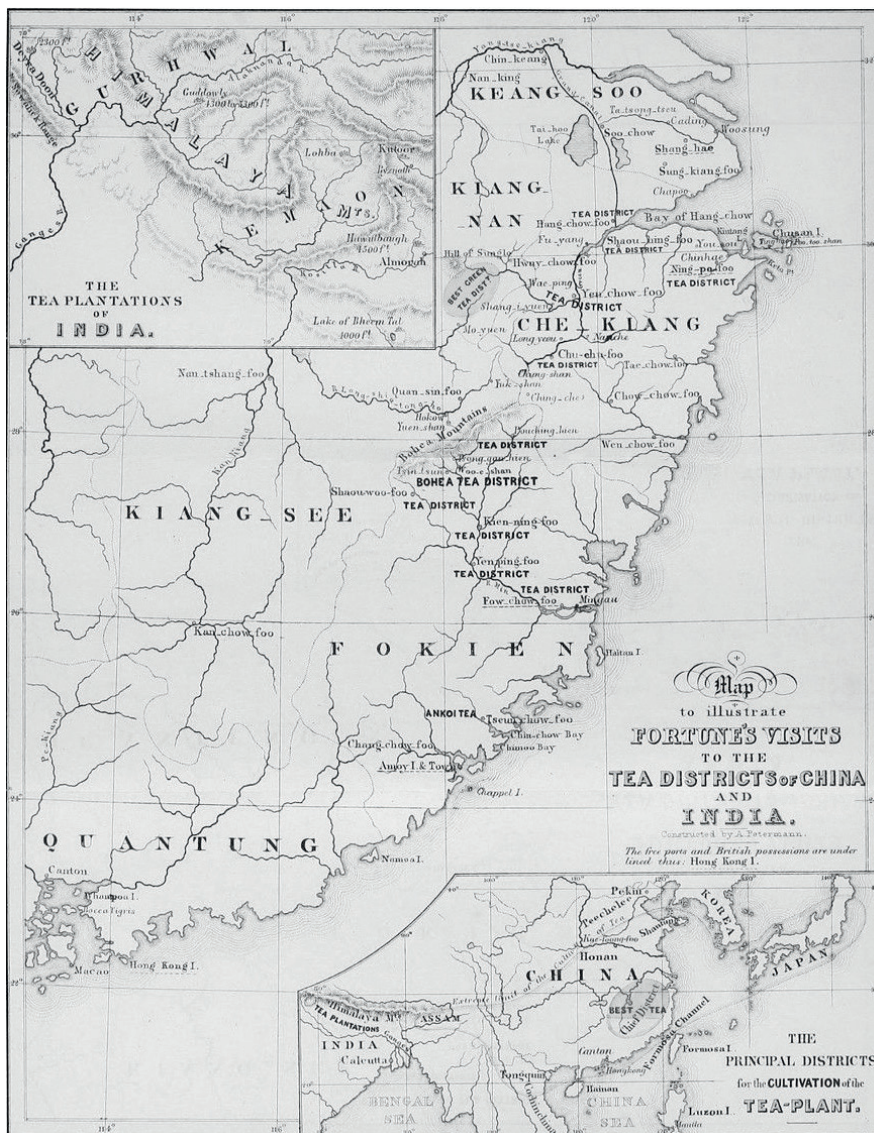
1. Carta del viaggio effettuato da Robert Fortune nel 1848 nei distretti del tè in Cina.

«Coloro che vorrebbero, come delle aquile, elevarsi alla conquista del cielo dimenticano, contemplando tali altitudini, tutte le loro ambizioni. Coloro che amano governare gli affari di questo mondo perdono, gli occhi incollati su questi valloni, ogni desiderio di tornarvici» 1 , Wu Jun (469-520), Lettera a Song Yuansi .