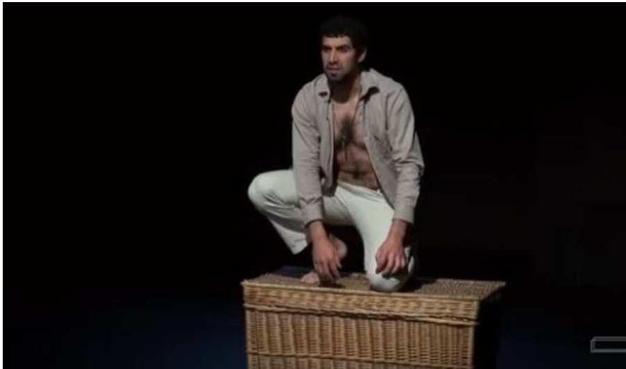
Les oranges , de Aziz Chouaki, mise en scène Laurent Hatat, Lille, Théâtre du Nord, 2012 (disponible sur Youtube : LES ORANGES d'Aziz CHOUAKI - EXTRAITS (5 minutes) ; mise en ligne par Théâtre du Nord, 23 juin 2012. https://www.youtube.com/watch?v=RQV8p18wfmw [consulté le 11 juillet 2023].)