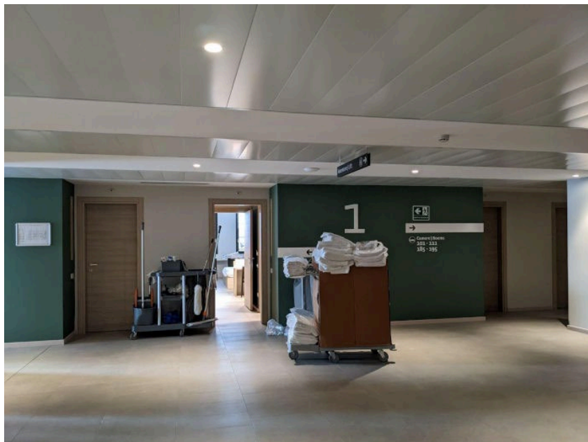
Figure 3 : Faire les chambres : la propreté au quotidien (Photographie de Margot Delon, octobre 2022, Turin)

Mais plus encore, ce sont les standings et niveaux de prestation qui distinguent l'offre student hotel de la résidence universitaire : la différence se mesure dans les matériaux, les couleurs, le mobilier utilisés, et dans les prestations liées à l'accueil.