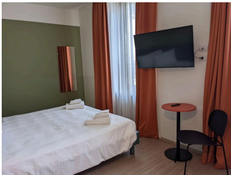
Figure 1 : Écran plat, lit double et rideaux assortis : une chambre aux allures d'hôtel (Photographie de Margot Delon, octobre 2022, Turin)

Comme la terminologie le laisse entendre, les student hotels – contraction de logement étudiant et de service hôtelier – désignent une offre de résidences étudiantes privées dotées de services augmentés par rapport aux résidences universitaires habituelles. Proposés par de multiples opérateurs, ces résidences d'un nouveau type partagent des caractéristiques communes. Les logements sont individuels ou à deux lits (pour le marché italien), équipés et fournis de linge et accompagnés d'un ensemble de services (notamment de nettoyage) et différentes aménités. On y trouve des salles de détente (généralement équipée d'une télévision, parfois d'un vidéo projecteur, très souvent d'un babyfoot et d'assises confortables), une buanderie, des salles de travail et de réunions. De nombreux student hotels disposent d'une salle de musculation et parfois d'équipements sportifs qui peuvent être loués à des usagers extérieurs sur certains créneaux.