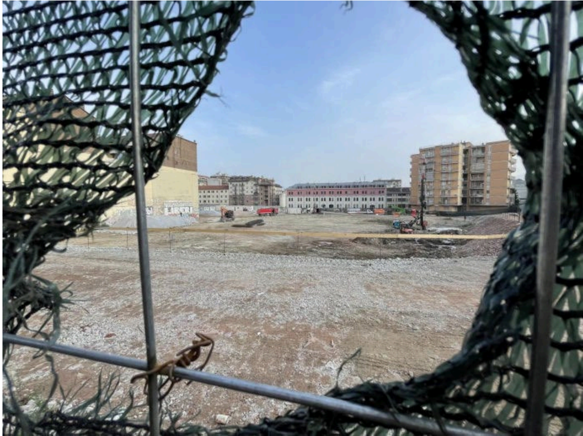
Figure 5 : Le chantier de TSH : student hotel en devenir (Photographie de Magda Bolzoni, octobre 2022, Turin)