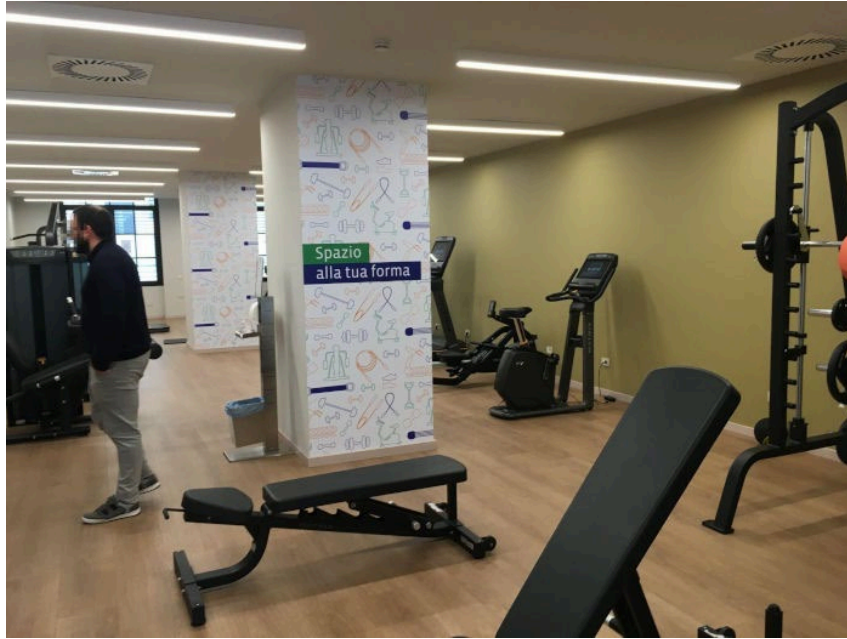
Figure 2 : Espace sportif interne à la résidence (Photographie d'Hélène Dang Vu, octobre 2022, Turin)

Mais plus encore, ce sont les standings et niveaux de prestation qui distinguent l'offre student hotel de la résidence universitaire : la différence se mesure dans les matériaux, les couleurs, le mobilier utilisés, et dans les prestations liées à l'accueil.