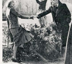
ALLEGRO VELOCE au début de l'interview, puis, à la fin, LENTISSIMO.