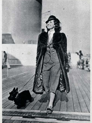
LA SUPRÊME CONSÉCRATION, EN 1937, LE DÉPART SUR « NORMANDIE » POUR L'AMÉRIQUE, HOLLYWOOD. ELLE EST GLORIEUSE ET ELLE A VINGT ANS.