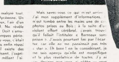
ALLEGRETTO MA NON TROPPO: une vallette pour cacher les factes de rousseur, une calotte cardinalienne.