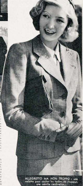
ALLEGRETTO MA NON TROPPO: une vallette pour cacher les factes de rousseur, une calotte cardinalienne.