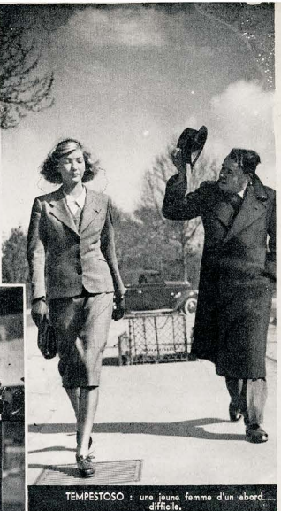
TEMPESTOSO: une jeune femme d'un abord difficile.