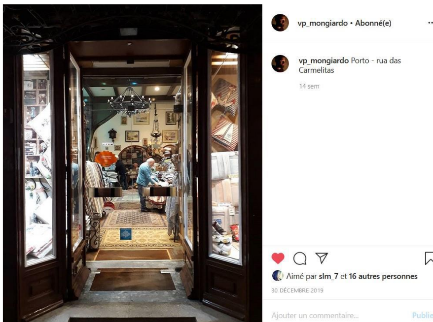
Figure 3 - Magasin Madureira. Rue des Carmelias, Baixa, Porto. Date : 30 décembre 2019

La photo de la Casa Madureira (figure 3) traduit la nécessité de protéger le commerce traditionnel : un patrimoine à protéger, car il valorise les traditions, le tissu social, mais aussi les lieux. Ces magasins constituent l'âme de la ville de Porto.