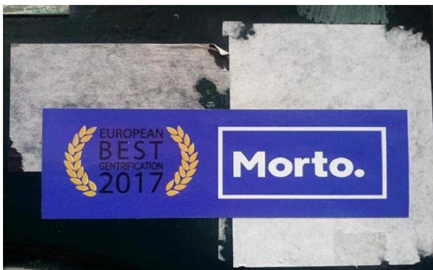
Figure 1 – Collage sur un mur du centre-ville : « Meilleure gentrification européenne 2017. Mort. »

Le collage sur le mur « Meilleure gentrification européenne 2017. Mort. » (figure 1) mobilise l'identité graphique de la ville « Porto. » et se réfère au prix de la meilleure destination européenne obtenu en 2017.