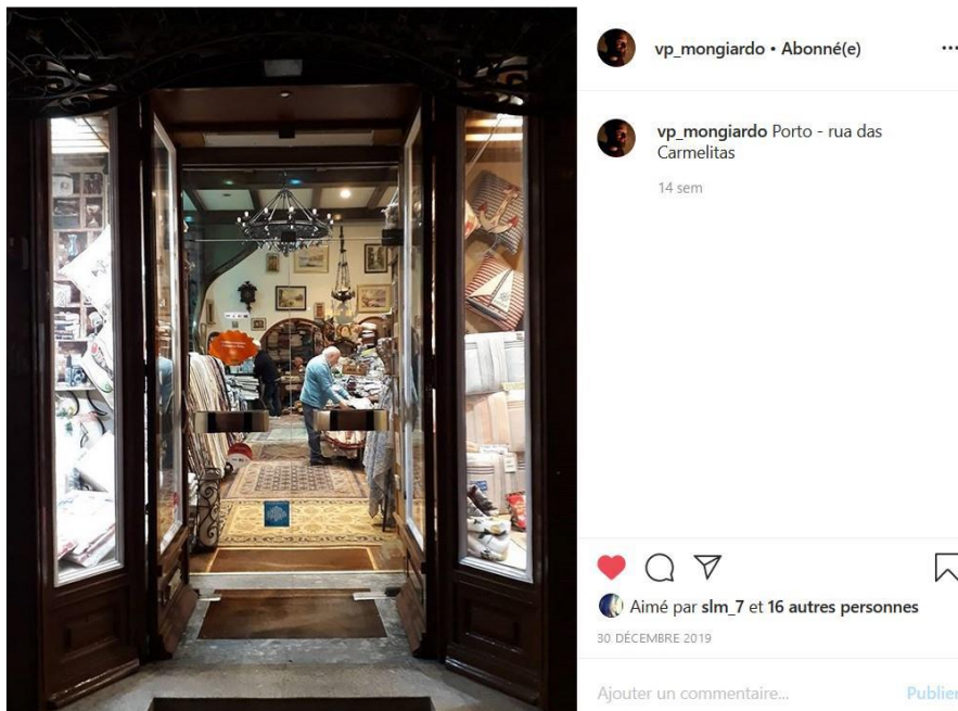
Figure 3 - Magasin Madureira. Rue des Carmelias, Baixa, Porto. Source : Capture d'écran d'un profil Instagram. Date : 30 décembre 2019 (Photo : Vincenzo Mongiardo)

La photo de la Casa Madureira (figure 3) traduit la nécessité de protéger le commerce traditionnel : un patrimoine à protéger, car il valorise les traditions, le tissu social, mais aussi les lieux. Ces magasins constituent l'âme de la ville de Porto.