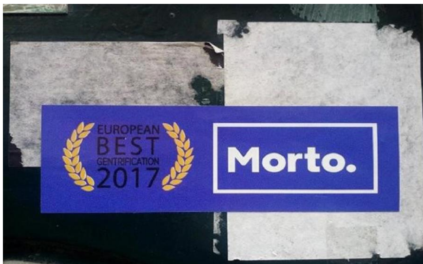
Figure 1 – Collage sur un mur du centre-ville : « Meilleure gentrification européenne 2017. Mort. »

Le collage sur le mur « Meilleure gentrification européenne 2017. Mort. » (figure 1) mobilise l'identité graphique de la ville « Porto. » et se réfère au prix de la meilleure destination européenne obtenu en 2017.