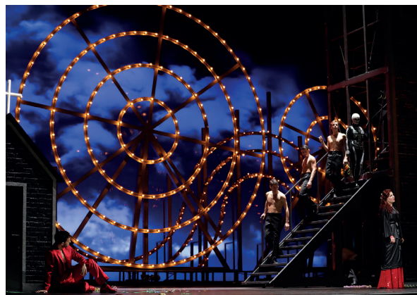
„Thaïs“ an der Mailänder Scala im Februar 2022 (Musikalische Leitung: Lorenzo Viotti, Inszenierung: Olivier Py)

„Thaïs“ gehört zu den französischen Meisterwerken des 19. Jahrhunderts, deren Erfolg bis heute anhält. Die Neuausgabe eröffnet den Bühnen nun die Möglichkeit, neben der tradierten auch die Alternativen der beiden weiteren autorisierten Fassungen zu rekonstruieren.