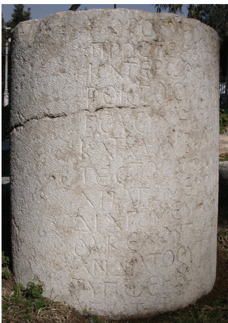
Fig. 2. L'inscription d'asylie au Musée national de Damas : vue de la partie gauche du texte.

La copie et les photos réalisées lors de l'étude de l'inscription dans les années 2008-2010 permettent aujourd'hui de rectifier l'édition d'un document important pour l'histoire de la cité de Damas à l'époque protobyzantine (fig. 2-4). L'examen du tambour de colonne qui porte le texte révèle tout d'abord que cet élément architectural n'est pas taillé dans du granite jaunâtre, contrairement à ce qu'indique N. Giron, mais dans le calcaire blanc de la Damascène omniprésent dans les constructions de la ville antique. Le bloc présente une hauteur de 95 cm pour un diamètre de 78 cm. La netteté de sa taille en bas montre qu'il est conservé dans son état originel. L'inscription, qui n'est complète qu'en haut, devait se poursuivre sur un autre tambour appartenant à la même colonne. Le texte, quant à lui, est gravé en lettres hautes de 4 à 6,5 cm. Bien qu'irrégulière dans son ductus , l'écriture est soignée et assez peu typée. Elle relève de la capitale de style tardif ordinaire. Les formes les plus remarquables sont celles de l'alpha dissymétrique dessinant à gauche un angle aigu, des epsilon, théta, omicron, sigma et oméga lunaires, du kappa aux traits obliques courts et de l'upsilon aux branches incurvées. On ne relève aucune ligature. Outre la croix initiale, le seul ornement visible est le motif sinueux en forme de S qui est gravé entre les deux hastes et au-dessus de la barre médiane du large éta de la ligne 5 et qui ne peut correspondre ici à un signe d'abréviation.