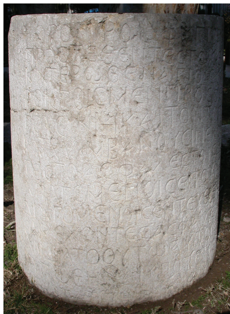
Fig. 3. L'inscription d'asylie au Musée national de Damas : vue de la partie centrale du texte.