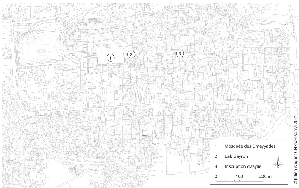
Fig. 1. La mosquée des Omeyyades et le lieu de découverte de l'inscription d'asylie.