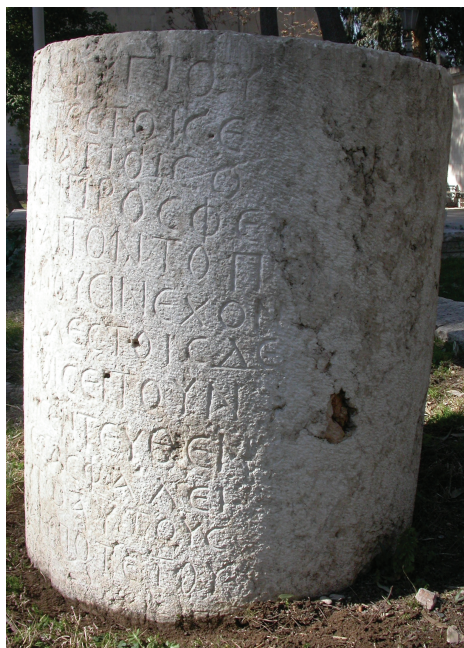
Fig. 4. L'inscription d'asylie au Musée national de Damas : vue de la partie droite du texte.

La révision du bloc permet d'établir un texte à l'orthographe et à la syntaxe impeccables :