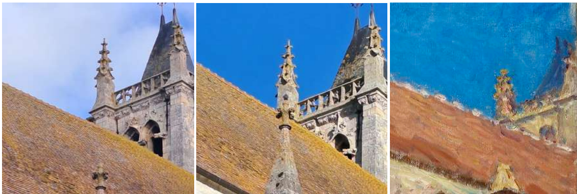
Fig. 4. La face ouest de la tour, à gauche vue depuis le premier étage du 1 rue du Puits du Four (© Sophie A. de Beaune), au centre vue du trottoir, en se plaçant devant la fenêtre du salon (© Sophie A. de Beaune) ; à droite chez Sisley.

En revanche, les deux photographies ci-après (fig. 5), prises l'une depuis la fenêtre du salon, l'autre depuis le trottoir un peu en avant de la fenêtre, donnent une vue remarquablement proche de ce qui apparaît chez Sisley. En particulier, le portail, le larmier, la gargouille sud, la fenêtre surmontant la balustrade et la face ouest de la tour s'y présentent de la même manière que dans ses tableaux. Il faut donc penser qu'il posait sa chaise sur le trottoir en tournant le dos à la fenêtre ou se réfugiait dans le salon quand le temps menaçait.