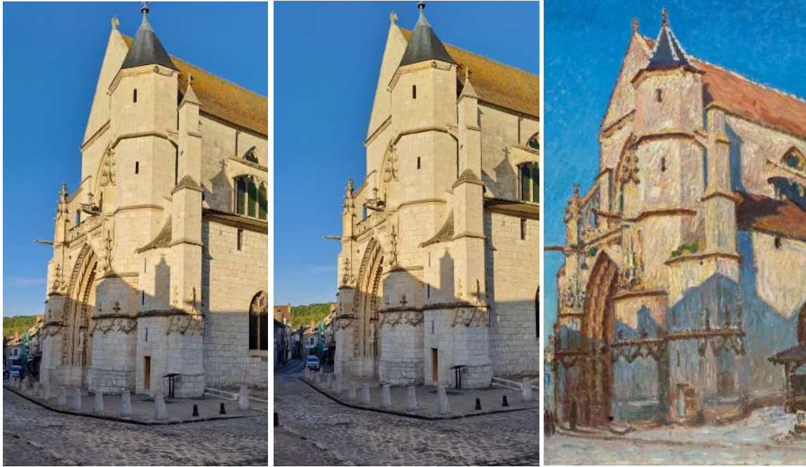
Fig. 5. À gauche : l'église de Moret, vue du trottoir, en se plaçant devant la fenêtre du salon. Au milieu : l'église de Moret vue par la fenêtre du salon du rez-de-chaussée. À droite, Sisley, 1894 (détail).