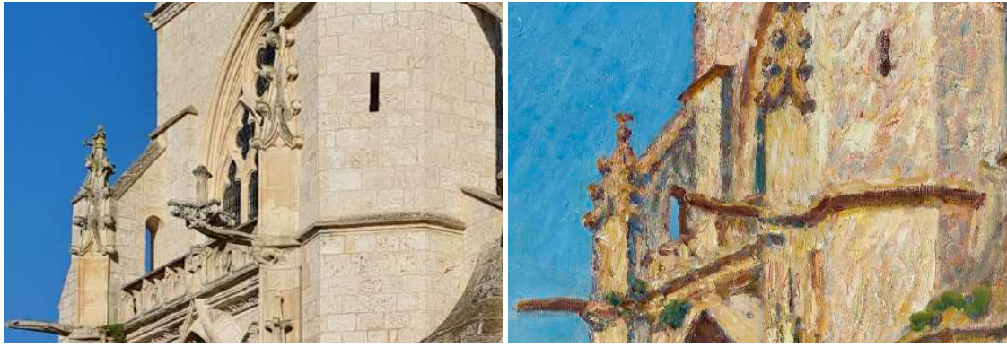
Fig. 2. La gargouille sud de la façade occidentale et la fenêtre lobée surmontant la balustrade, à gauche vues depuis le perron du 1 rue du Puits du Four, à droite chez Sisley.