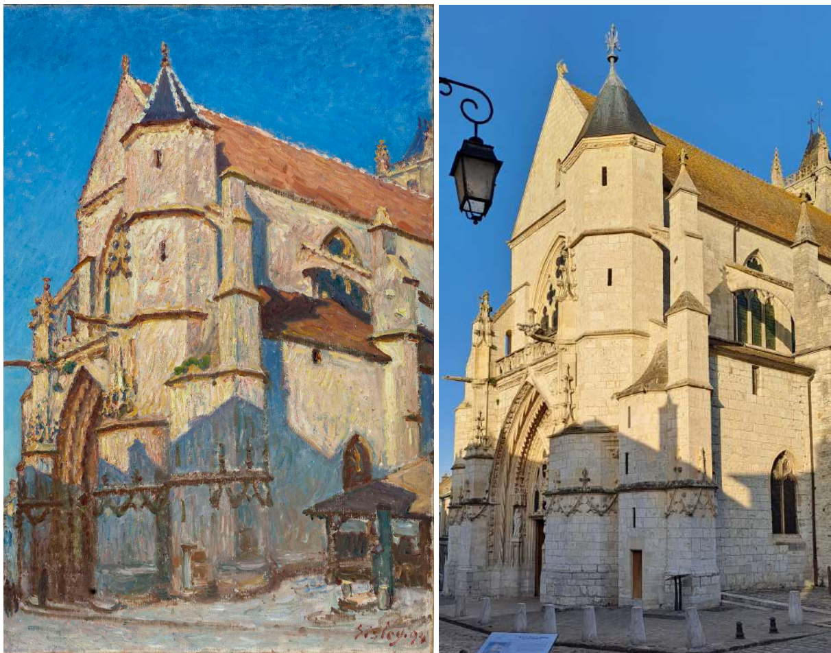
Fig. 1. À gauche : l'église de Moret, par Sisley, 1894 (détail). © Musée du Petit Palais. À droite : l'église de Moret, vue depuis le porche du 1 rue du Puits du Four. © Sophie A. de Beaune.