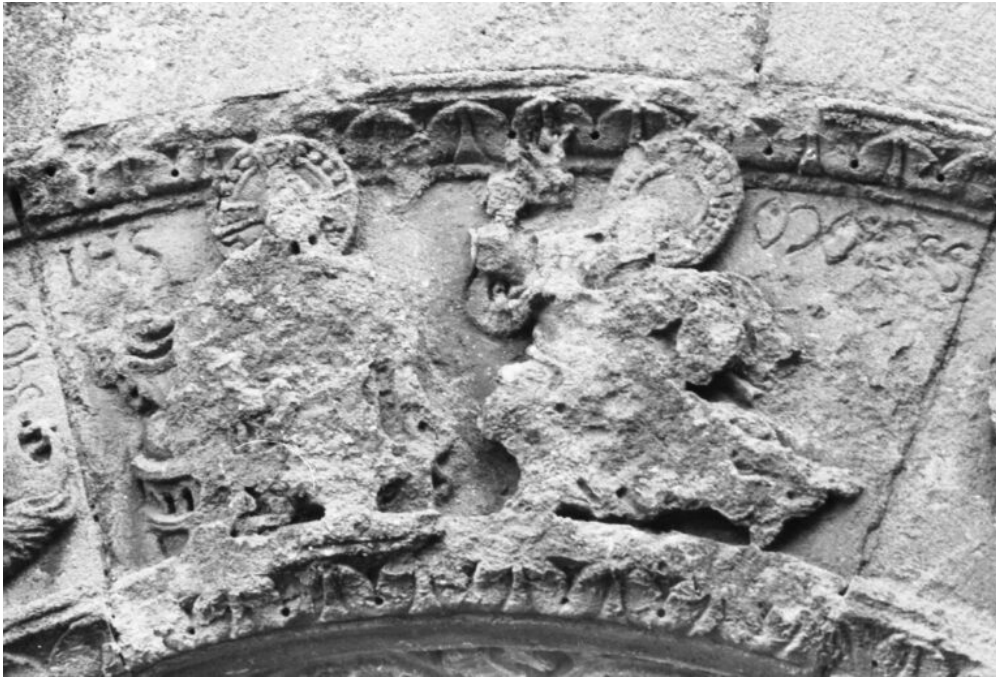
Fig. 2 : Identification dans la scène de la Transfiguration. Charliu, ancien prieuré Saint-Fortunat, portail

phabétiques et les signes iconiques dès lors que l'intention esthétique le requiert 8 . Les liens entre écriture et image sont évidents dans leur réalité documentaire ; on trouve de l'écriture partout dans l'image, en Occident comme en Orient, à tel point qu'on finit par ne plus la voir et ne plus la lire, et qu'on évite ainsi de s'interroger sur ce que l'écriture fait à l'image et inversement. On confond l'omniprésence de ce lien avec le systématisme. On trouve certes de très nombreux exemples de cette co-présence, en Bourgogne comme ailleurs, mais cela ne veut pas dire que toutes les images sont complétées par une inscription. Le Moyen Âge n'a élaboré aucune norme à ce sujet, et il faut donc voir dans chacune de ces rencontres un choix, une décision plastique et technique qui cherche à produire un sens particulier de l'objet inscrit.