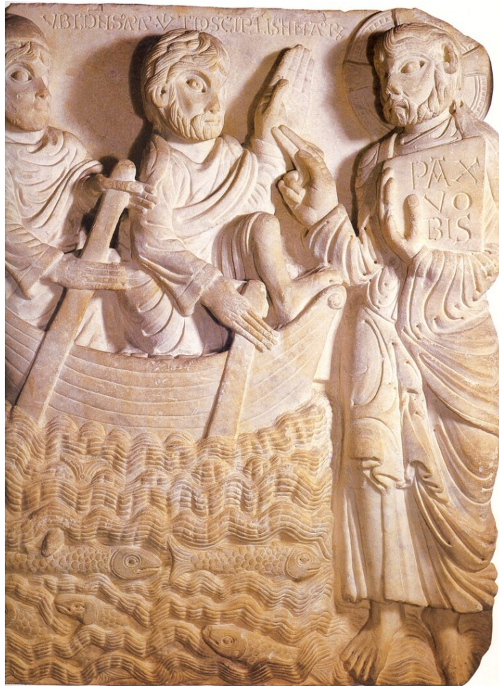
Fig. 15 : Scène de la pêche miraculeuse. Barcelone, musés Mares

regardeur d'une part, et pour s'interroger sur la fonction des scènes dans le parcours spirituel de celui qui franchit le portail de Saint-Lazare.