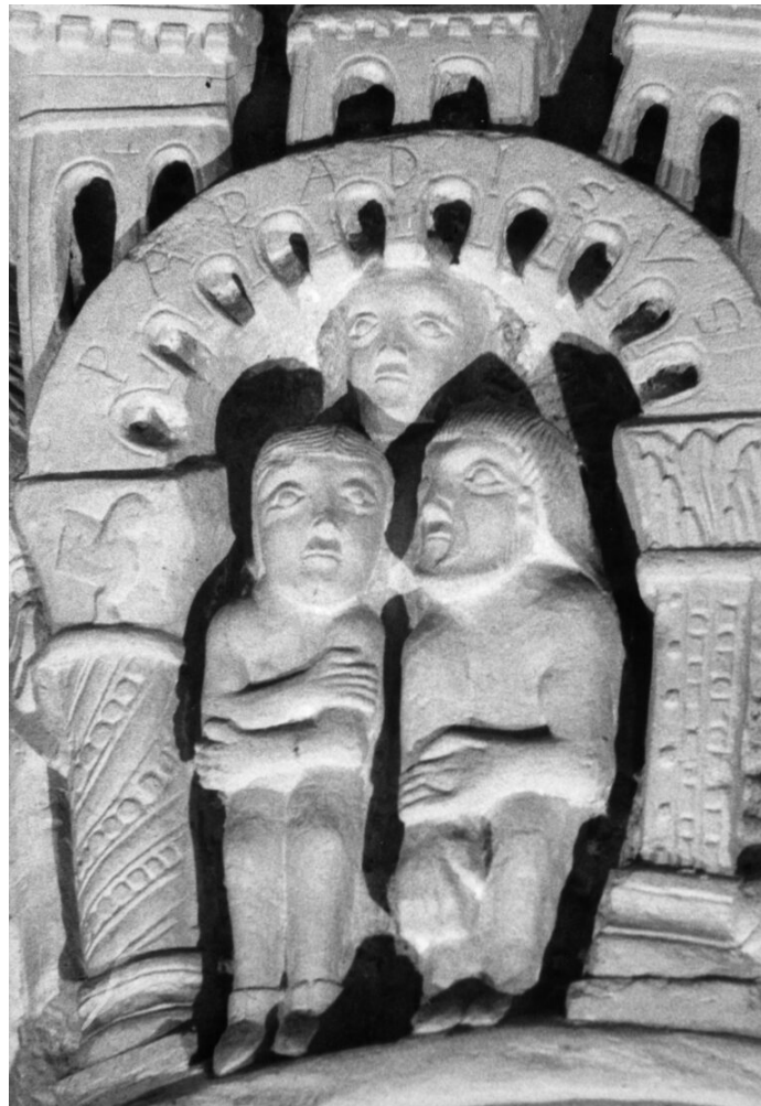
Fig. 13 : Identification du Paradis. Saint-Révérien, église, chapiteau de la deuxième colonne du rond-point, côté sud