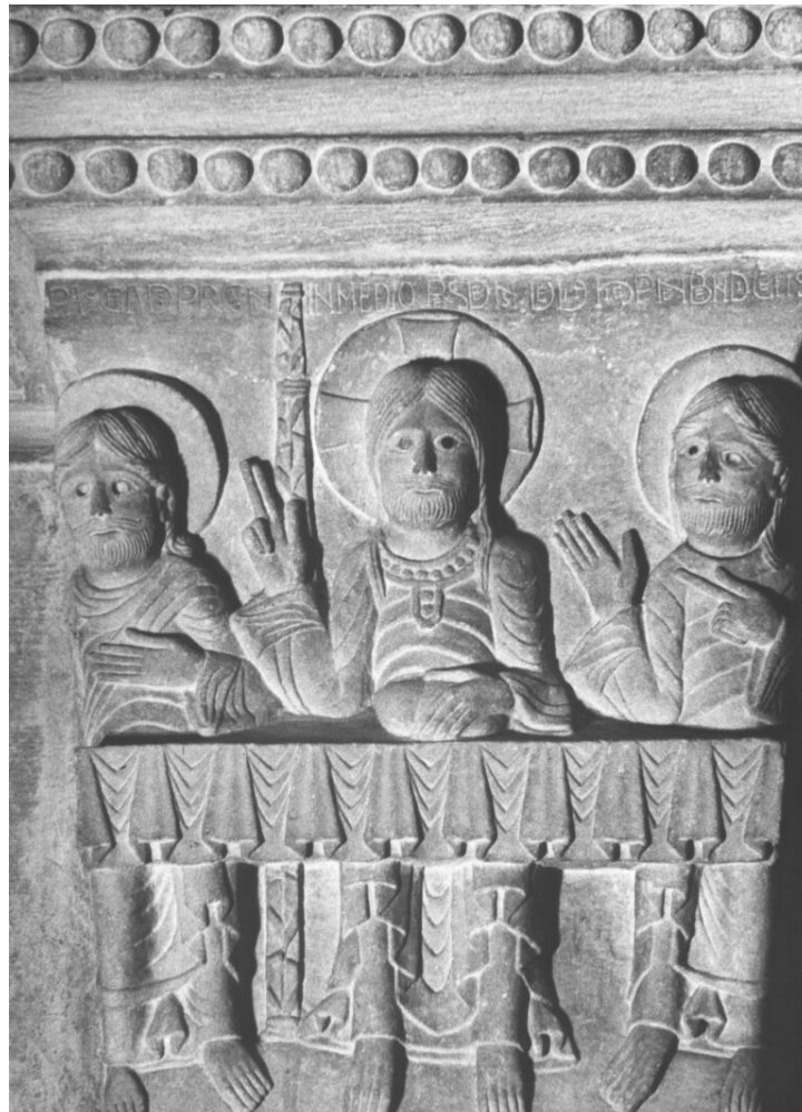
Fig. 6 : Chapiteau des disciples d'Emmaüs, face principale. Chalon-sur-Saône, cathédrale, sanctuaire, pilier séparant le chœur du bas-côté nord