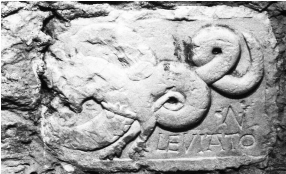
Fig. 3 : Relief du Leviathan. Tournus, abbatale Saint-Philibert