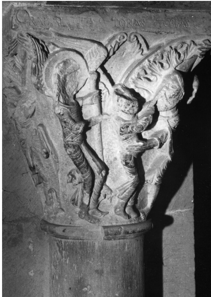
Fig. 4 : Chapiteau de Tobie. Vézelay, église abbatiale de la Madeleine