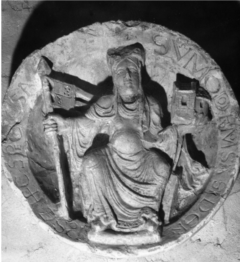
Fig. 9 : Clé de voûte de l'église de l'eccllesia. Vézelay, musée lapidaire (prov. : église, pilier entre la nef et le bas-côté sud)

contenant la figure féminine tenant dans sa main gauche une petite église et un étendard dans sa main droite (fig. 9). L'inscription donne le texte suivant : Sum modo fumosa sed ero post hec speciosa (« Je suis maintenant enfumée, mais après cela je serai d'une grande beauté ») 23 . Titulus ô combien paradoxal puisqu'il apparaît tout à fait en décalage avec le contenu de l'image, splendide, triomphante, monumentale, éternelle – en un mot, speciosa . Le présent de sum modo fumosa paraît révolu dans l'image du médaillon, et le futur de ero semble déjà accompli dans la sculpture, que ce soit dans la figure féminine ou dans la maquette de l'église. Le titulus permet ainsi de faire entrer de l'histoire dans la sculpture et d'indiquer ce qui ne s'y trouve pas ou plus.