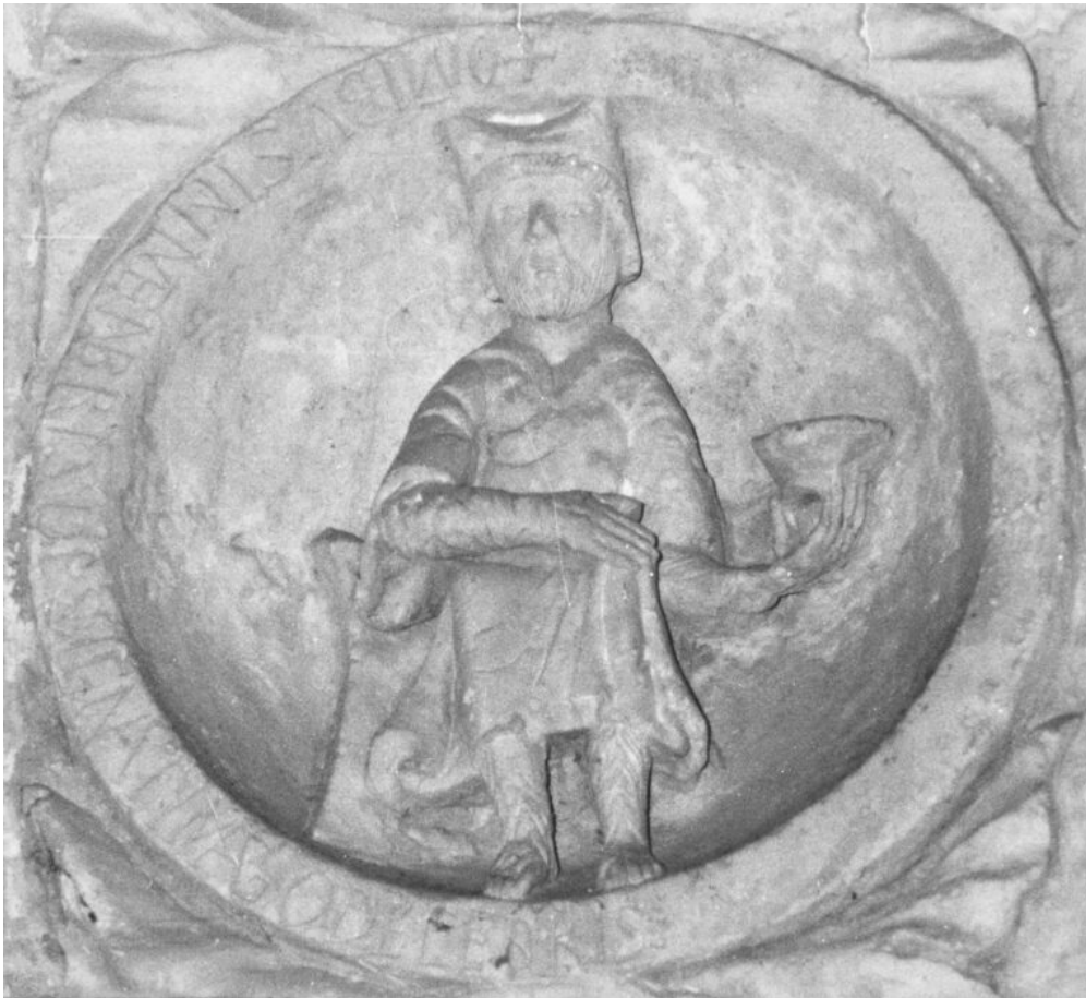
Fig. 14 : Le mois de décembre. Vézelay, La Madeleine, narthex, porte centrale, voussure interne, premier médaillon à droite