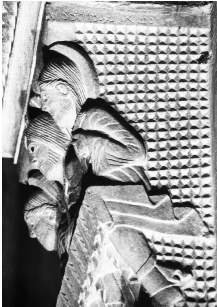
Fig. 7 : Chapiteau des disciples d'Emmaüs, face latérale. Chalons-sur-Saône, cathédrale, sanctuaire, pilier séparant le chœur du bas-côté nord