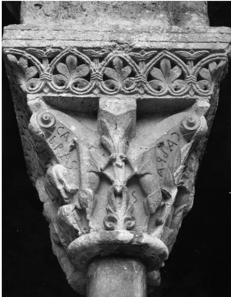
Fig. 5 : Chapiteau de l'Annonciation. Moissac, cloître de l'abbaye Saint-Pierre

Il ne faut sans doute pas considérer ces inscriptions comme des textes d'identification à l'attention d'un lecteur potentiel qui trouverait dans l'écriture le moyen de pallier les limites de l'image à signifier. Cela supposerait en effet que de telles limites existent pour le Moyen Âge, que le lecteur est plus à même d'accéder au sens de l'écriture qu'au sens de l'image, enfin que l'écriture est plus accessible matériellement que l'image. Peut-être convient-il davantage de voir dans ce recours à l'écriture brève un moyen de l'artiste pour produire une image évidente, indépendamment de la lecture du texte. Il n'y a donc pas d'identification mais d'institution de l'image par l'écriture, ce qui permet de dépasser une correspondance exacte entre ce que l'on voit et ce que l'on lit dans la sculpture romane.