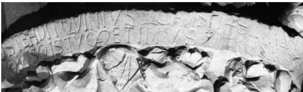
Fig. 12 : Musicien du cinquième ton. Cluny, Musée du Farinier

Dans la bibliographie, la richesse interprétative des inscriptions médiévales est souvent engloutie sous l'abondance des formes épigraphiques simples, composées d'un nom seul. Difficile en effet d'envisager une profondeur d'exégèse dans le mot paradisus tracé sur l'arcade abritant trois personnages