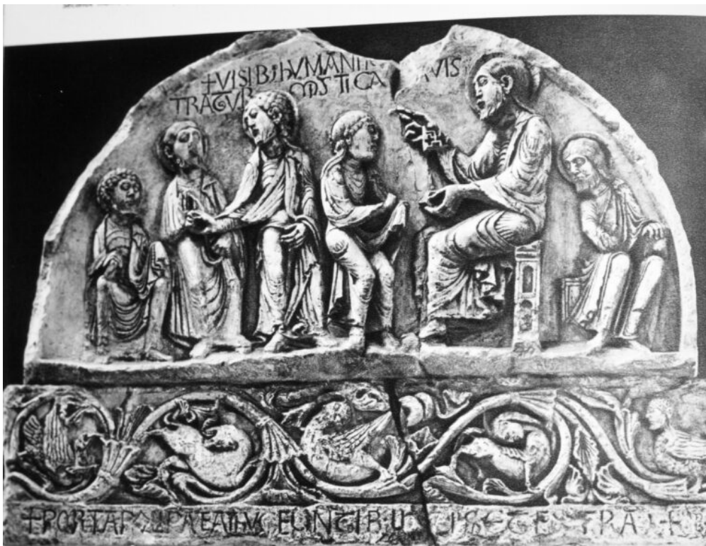
Fig. 8 : Tympan et linteau de l'ancien monastère Saint-Sauveur. Nevers, musée de la Porte du Croix

L'écriture poétique du titulus permet d'injecter du rythme dans l'image, de créer des relations avant/après entre les figures, ou encore de renvoyer à un état révolu de l'image, désormais absent de la peinture ou de la sculpture. On pourrait prendre, pour exemple paradigmatique d'un tel renvoi à l'histoire absente de l'image, la célèbre clé de voûte de l' ecclesia de Vézelay. Comme c'était le cas à Cluny, les sculpteurs ont ici fait le choix d'une disposition circulaire du texte, gravé sur le médaillon