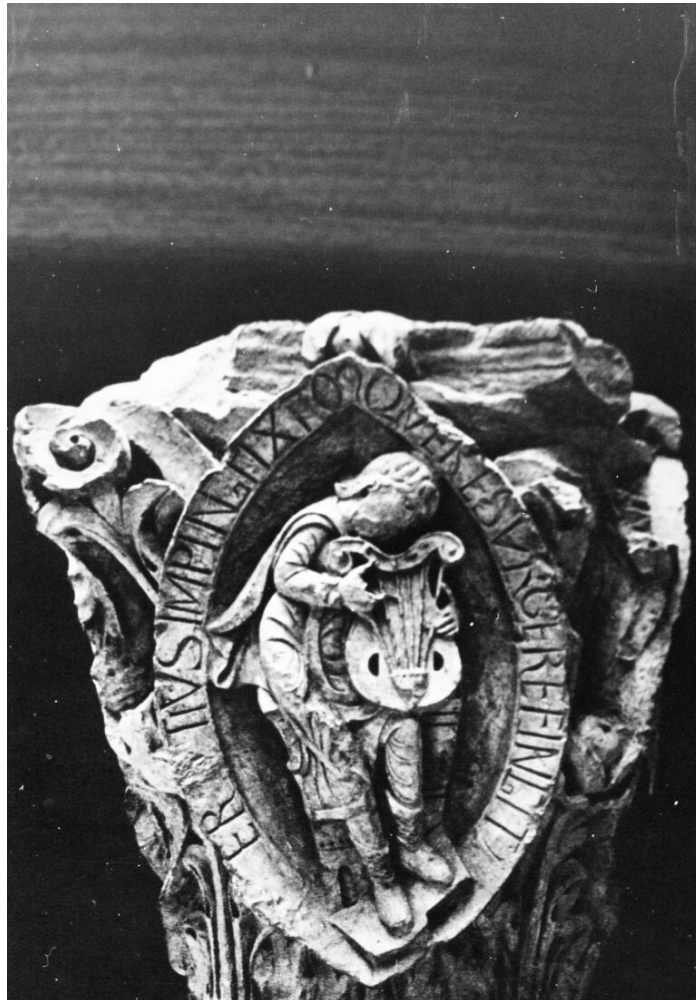
Fig. 11 : Musicien du troisième ton. Cluny, Musée du Farinier

l'image de Cluny une vignette catéchétique. Les textes et les images de ces chapiteaux étaient sans doute difficile à voir et à lire depuis le sanctuaire, la complexité formelle et métrique réservait l'accès au sens à une part réduite du public médiéval, un public par ailleurs le plus à même de connaître déjà les enjeux interprétatifs de la conjonction texte/image. Les textes des chapiteaux de Cluny ne simplifient l'image en aucune manière, bien au contraire. Ils propulsent sur le champ épigraphique la signification profonde de l'image qui échappe à la mise en forme de la sculpture et convoque dans l'objet un univers entier de savoirs et d'interprétations.