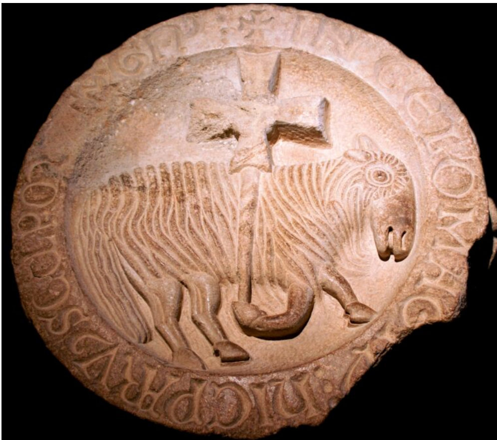
Fig. 1 : Clef de voûte de l'Agneau. Cluny, Musée Ochier

sculpture ou la peinture. Et l'on ne peut ignorer le nombre important de ces images médiévales qui mettent en scène un personnage ou un récit d'abord présent sous forme textuelle, à commencer par les Écritures, et pour lesquelles on peut effectivement remonter à la source de l'image par un cheminement linéaire d'équivalence et de redite. D'autres formules en revanche préfèrent puiser dans un ensemble de textes et de motifs des sujets recomposés par l'image sans que l'on puisse identifier précisément la source de la composition, ou au contraire choisir pour source de l'image une autre image 2 . Pour d'autres productions encore, c'est l'image qui se trouve à l'origine d'un texte qui la décrit ou la commente. Les cas de figure sont donc nombreux et défient la linéarité d'une relation source-illustration ; il convient dès lors d'envisager un fonctionnement complexe, beaucoup plus en prise avec les relations médiévales entre motifs, qui placent les textes et les images dans un même réseau de significations au sein duquel les motifs, les thèmes, les sujets et les narrations circulent sans hiérarchie et sans direction, façonnant à chaque nouveau rebond dans le texte ou dans l'image une petite parcelle de la culture médiévale.